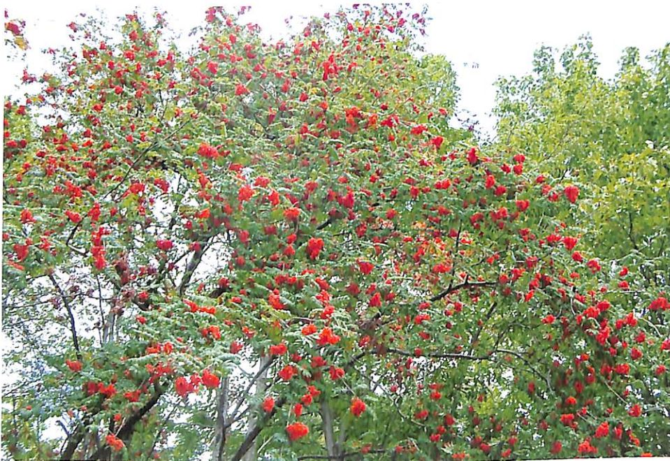
Od svega šumskoga drveća ne vidjeh ljepše stablo od jarebike. (Damir Drvodelić)