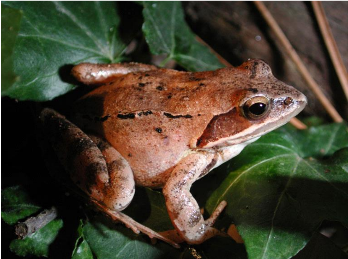
Slika 10. Tamnosmeđe pjege na leđima imaju šumske smeđe flabe

fiabe ( Ranidae ) imaju zube samo u gornjoj eljusti. Šumska smeđa flaba je mala flaba oko 5-9 cm vrlo dugih stražnjih nogu pomoću kojih može izvesti skokove i do nekoliko metara. Svjetlosmeđe je boje sa smećim prugama na stražnjim nogama i tamnosmećim pjegama na leđima ima oblika slova "V" (slika 10.). Mufljaci se razlikuju od ženki po tanjim prednjim udovima. Većinom je kopnena vrsta, nastanjuje otvorene šumske predjele i vlažne livade. Rasprostranjena je diljem sjeverne, srednje i južne Europe. Zimi i u toplim suvremenim razdobljima sakriva se ispod osušenih stabala i kamenja ili se zakopava ispod vegetacije, a mufljaci često znaju prezimiti ispod zelenih bara i jezera. Razmnožavanje se odvija u proljeće kada se led počinje topiti, a jaja polažu u vodu u obliku grudastih nakupina (slika 11.).