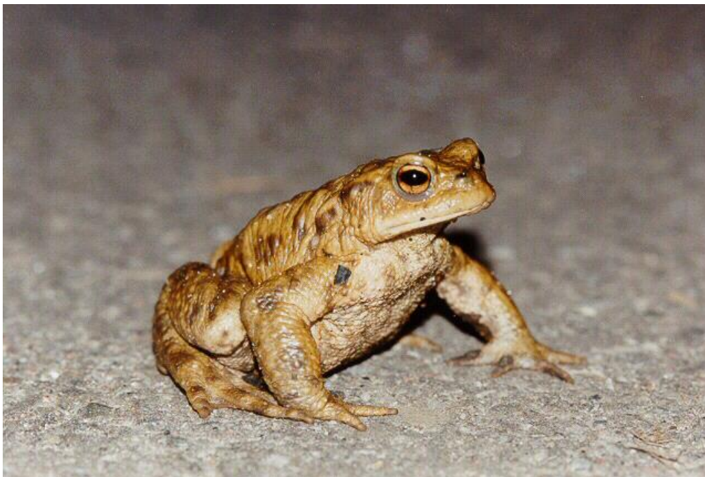
Slika 7. Sme a krasta a

Krasta e posjeduju zdepasto tijelo i tvrdu bradavi astu koflu. Nemaju zuba, a ni pliva e koflice. Ve inom borave na kopnu, slabo ska u pa su im prednje i straflnje noge gotovo jednake duljine. Najpoznatija krasta a je sme a krasta a (slika 7.) i ona je jedno od najrasprostranjenijih vodozemaca Europe, a nalazi se i u Aziji i na sjeverozapadu Afrike. fivot uglavnom provodi na kopnu, a nastanjuje listopadne –ume i –umarke, otvorena stani-ta (npr. livade) pa ak i urbana podru ja. Velika je 8-20 cm i njave a je flaba Hrvatske, tako er ima bradavice ili bodlje na kofli i velike bakrene ili zlatne o i. fienke su obi no puno ve e od mufljaka, posebice tijekom sezone parenja tj. prolje a jer im tada tijelo sadrfli jaja. Za vrijeme razmnoflavanja mufljacima se razvijaju pal ani fluljevi kojima se slufle kako bi vr– e prihvatili flenku. Okupljaju se u barama, a flenke omotavaju vrpce s jajima oko podvodnog bilja. Hrani se kukcima, pufljevima i ostalim manjim flivotinjama. Uglavnom je no na flivotinja, dok se po danu skriva ispod su-enog drve a i u drugim vlaflnim mjestima. Iza o iju joj se nalaze parotidne flijeзде koje izli uju nadrafluju e tvari pomo u kojih odbijaju grabefljljivce, a kad uo i opasnost guta zrak, napuhuje se i propinje na prste da izgleda ve e. Unato svemu rijetko grize i nije prijetnja za ovjeka.