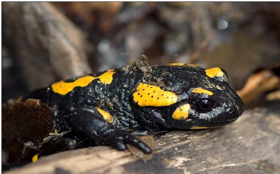
Slika 3. Vidljive otrovne žlijezde iza oči

Šareni daždevnjak je veličine 18-28 cm i ima upadljive boje koje služe kao upozorenje grabljivcima da je otrovan. Boja mu ovisi o geografskom položaju, pa može biti crna s crnim mrljama i prugama ili crno-crna, a crna boja može biti zamijenjena narančastom ili crvenom bojom. Iza oči mu se nalaze otrovne žlijezde (slika 3.) koje proizvode izlučevine koje izazivaju neugodnost pri konzumaciji. Potpuno je kopnen, te obitava u listopadnim šumama i umjerenim predjelima gorskih područja. Rasprostranjen je po Africi, Europi i na zapadu Azije. Zimu provodi pod zemljom, a najaktivniji je noću, osobito nakon kiše, te tada izlazi iz rupa ispod sušenih stabala ili kamenja. Hrani se gujavicama, puflavicama, kukcima i njihovim ličinkama. Razmnožava se u proljeće i ljeto, nakon velikih kiša. Tokom parenja mužjak sa gornje strane drži ženku i ispušta spermatofoore, nakon toga se lagano odbaci sa strane kako bi omogućio ženki da ih pokupi. Jaja se razvijaju u unutrašnjosti ženke do stadija ličinke, pa može doći i do pojave kanibalizma u jajovodu kada ličinke koje se brzo razvijaju počinju jesti druge manje ličinke i jaja. Ženka izbacuje mlade u bare ili potoke. Kod nekih populacija u višim predjelima mladi se u ženkinom tijelu razvijaju čak do odraslog stadija.