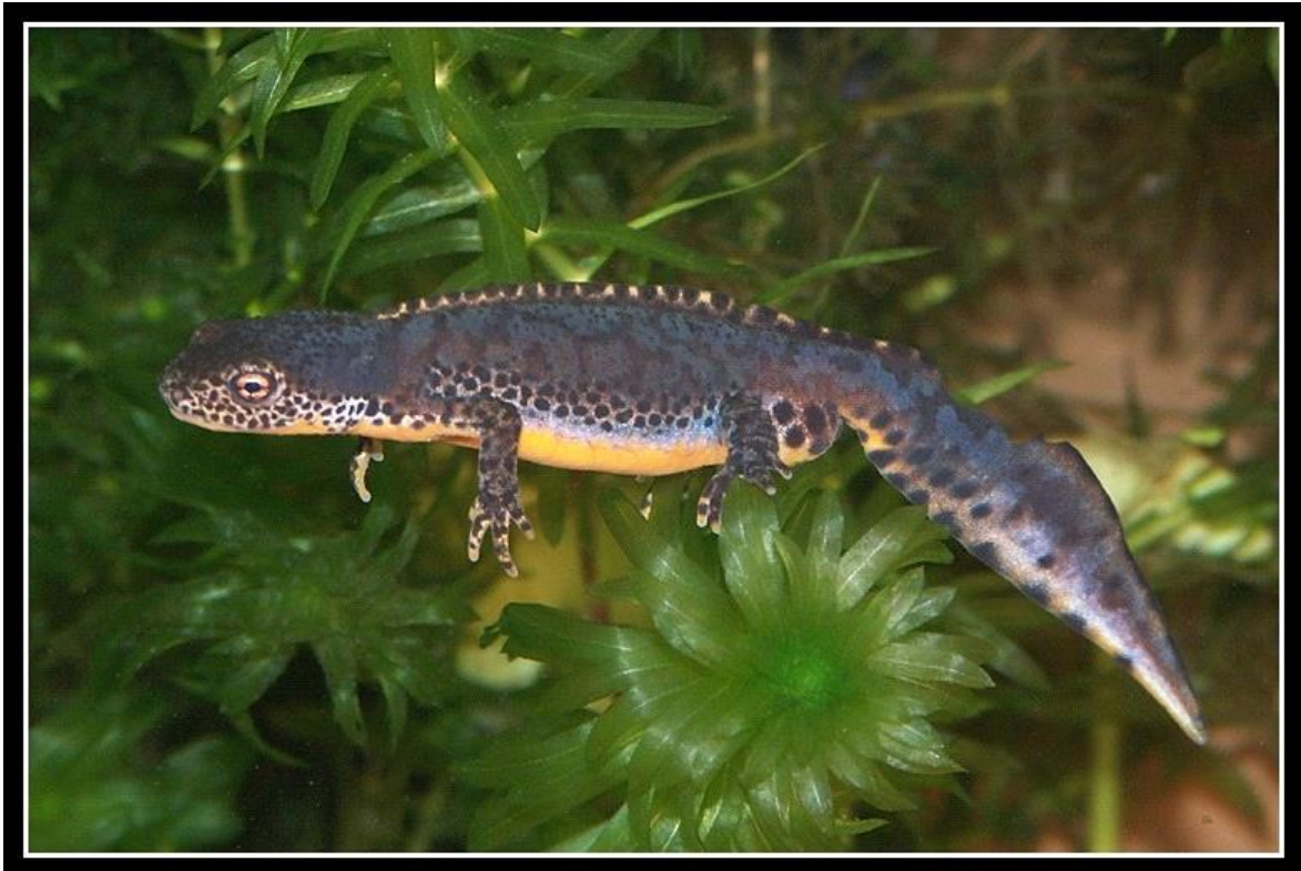
Slika 2. Karakteristične crno-bijele mrlje i krijesta mufljaka

Planinski vodenjak ima malo tijelo dugo 6-12 cm koje je sa gornje strane plave boje, a s donje naranaste i kratak rep. Većinu života obitava na kopnu, a nastanjuje planine i brda, te stajaće vode i močvare Europe. Tijekom parenja, u proljeće, mufljacima se pojavljuje crno-bijela krijesta, crno-bijele mrlje duž bokova (slika 2.) i povećavaju im se neisnicama. Koriste i se lepezastim pokretima repa mufljak se udvara ženki tako da izdaje svoje feromone prema njezinoj njušci. Na Balkanu se nekad dogodi da planinski vodenjak cijav svoj životni ciklus provede pod vodom te zadržava značajke ličinke u odrasloj dobi (npr. vanjske krage).