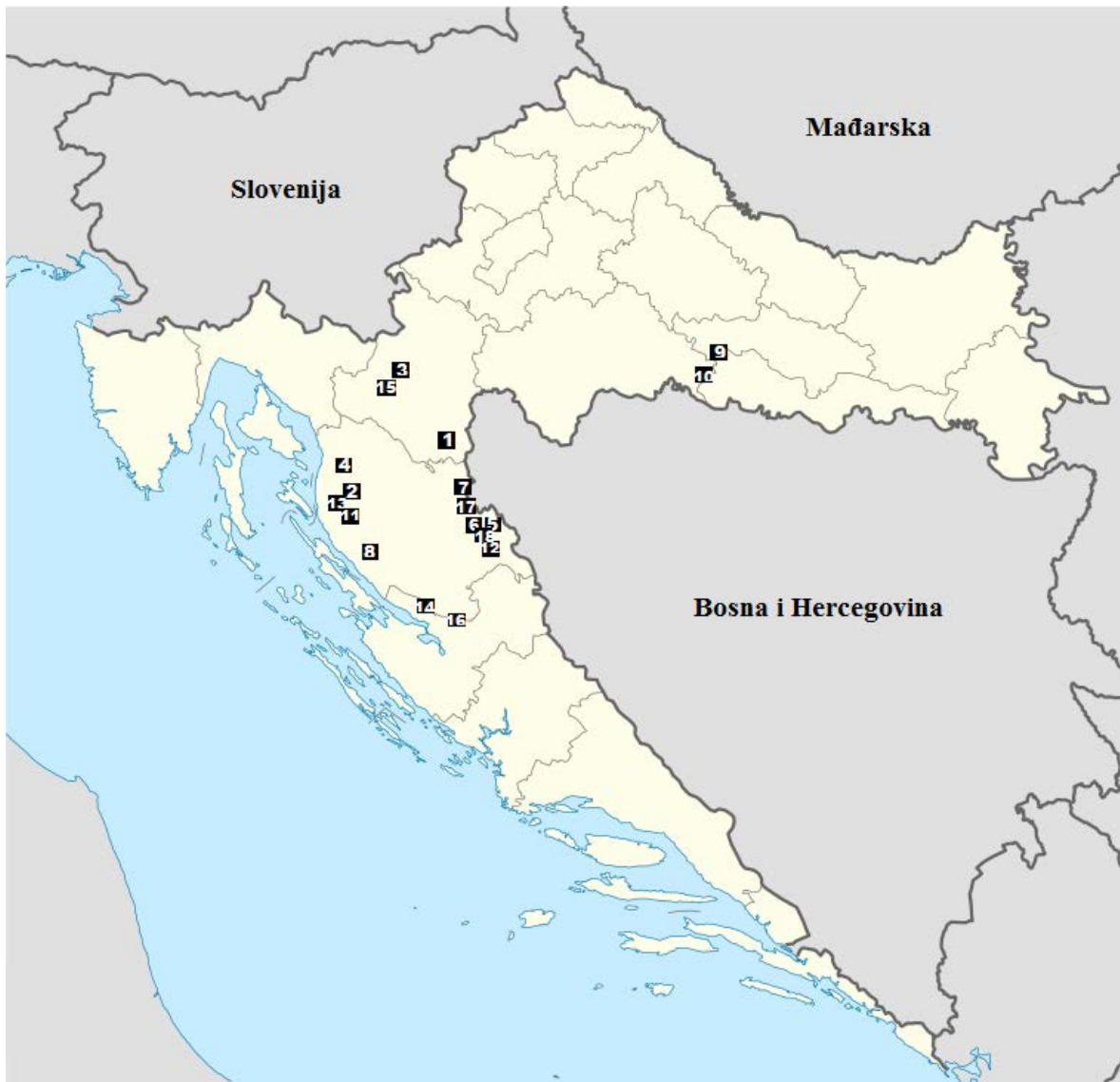
Slika 4. Prostorni raspored prašuma u Republici Hrvatskoj. 1. Čorkova uvala, 2. Devčića tavani, 3. Javorov kal, 4. Nadžak-bilo, 5. Plješivička uvala, 6. Velika Plješivica - Drenovača, 7. Velika Plješivica - Javornik - Tisov vrh, 8. Ramino korito, 9. Muški bunar, 10. Prašnik, 11. Klepina duliba - Štirovača, 12. Medveđak, 13. Hajdučki i Rožanski kukovi, 14. Suva draga - Klimenta Oglavinovac - Javornik, 15. Biješe i Samarske stijene, 16. Gaćešin varićak, 17. Kriva Lisina, 18. Debeli vrh