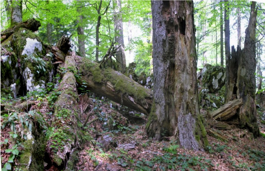
Slika 5. Faza raspadanja u prašumi Čorkova uvala u Nacionalnom parku Plitvička jezera

Prpić je u svojim radovima utvrdio prijelaz prašume iz kasne optimalne faze u fazu starenja (Tikvić i sur., 2018). Prevladava optimalna faza, a na manjim se površinama pojavljuje faza raspadanja i faza pomlađivanja. U omjeru je smjese utvrđeno smanjenje udjela obične jele, a povećanje udjela obične bukve. Također je utvrđena raznodobna struktura sloja drveća s pomlatkom jele ispod stabala bukve i pomlatkom bukve ispod stabala jele. Ta činjenica dokazuje da se bukovo-jelovim šumama pravilno gospodari prebornim načinom gospodarenja, odnosno da se oponašaju prirodni procesi u prašumama.