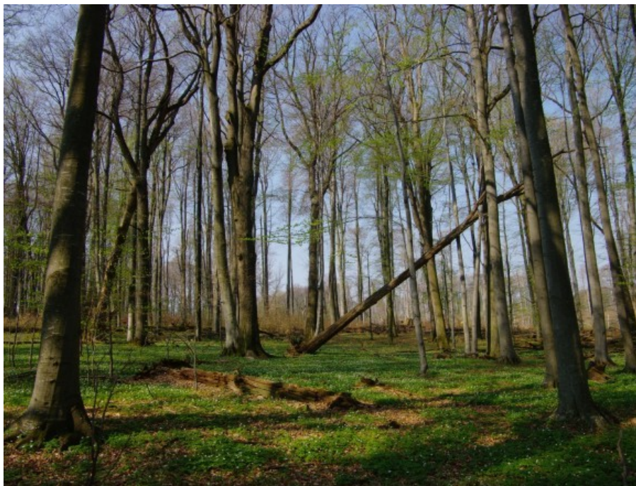
Slika 6. Bukovo - kitnjakova prašuma Muški bunar na Psunju

obilan, kao i dobrim strukturnim odnosima sastojima. Dinamična ravnoteža održava ekosustav stabilnim, a budućnost takvog ekosustava se može osigurati trajnom aktivnom zaštitom prostora.