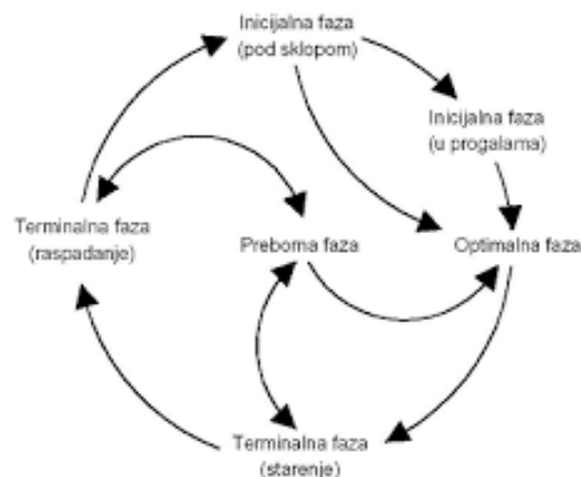
Slika 3. Shematski prikaz razvojnih faza prašume prema Aniću