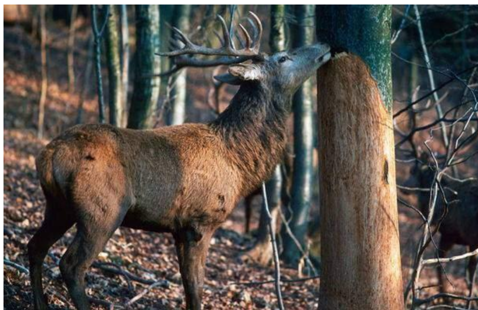
Slika 3. Guljenje kore

Jelen glođe i skida koru na žilištu i mladim stablima. Najčešće guli jasenova, hrastova i smrekova stabla starosti 15 -20 godina. Osobito su ugrožena stabla sočne kore (Glavaš, 2012). Za vrijeme ljetnog guljenja jelen pregriza koru u donjem dijelu stabla i guli je u trakama do dva, ponekad i više metara iznad tla. Takva stabla, zbog otvorenih rana, podložna su napadu drugih štetnika kao što su gljive truležnice i razni insekti, što na kraju rezultira opadanjem prirasta i smanjenom kvalitetom drvne mase.