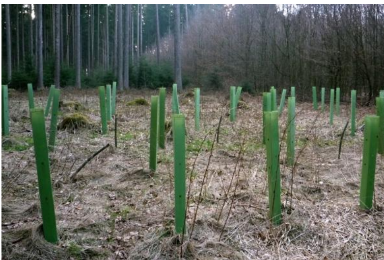
Slika 12. Polietilenski štitnici

Ovakva vrsta zaštite isplativa je samo na malim površinama kada je potrebno zaštititi određeni broj biljaka. Mlada stabalca su ugrožena od strane agresivnih i brzorastućih konkurenata, zatim srneče i jelenske divljači koja se hrani mladim lišćem i pupovima, ali i unišavaju koru svojim rogovima. Pokazalo se djelotvornim i omatanje pojedinih stabala – do 0,5 m od zemlje - trakom od papira ili od drugog sličnog materijala (Vajda, 1983). Danas su u upotrebi najčešće plastične cijevi u čijoj se šupljini nalazi biljka oko koje se stvaraju uvjeti staklenika. Osim plastičnih cijevi koriste se i žičane mreže koje se postavljaju oko biljke. Ovakav način zaštite biljaka je idealan u borbi protiv zečeva koji vrlo rado zalaze u mlade sastojine i prave štete odgrizajući mlade izbojke, pupove i gule koru.