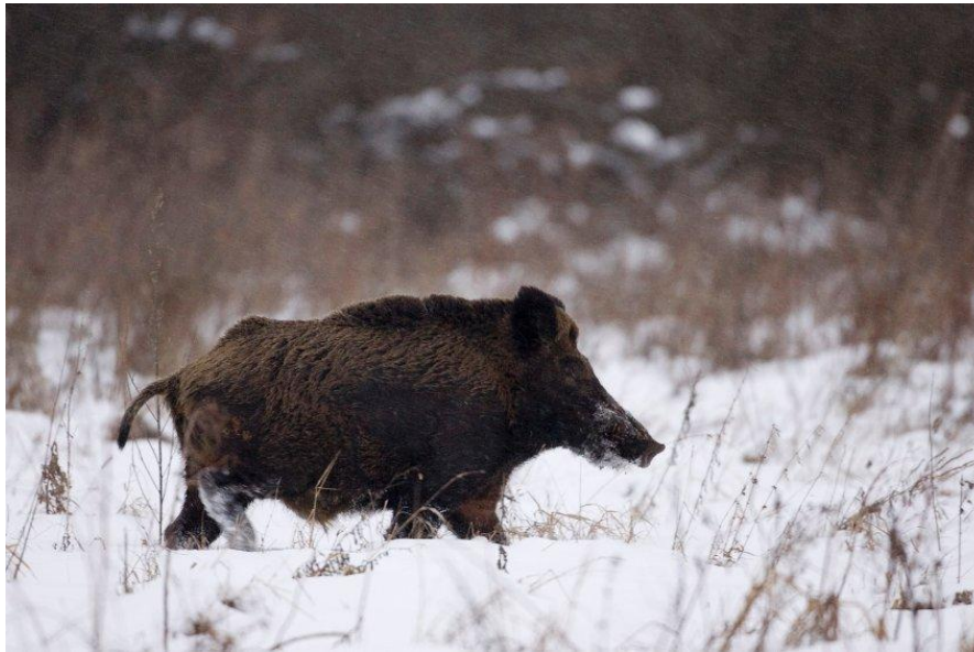
Slika 6. Divlja svinja

Svinja divlja spada u XVII red, dvopapkari ili parnoprstaši ( Artiodactyla ), i podred ne preživači ( Nonruminata ), porodica svinje ( Suidae ), rod svinja ( Sus ), vrsta svinja divlja ( Sus scrofa L.). Odrasla svinja divlja dostiže visinu do 90 cm u grebenu, a ukupna dužina tijela može dostići i do 160 cm. Rep može biti dug do 10 cm, kod nekih jedinki i do 40 cm. Težina odrasle divlje svinje ovisi o spolu iako uglavnom mužijaci i ženke imaju sličnu težinu, i kreću se u vrlo širokom rasponu od 120 do 250 kg. Boja dlake divlje svinje je raznolika, od tamno-mrke do sive, više ili manje srebrnaste do tamno žute boje. Tamnija boja dlake je u populaciji divljih svinja zastupljenija. Ljeti su dlake nešto svjetlije i kraće, dlaka je ispunjena, zimsku dlaku mijenja ljetnom krajem travnja i početkom svibnja, ovisi o klimatološkim uvjetima tokom proljetnih dana. U listopadu divlje svinje mijenjaju ljetnu dlaku zimskom, koja je gusta i šuplja, u donjim slojevima je gusta, vunasta dlaka, tako da bolje zadržava toplinu tijekom zimskih mjeseci.