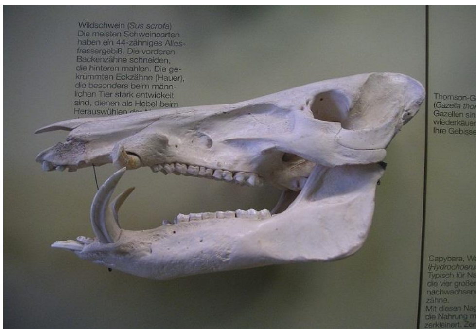
Slika 7. Lubanja divlje svinje

Četiri očnjaka privlače veliku pažnju. Dva donja očnjaka zovemo sjekačima, a dva gornja brusačima i oni predstavljaju trofej veptra. Očnjaci se pojavljuju odmah po rođenju, brzo rastu i razvijaju se te počinju povijati prema nazad. Od tog trenutka pri svakom pokretu donje vilice, zadnja površina sjekača trlja se o prednju površinu brusaća i na taj način se sjekači oštře (bruse).