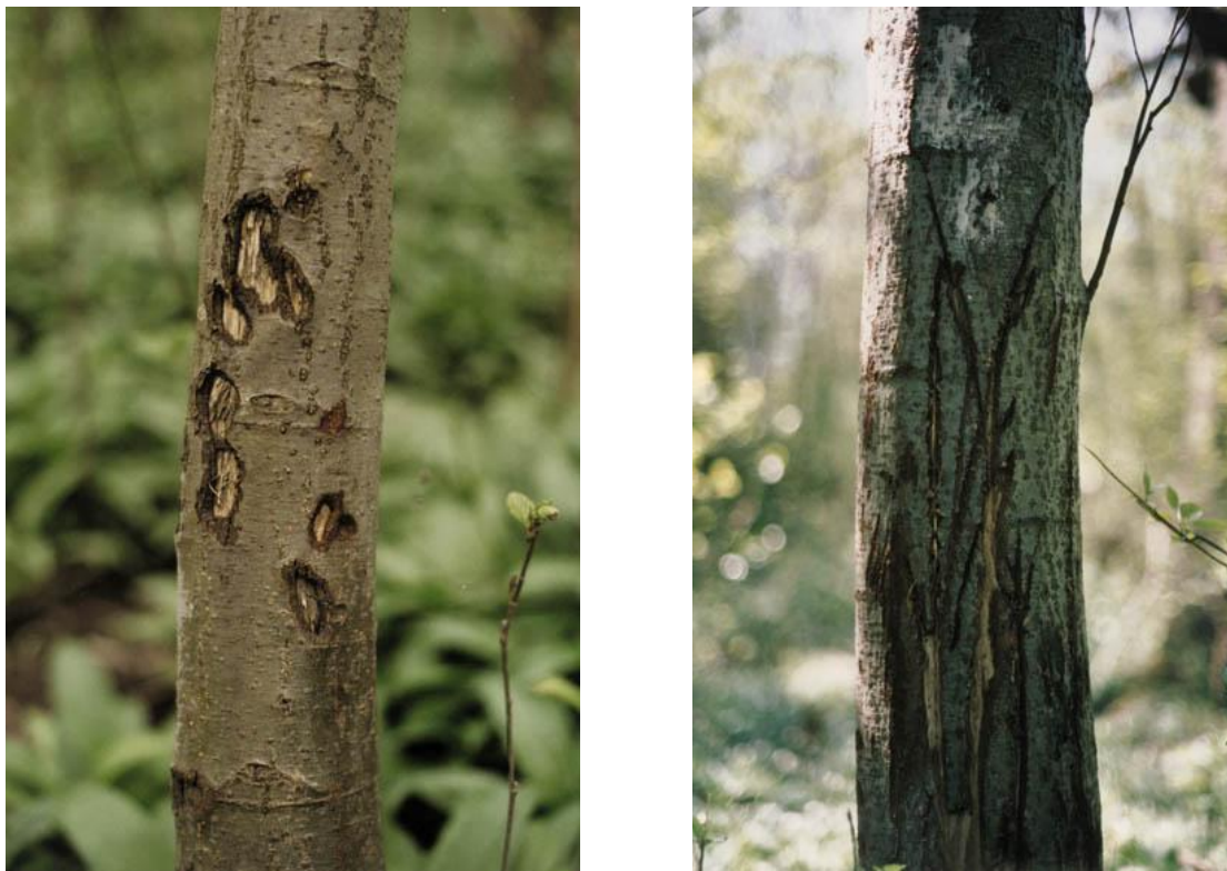
Slika 8. i 9. Rane na kori od kljova vepra

proizlaze poglavito iz rovanja, valjanja i gaženja, a manje od stvarnog hranjenja (Janicki i sur., 2007). Veprovi svojim kljovama mogu stvoriti rane na stablima koje su idealno mjesto za razvoj štetnih gljiva, a posljedica toga je fiziološko slabljenje stabla ili u najgorem slučaju njihovo odumiranje. Svinje također mogu oštetiti ograde za zaštitu od divljači, tako da srne i jeleni mogu ući u kulture i napraviti štete (Böhm, 2004). Opseg štete ovisi o gustoći populacije divlje svinje i količini dostupne hrane na određenoj površini. Jedna od koristi divlje svinje je ta što često jede i ostatke strvina tako da predstavlja sanitarca svog okoliša.