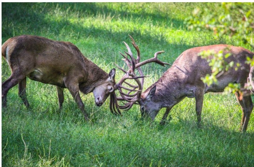
Slika 2. Borba jelena

Košuta spolno dozrijeva u drugoj godini života, kao i mužjak. Od životnih uvjeta ovisi da li će se dozrijevanje pomaknuti u treću godinu života. U vrijeme parenja jelen se oglašava dubokim, prodornim, grlenim glasom. Na početak rike utječe fizička kondicija, brojnost divljači, i omjer spolova. Za vrijeme rike često dolazi do borbe između jelena za prevlast nad haremom košuta. Najoptimalnije je kad jelen ima „harem“ 6-8 košuta. Za vrijeme parenja jeleni izgube na tjelesnoj težini 30-40 kg, katkad i više.