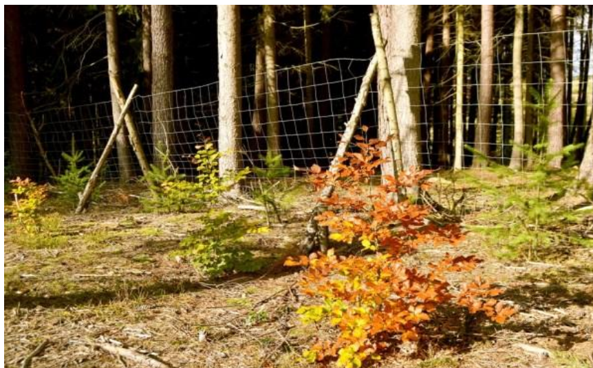
Slika 10. Žičana ograda

Zaštitne ograde imaju ulogu da sprječavaju ulazak divljači na pomladnu površinu. Takve ograde moraju biti napravljene od izdrživog materijala i visine oko 2,5 m tako da ju divljač ne može preskočiti. Danas su u upotrebi najčešće ograde od žičane mreže, a vrlo rijetko se mogu pronaći ograde od mreže prirodnih materijala te ograde od plastične mreže.