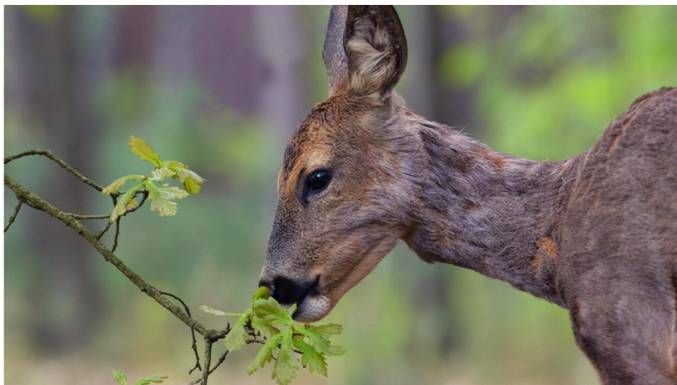
Slika 5. Brštenje lista

Osobito odgrizaju hrast, jasen, brijest, vrbu i jelu, a manje bor i smreku (Glavaš, 2012). Još jedan štetni utjecaj je češanje rogova srnjaka najčešće o mlada jasenova stabla, ali i o mnoge druge bjelogorične i crnogorične vrste, pa sve do različitih vrsta voćkarica. To se događa osobito onda kada se progaljene sastojine popunjuju šibama i mladim stabalcima (Vajda 1983). Za čišćenje svojih rogova srndač vrlo rado bira mlada stabla ariša osobito ona koja su osamljena ili u sastojini rastu u skupinama. Smrekova stabla poprimaju tzv. oblik čungar iz razloga što srneća divljač odgriza vršne izbojke pa krošnja u donjem dijelu stabla poprima grmoliki oblik iz kojeg izbija središnji izbojak koji više nije u dohvat divljači. Srneća divljač čini manje štete u odnosu na jelena zbog manje potrebe za hranom.