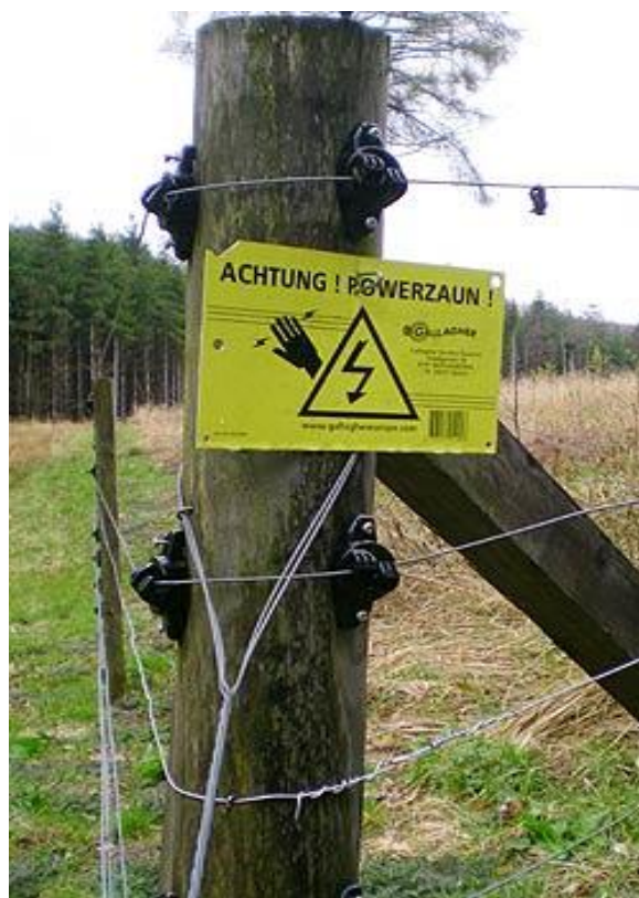
Slika 11. Električna ograda

U šumama se najčešće koriste ograde od žičane mreže. Vrlo često se mogu vidjeti armaturne mreže koje su s jedne strane jednostavne za korištenje i postavljanje, a s druge strane može doći do ozljeđivanja divljači u koliko ipak dođe do preskakivanja. Iz tog razloga preporuča se postavljanje tri reda trake iznad najgornje žice. Mreže moraju biti dobro ukopane u zemlju kako se divljač, pretežito svinje, ne mogu provući ispod njih. Postoje električne ograde koje sprječavaju ulazak divljači u ogradaenu površinu tako što životinja koja dodirne ogradu doživi neugodni strujni udar, te neko vrijeme izbjegava ogradu. Taj električni udar nema nikakvih zdravstvenih posljedica na životinju. Za zaštitu od srneće i jelenske divljači preporuča se ograda visine do 140 - 150 cm, s pet ili šest vodiča (reda žice), razmak između stupova 3-4m, a za zaštitu od divljih svinja visina 55-75 cm s tri vodiča (reda žica), razmak između stupova 3-4m.