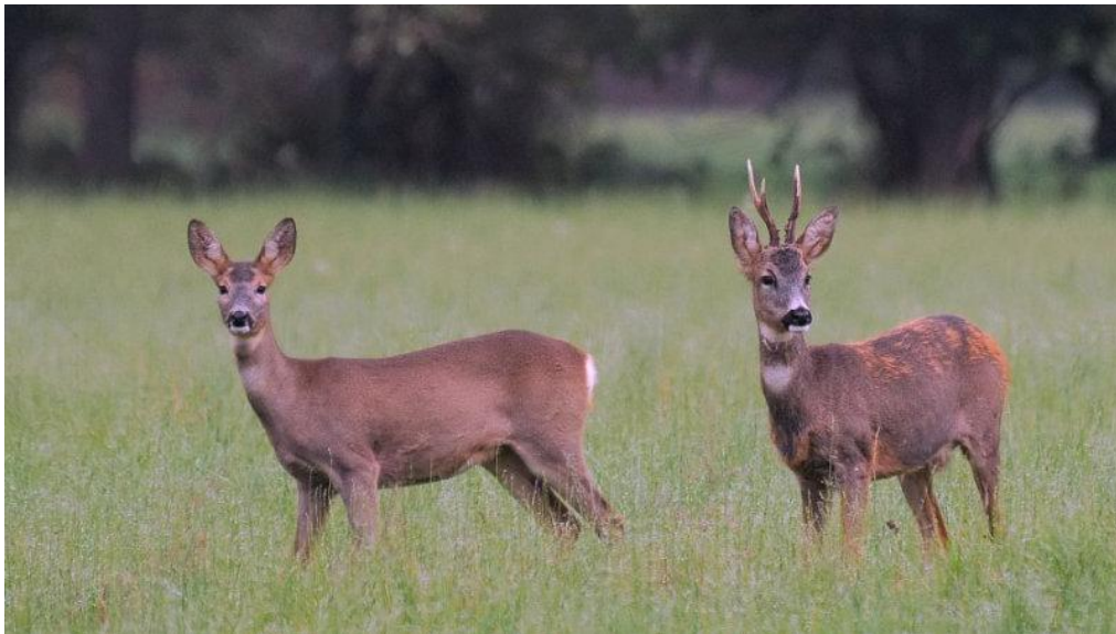
Slika 4. Srna i srnjak

Mužjak, srnjak, ima dostojanstven stav tijela, visoko uzdignute glave s ispupčenim čelom i kratkom gubicom. Srna ima nešto „lakšu“ glavu. Težina smeće divljači ovisi o uvjetima staništa, starosti i spolu, a kreće se od 15 do 35kg. Srna ima ljeti crvenkastu do riđo-crvenu dlaku. Zimska dlaka je mnogo gušća, šuplja, boja sivo do tamno sive, oko analnog otvora mužjak i ženka imaju mrlju bijele dlake koja je kod srnjaka okruglog a kod srne srcolikog izgleda, koju nazivamo još „ogledalo“. Srna i srnjak mijenjaju dlaku dva puta godišnje, ljetna promjena dlake je sporija dok je izmjena zimske dlake puno brža.