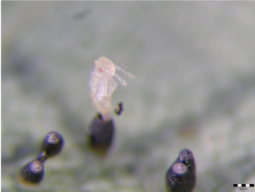
Slika 12. Izlazak ličinke iz jaja