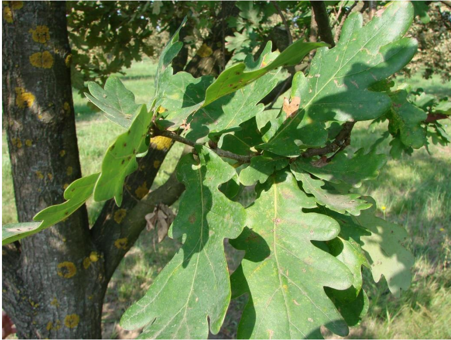
Slika 6. Oštećenja na listu

Na klonskoj sjemenskoj plantaži „Petkovac“ u svibnju 2018. godine prikupljeni su uzorci blijedog, klorotičnog lišća s grupicama crnih jajašaca za laboratorijsko praćenje i analizu. Uzorci su spremljeni u plastične petrijeve posudice s poklopcem.