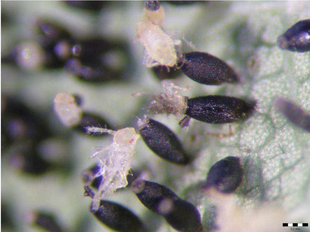
Slika 11. Izlazak ličinki iz jaja

Daljnjom analizom prikupljenih uzoraka vidljiv je prvi stadij ličinki koje izlaze iz jaja (Slika 11. i 12.). Drugom laboratorijskom analizom nije utvrđena prisutnost parazitoida na odloženim jajima. Na uzorcima su također vidljivi i miceliji gljiva (Slika 13.).