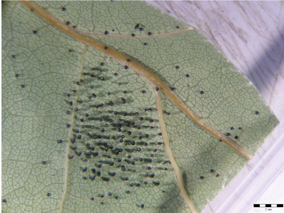
Slika 7. Jaja hrastove mrežaste stjenice ( C. arcuata ) odložena na donjoj strani lista