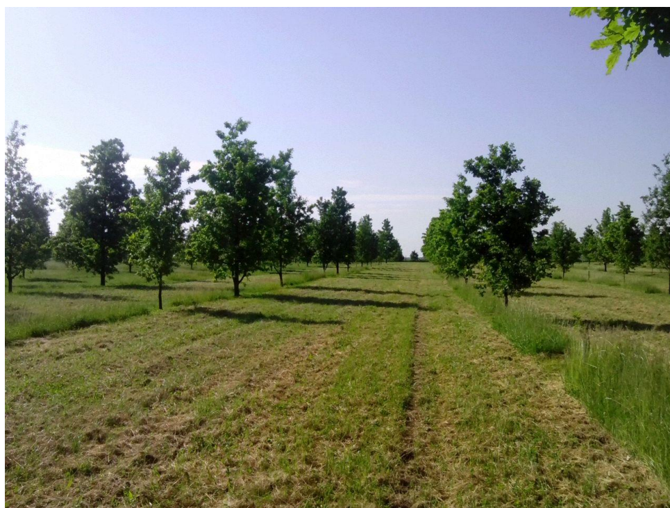
Slika 5. Klonska sjemenska plantaža „Petkovac“

Klonska sjemenska plantaža „Petkovac“ (Slika 5.) osnovana je 2000. godine na površini od 25 ha u šumariji Otok, Uprave šuma Vinkovci. Plantaža je osnovana zbog proizvodnje kvalitetnog hrastovog sjemena u kratkim vremenskim razmacima. Na ovoj plantaži prije sadnje obavljani su pripremni radovi, jer je plantaža osnovana na nekadašnjoj poljoprivrednoj površini. Sadnja se obavlja po shemi koju je postavio Zavod za šumarsku genetiku, dendrologiju i botaniku Šumarskog fakulteta Sveučilišta u Zagrebu. U 2000. godini posađeno je 699 rameta, a u ožujku 2009. godine na plantaži se nalazilo 2 390 rameta. Konačan broj rameta ove plantaže trebao bi iznositi 3 142. Radovi njege i zaštita klonova od različitih biotskih i abiotskih čimbenika provode se svake godine. Razvoj stabala unutar plantaže lako se prati jer su sva stabla obrojčana.