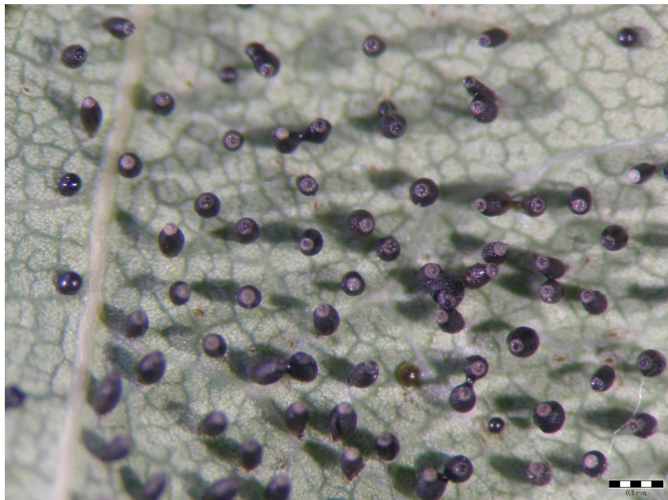
Slika 8. Jaja hrastove mrežaste stjenice ( C. arcuata )