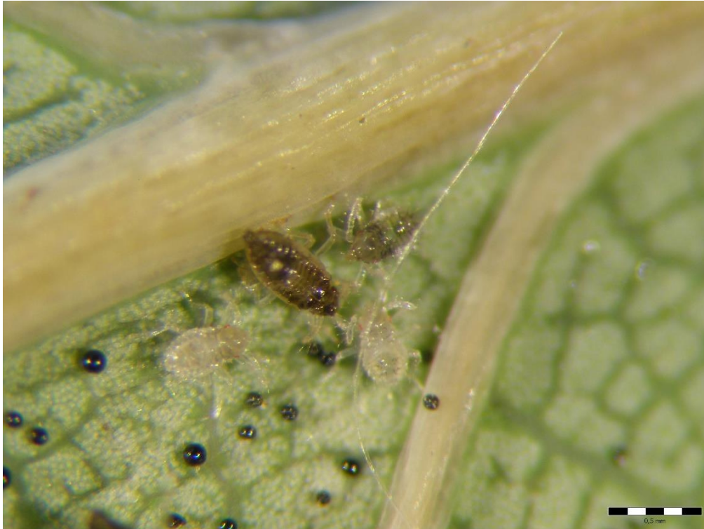
Slika 17. Ličinke prvog i drugog stadija

Posljednjom analizom uzoraka ustanovljeno je kako je većina ličinki uginula, a samo manji broj uspio se razviti do trećeg stadija ličinke (Slika 17. i 18.). Također, krajnjom analizom može se potvrditi da ne postoje parazitirana jaja hrastove mrežaste stjenice.