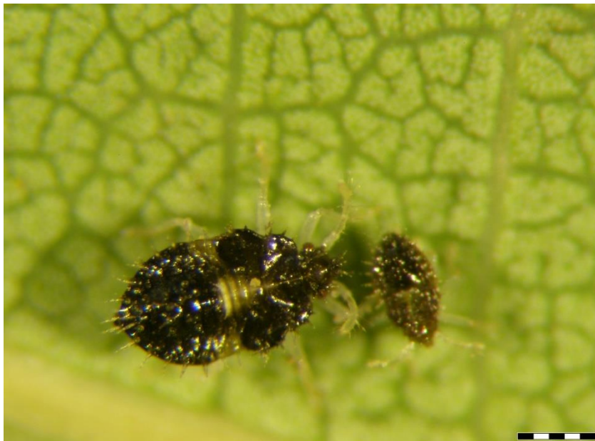
Slika 18. Ličinke drugog i trećeg stadija