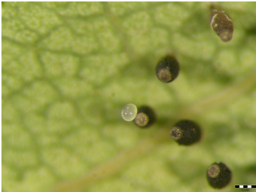
Slika 10. Moguće prisustvo parazitoida na jajima hrastove mrežaste stjenice ( C. arcuata )