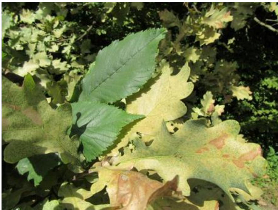
Slika 2. Klorotične promjene na listu