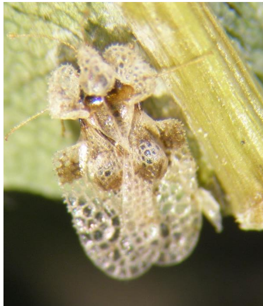
Slika 3. Imago platanine mrežaste stjenice (lijevo),