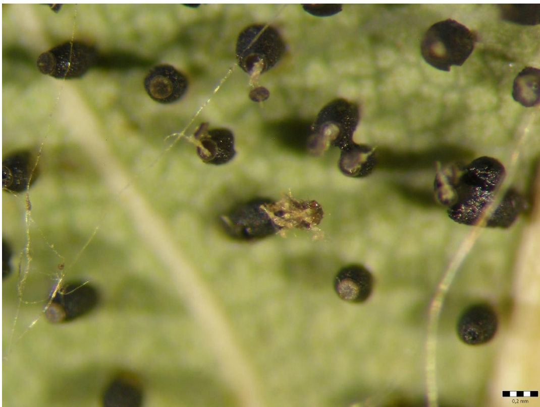
Slika 14. Ugibanje ličinki uslijed neodgovarajućih uvjeta za daljnji razvoj

Zbog neodgovarajućih uvjeta za daljnji razvoj ličinke su počele ugibati (Slika 14 i 15.). Na analiziranim uzorcima zamijećene su grinje ( Phytoseiulus spp. ) (Slika 16.). Phytoseiulus persimilis jedna je od značajnijih predatorskih grinja koja pozitivno utječe na suzbijanje štetnika, osobito u poljoprivrednim kulturama. Predatori su odrasle grinje i razvojni stadij nimfe. Ovaj se predator u povoljnim uvjetima (75% relativne vlažnosti zraka i 20-30° C) razmnožava se vrlo brzo.