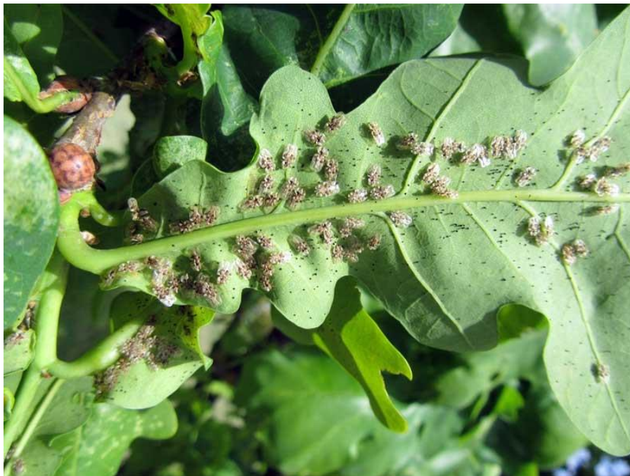
Slika 1. Hrastova mrežasta stjenica ( C. arcuata ) na listu hrasta lužnjaka ( Q. robur )

Zadnjih nekoliko godina u Europi značajno se povećao broj unešenih stranih i invazivnih vrsta. Istraživanjem je na području istočne Slavonije potvrđena prisutnost nove invazivne vrste mrežaste stjenice, hrastova mrežasta stjenica ( Corythucha arcuata ) (Slika 1.). U Hrvatskoj je do 2013. godine iz roda sjevernoameričkih mrežastih stjenica zabilježena samo platanina mrežasta stjenica ( Corythucha ciliata ). Hrastova mrežasta stjenica se vrlo brzo proširila te postala veliki štetnik uroda, prirasta i zdravstvenog stanja stabala hrasta lužnjaka ( Quercus robur ) u spačvanskim šumama.