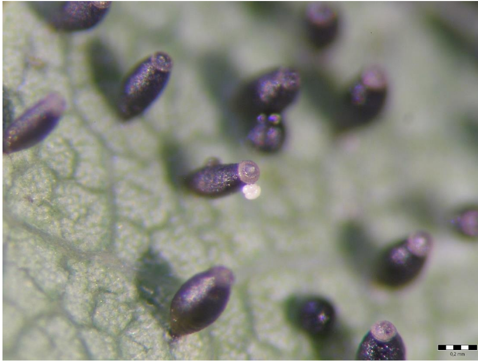
Slika 9. Moguće prisustvo parazitoida na jajima hrastove mrežaste stjenice ( C. arcuata )