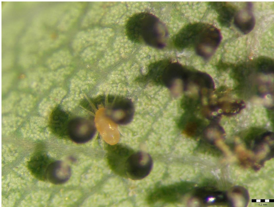
Slika 16. Grinja ( Phytoseiulus spp. )