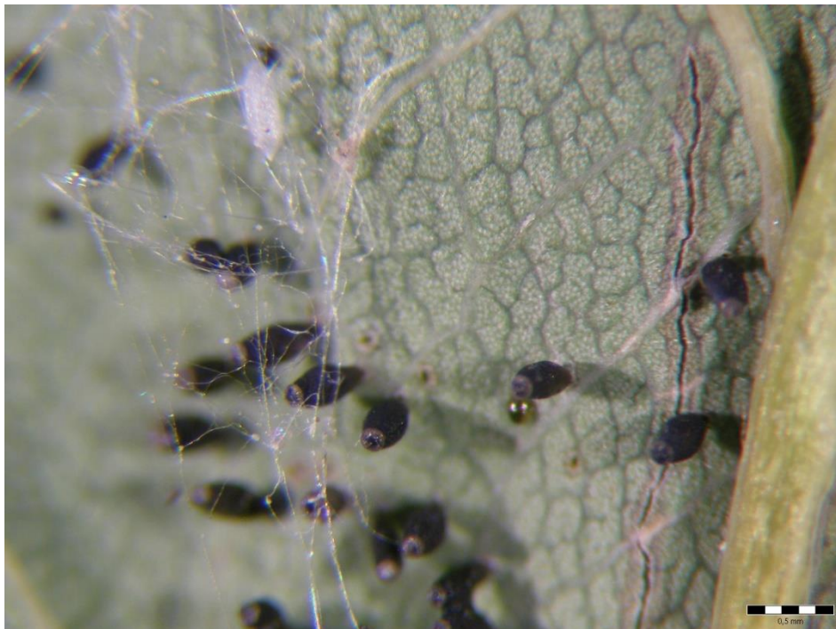
Slika 13. Miceliji gljiva