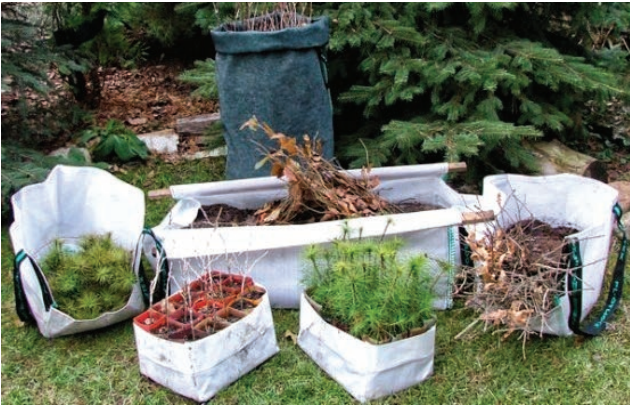
Slika 2. Različiti oblici kontejnera za transport sadnica kod pošumljavanja i umjetne obnove sastojina sadnjom sadnica.

Figure 2. Different forms of containers for transportation of seedlings for reforestation and artificial regeneration of stands by planting seedlings.