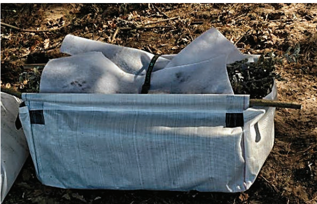
Slika 3. Kontejner za transport sadnica koji nose četiri osobe Figure 3. Container for seedling transport carried by four persons

terson i dr. 2001). Nakon vađenja kvaliteta sadnica se ne može povećati već se ponekad smanjuje. Prema Adams i Paterson (2004), nepravilno rukovanje sadnicama važnije je od alata s kojim se sadi na terenu. Kvaliteta sadnica predstavlja lanac gdje svaka karika čini jedan segment u u rukovanju sadnicama od trenutka vađenja do sadnje na terenu. Značajniji je kumulativni učinak više stresnih čimbenika nego suma jednog stresora (McKay 1997). Šumska sadnica prolazi kroz različite stresne čimbenike, kronološki kako slijedi: vađenje (čuvanje) – rukovanje – transport-čuvanje na mjestu sadnje-sadnja. Ukupna kvaliteta sadnice se izražava kao kvaliteta najslabije karike u lancu. S povećanjem stresa biljka preusmjerava energiju za rast na saniranje ozljeda. Poljski jasen pripada u skupinu higrofilnih vrsta drveća pa je razumljivo kako je korijenski sustav nakon vađenja sklon brzom isušivanju korjenovih dlačica koje su od odlučujućeg značaja za preživljenje sadnica nakon presadnje. Zbog neodgovarajućeg postupanja šumskim sadnicama od trenutka vađenja u rasadniku do sadnje na terenu sadnice propadaju. Sadnice treba vaditi u rasadnicima po povoljnom vremenu što znači bez vjetera i jake sun-