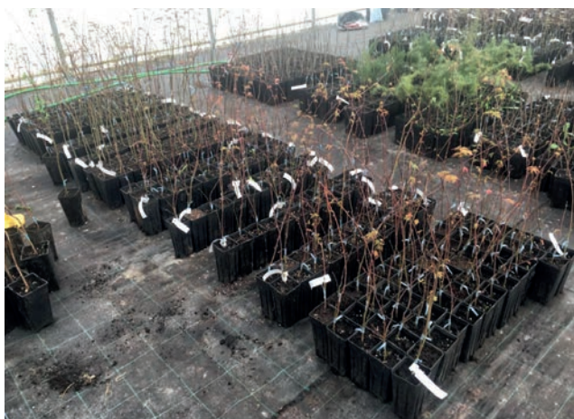
Slika 10. Sadnice japanskih ukrasnih javora snimljene nakon provedenog cijepljenja

Figure 10. Decorative Japanese maples seedlings photographed after grafting