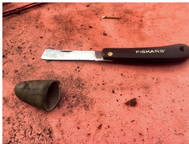
Slika 6. Nožić za tehniku bočnog cijepljenja naoštren samo s jedne strane

Figure 5. The necessarily labeling of each seedling with the correct latin cultivar name is done immediately after grafting