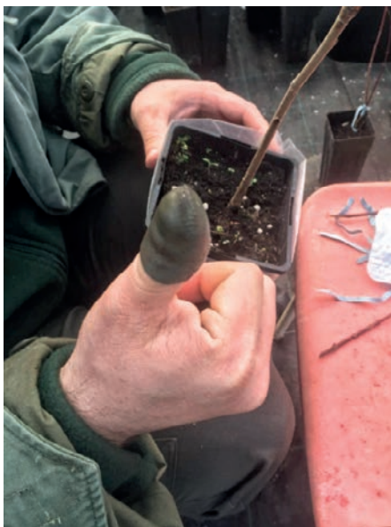
Slika 8. Stavljanje „napršnjaka“ kao zaštita palca od mogućih ozljeda oštrim nožićem

Figure 8. Put on of the “thimble” as protection of the thumb from possible injuries with a sharp knife