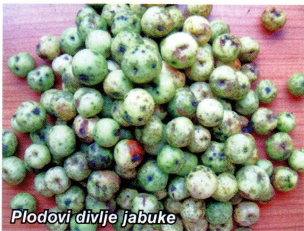
Plodovi divlje jabuke

Iz 100 kg plodova dobije se od 0,8 - 0,9 kg sjemena, dok 1 kg čistog sjemena sadrži od 10 000 do 45 000 ili u prosjeku 34 000. Prividni plod je kuglast ili jajast, prosječno promjera 2-2,5 (-4 cm), žutozelen, na sunčanoj strani često crvenkast te kiseloga okusa. Plodovi divlje jabuke sakupljaju se odmah nakon sazrijevanja zbog šteta od životinja. Divlja jabuka naginje prema alternirajućoj rodnosti.