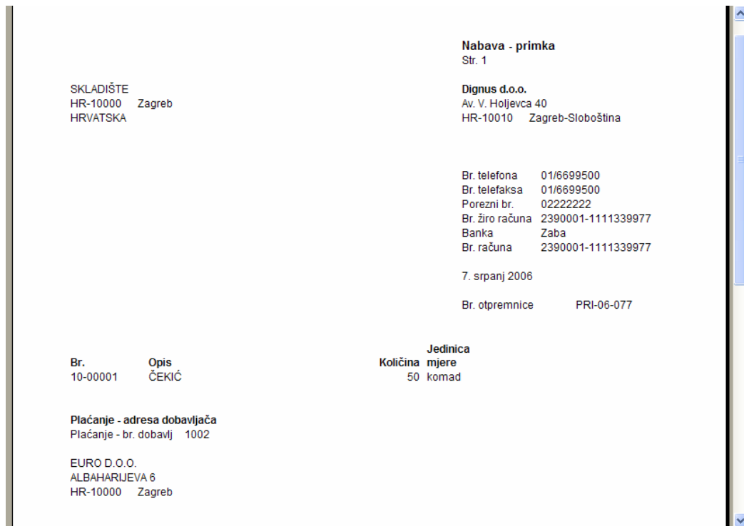
Slika 5. Primka izrađena (generirana) putem poslovnog (ERP) sustava Microsoft Dynamics Navision 4.0