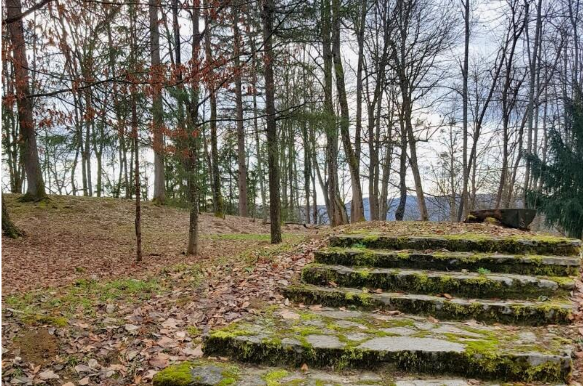
Slika 6. Park šuma „Brdo Djed“

Cilj i način gospodarenja Park šumom „Brdom Djed“ propisan je u Programu gospodarenja koji je sastavni dio ove Osnove.