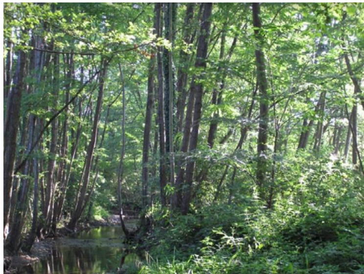
Slika 3. Zajednica crne johe s trušiljkom uz potoke

U sloju prizemnog rašća najčešće su vrstepaskvica obična ( Solanum dulcamara ), bodljikava paprat ( Nephrodium spinulosum ), divlji hmelj ( Humulus lupulus ), vučja noga ( Lycopus exaltatus ) i dr.