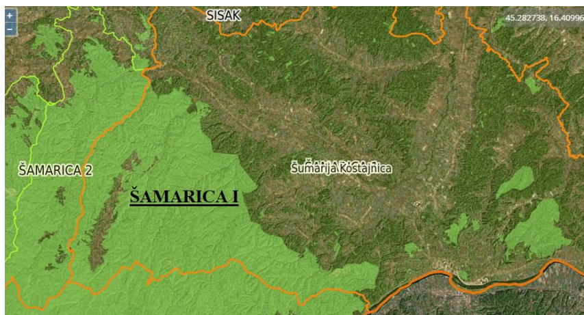
Slika 2. Granice Gospodarske jedinice Šamarica I

Cijeli kompleks spada u brežuljkasti vegetacijski pojas. Teren je izbrazdan grebenima i jarcima. Najniža je točka na rijeci Uni kod sela Rosulje (110 m n. v.), a najviša Rajković vis u odsjeku 21b (581 m n. v.). Područje je bogato izvorima, te većim i manjim potocima.