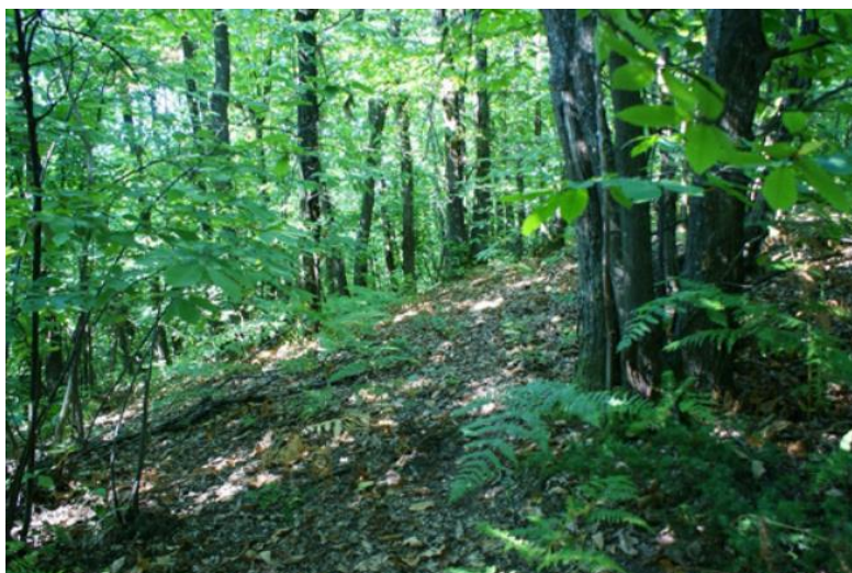
Slika 4. Šuma hrasta kitnjaka i pitomog kestena