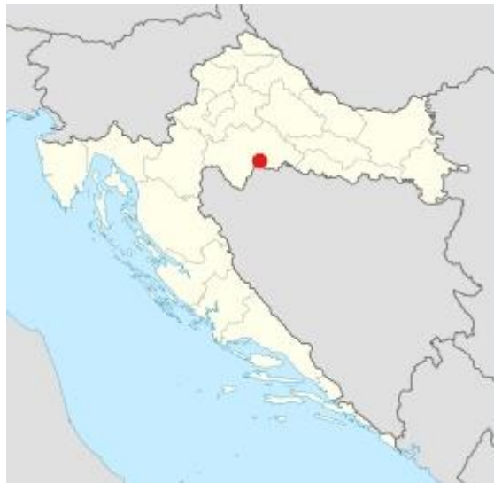
Slika 1. Karta Hrvatske s geografskim položajem Hrvatske Kostajnice

Istraživanje je obavljeno na području Hrvatske Kostajnice. Hrvatska Kostajnica je grad na Banovini (Sisačko-moslavačka županija). Smješten je u središnjem djelu hrvatskog Pounja, podno Zrinske gore. Grad je nastao na otočiću usred rijeke Une, a glavina naselja pruža se uz lijevu obalu rijeke. Ime potječe od riječi "kostanj", što je jedna od starijih varijanti hrvatske riječi "kesten".