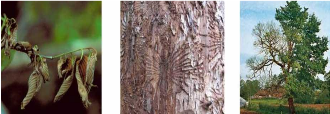
Slika 5. Štetni učinak patogena Ophiostoma novo-ulmi . Izvor: http://nem-trees.com/ .

O. novo-ulmi 20-22 °C. Vrstu O. ulmi karakterizira glatka, voštana konzistencija micelija, a dnevne zone rasta su slabo vidljive, dok izolati vrste O. novo-ulmu razvijaju zračni micelij te imaju dobro uočljive dnevne zone rasta (Brasier 1981, 1991).