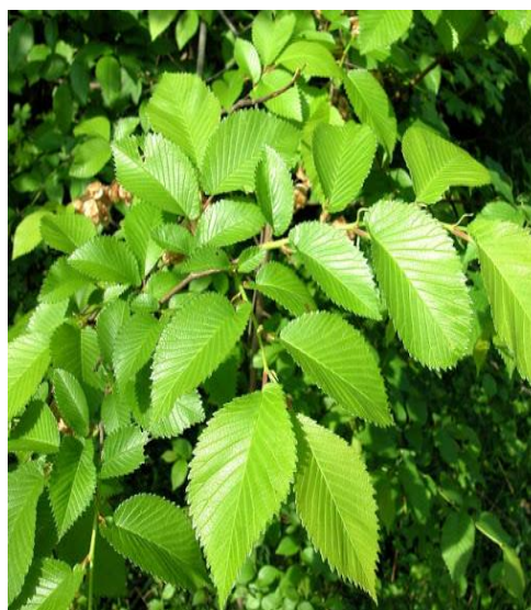
Slika 2. Izgled lista.