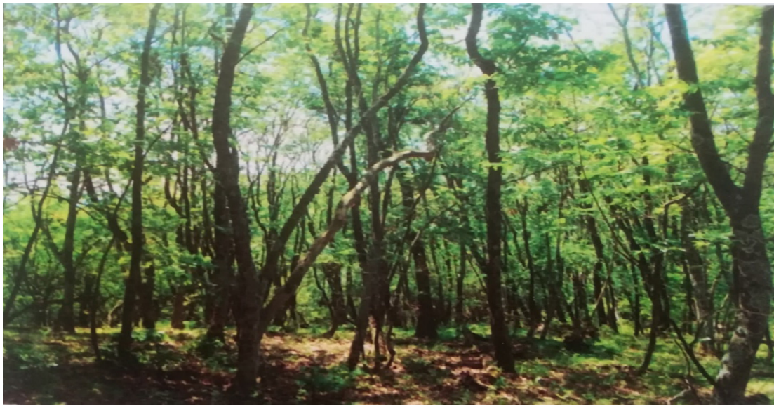
Slika 6 Sastojina sladuna.

Baričević i dr. (2015) u okolini Kutjeva. Na slavonskom gorju je rasprostranjen na južnim padinama Krndije. Dolazi na južnim ekspozicijama i nadmorskim visinama do 400 m. Raste na podlozi koju čine prapor i praporasti sedimenti na kojima je razvijeno ilimerizirano tipično i pseudoglejno tlo. Florni sastav čine hrast sladun, uz manji udio hrasta cera i kitnjaka. Sloj grmlja je dobro razvijen, a u njega pridolaze Pyrus pyraister , Chamaecytisus supinus , Genista tinctoria , Carpinus betulus , Acer campestre , Fraxinus ornus , Ligustrum vulgare i dr. Od prizemnog rašća rastu Dactylis glomerata , Helleborus croaticus , Potentilla micrantha , Glechoma hirsuta , Carex flacca , Brachypodium sylvaticum i druge. Ova zajednica ima veliku prirodnoznanstvenu vrijednost. Zajednica se na padinama Krndije nalazi na zapadnoj granici svog areala, a inače pridolazi u Slavoniji i na par mjesta u Dalmaciji.