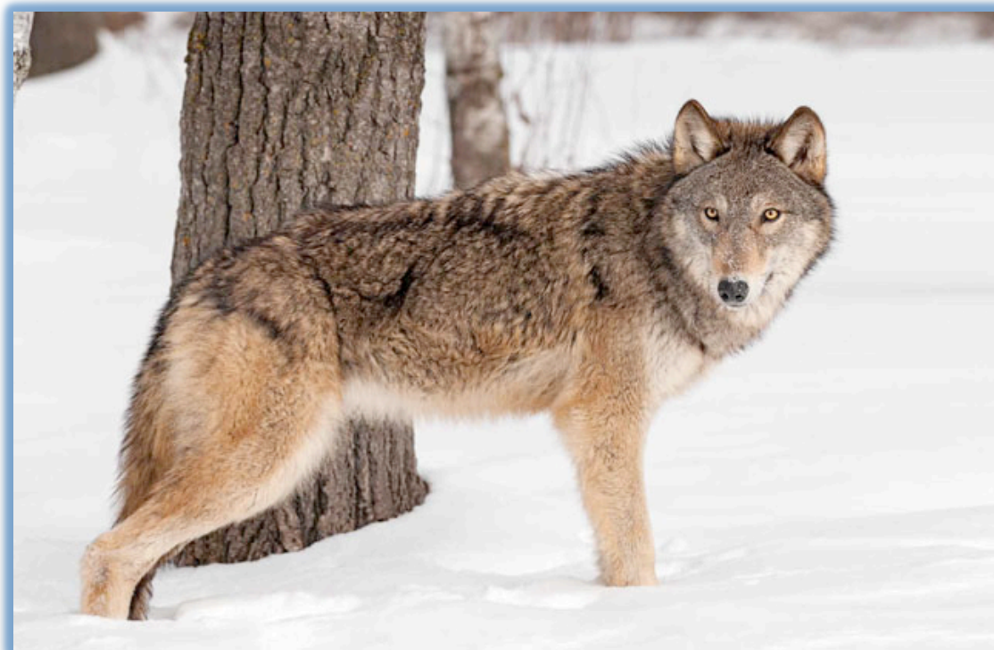
Slika 1. Vuk ( Canis lupus L.)