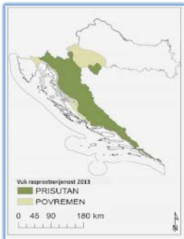
Slika 8. Rasprostranjenost vuka u Hrvatskoj u 2013. godini