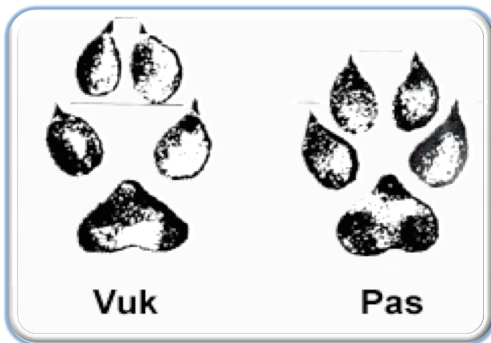
Slika 7. Prepoznatljivi otisak šape vuka i psa

prstiju. Kod pasa je oblik šape više okrugao, a nokti postraničnih prstiju dopiru do pola jagodica srednjih prstiju (Gulin, 2017). Stražnje noge vuka kreću se u istoj ravnini s prednjima, dok većina pasa stavlja stražnje noge unutar tragova prednjih. Znakovi na plijenu vuka su specifični. Vukovi plijen hvataju za vrat snažnim ugrizom i trzajima, otkidaju tkivo i vratne žile, te plijen brzo ugiba od iskrvarenja ili gušenja. Kod napada na veći plijen, vuk ga grize za stražnji dio (butovi) i tada ne mora biti ugriza na vratu. Ukoliko ih se ne uznemirava, svoj plijen pojedu u potpunosti, ostaje samo koža, kralježnica i krajnji dijelovi nogu. Također, prisutnost vukova se može odrediti na osnovu njihova zavijanja, boji i mirisu izmeta (potrebno više iskustva) te izmjerom lubanje na temelju orbitalnoga kuta (kut koji zatvaraju linija koja ide preko gornjeg i donjeg ruba očne šupljine te poprečna linija preko vrha lubanje). Kod vukova je taj orbitalni kut 40 do 45°, a kod pasa 53 do 60° (Kusak, 2004).