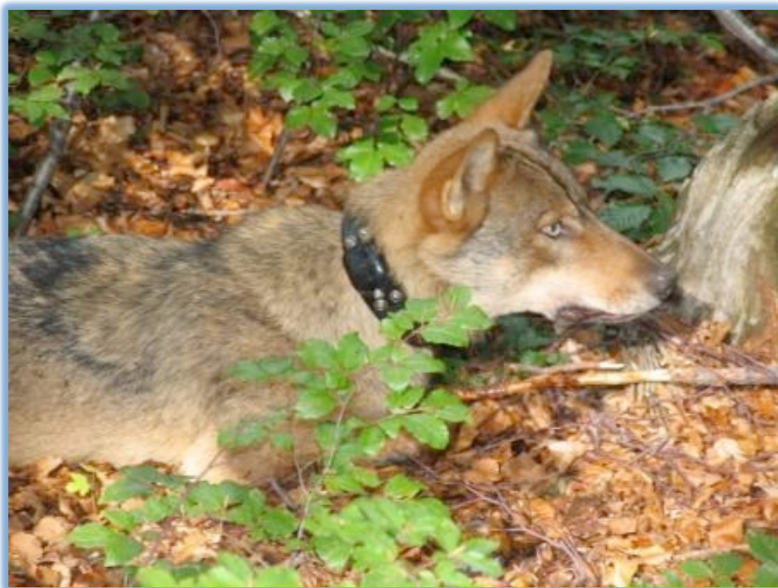
Slika 11. Stavljanje GPS ogrlice je početak telemetrijskog praćenja