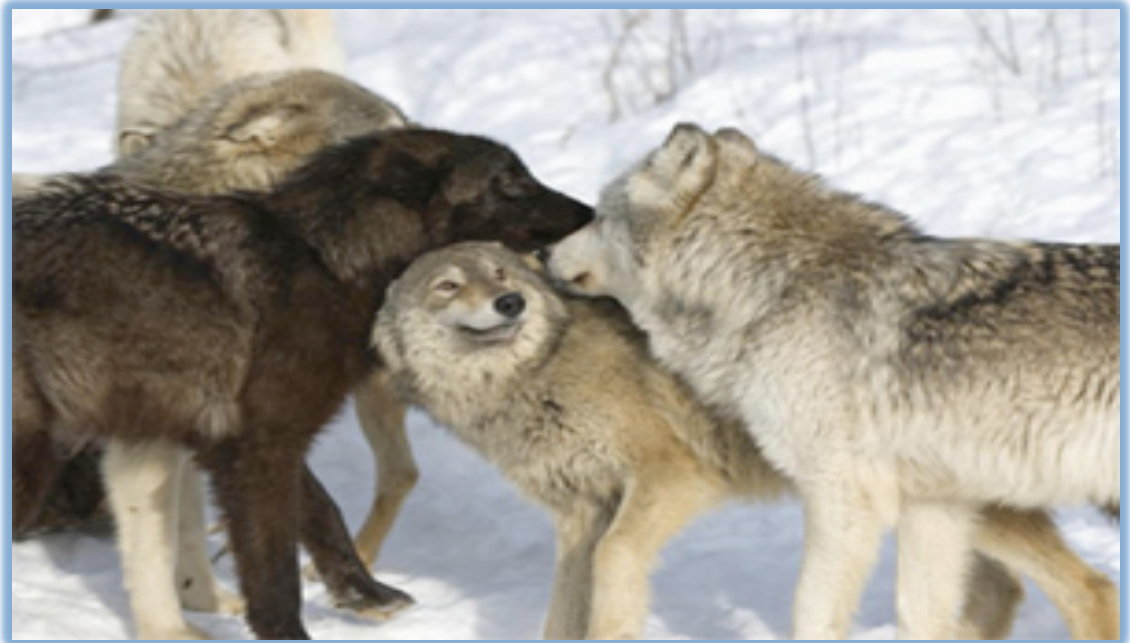
Slika 6. Hijerarhija (dominantnost/podložnost) u vučjem čoporu

slobodan od drugih vukova, te mladog vuka s kojim nisu u srodstvu, tada mogu zasnovati novi čopor (Poklar, 2013).