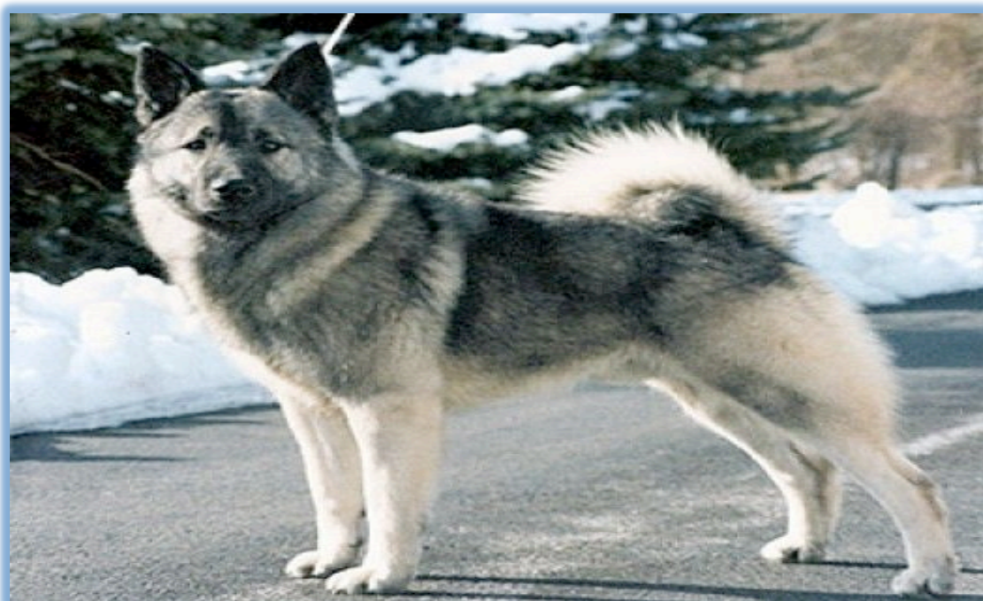
Slika 4. Domaći pas ( Canis lupus familiaris L.)