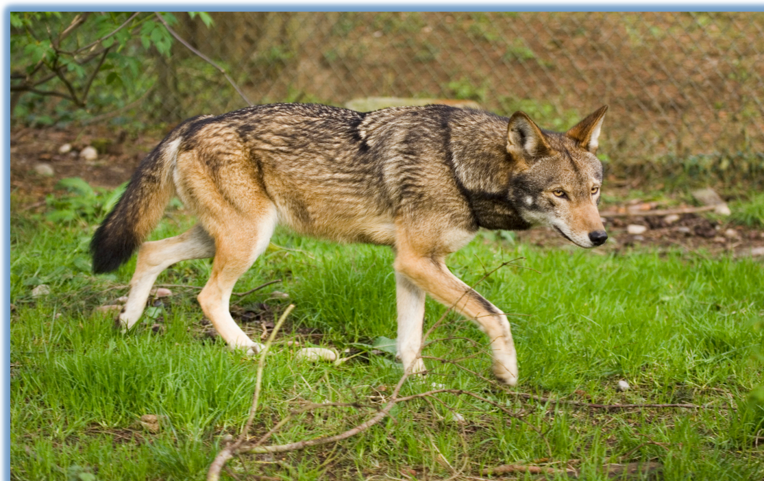
Slika 2. Crveni vuk ( Canis rufus Audubon & Bachman, 1851.)