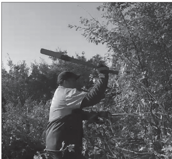
Slika 1. Rad s kosirom