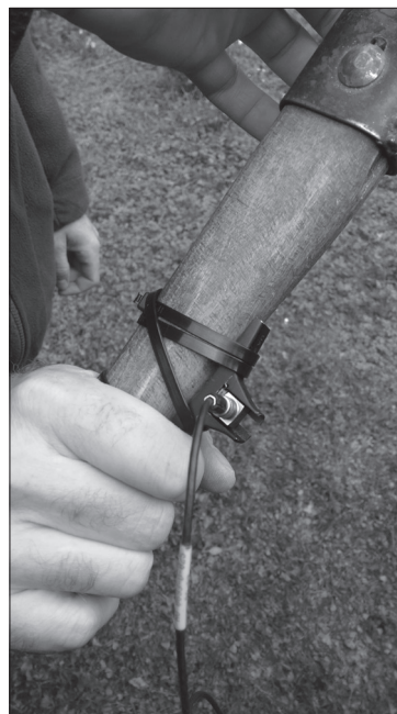
Slika 3. Montaža akcelerometra na kosir