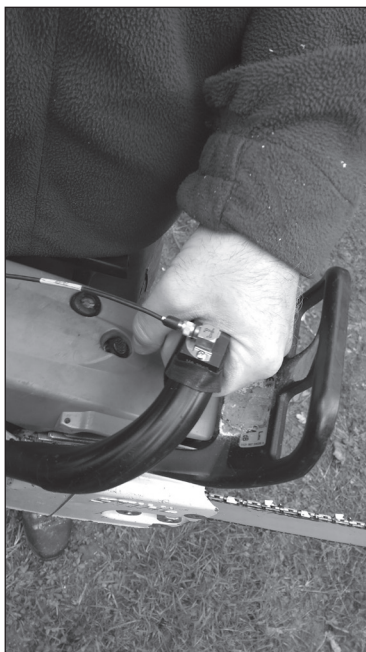
Slika 4. Montaža akcelerometra na motornu pilu Figure 4. Mounting an accelerometer on a chainsaw

Mjerenje je napravljeno u 3 navrata po 20 sekundi. Radni zahvati rezanja motornom pilom mjereni su pri konstantnom radu rezanja unutar 20 sekundi. Rezanje se provodilo naizmjenično s gornjom i donjom stranom vodilice da bi se izbjeglo snimanje razine vibracija u praznom hodu koje je obuhvaćeno u ostalim radnim zahvatima. Prilikom mjerenja akcelerometar je na ručke motorne pile bio montiran pomoću nosača UA 3017 (slika 4); (Bačić, 2019.).