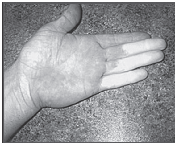
Slika 2. Raynaudov sindrom