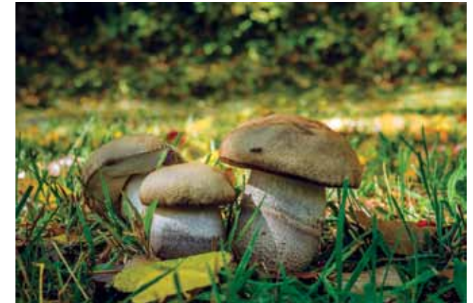
Ektomikoriza kod gljiva

Kao što je već rečeno, jedna od velikih poteškoća za bržu primjenu i širenje endomikorize u praksi je komercijalna proizvodnja inokuluma. Za očekivati je širenje proizvodnje komercijalnog inokuluma, odnosno, specijaliziranih cjepiva mikoriznih gljiva za pojedine biljne vrste.