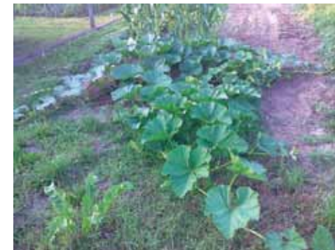
Bundeve u početku imaju intenzivan vegetativni rast

Pri sadnji na dno sadne jame stavljaju se živi endomikorizni miceliji koji se mogu nabaviti i na našem tržištu, a pomiješani su sa sitno mljevenim tresetom tako da se s njima lakše rukuje i stavljaju se na dno sadne, pa na taj način miceliji odmah dolaze u kontakt s korijenovim sustavom biljke.