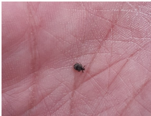
Slika 19. Imago jasenove pipe