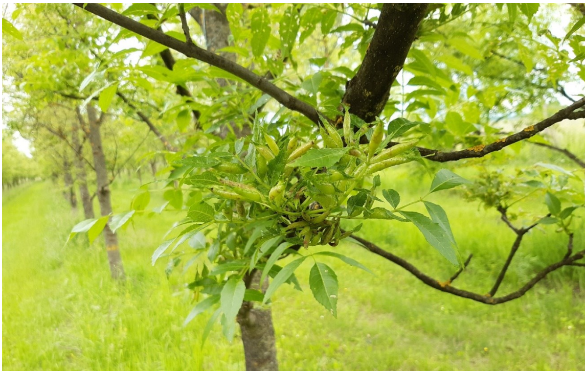
Slika 26. Šiške jasenove lisne muhe šiškarice