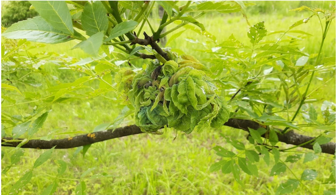
Slika 28. Kuglaste formacije jasenove lisne uši