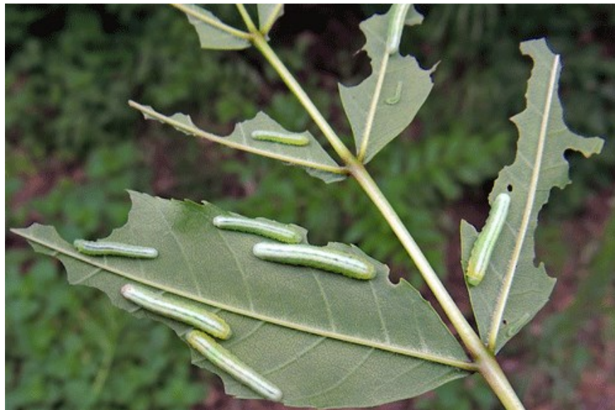
Slika 5. Hranjenje pagusjenica