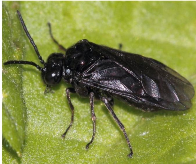
Slika 4. Imago crne jasenove ose listarice

2009) Ova vrsta pokazala se kao najznačajniji defolijator i štetnik parkova i drvoreda jasena u Gradu Zagrebu prema istraživanju iz 2004. (Matošević D., 2004)