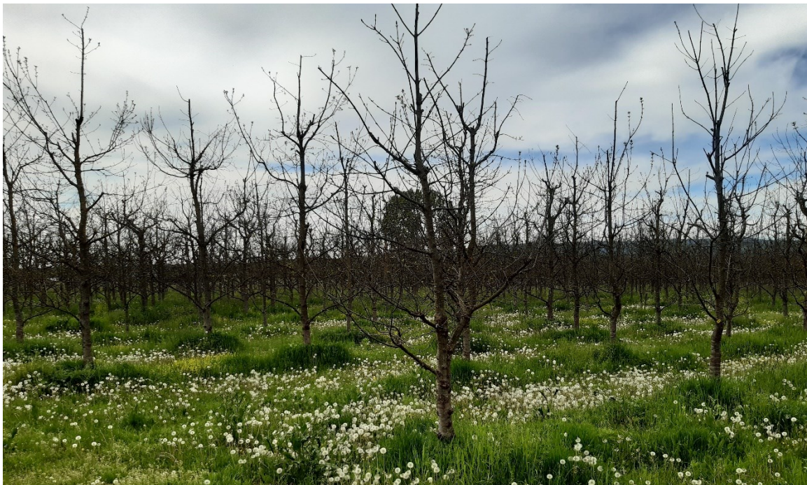
Slika 18. Pregled plantaže obavljen 30. travnja 2021.

Na plantaži je 10. veljače 2021. godine obavljena ručna prihrana gnojivom NPK 15:15:15. Plantaža je prihranjena sa 800 kg gnojiva Yara Mila Cropcare 15-15-15, a gnojivo je ručno raspršeno oko svake biljke. U veljači nije bila obavljena kemijska zaštita modrim uljem zbog rane cvatnje jasena. U ožujku stabalca poljskog jasena dobro su ocvala, posebno dio rameta koje su obilno cvale. Jaki mraz zabilježen je 7. i 8. travnja te je prouzročio velike štete na rametama koje su dobro procvjetale. U ranim jutarnjim satima 15. travnja opet je zabilježen srednje jaki mraz. Mraz je oštetiio mlade listiće koji su tek izlistali, dok na starim listovima nije bilo štete. Dio plodova je promijenio boju. Dana 30. travnja je obavljen terenski pregled plantaže radi upoznavanja s plantažom te je uočeno da je plantaža značajno stradala od mraza.