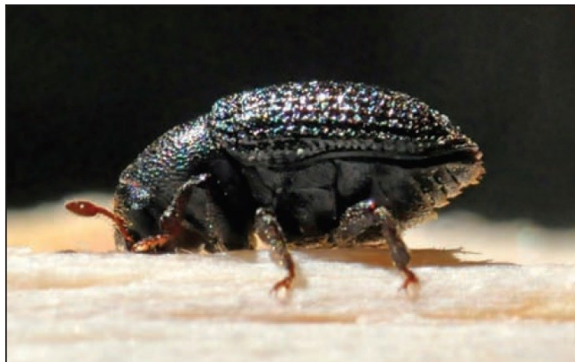
Slika 11. Imago velikog jasenovog likotoča

Dug je 3,8-6 mm. Možemo ga smatrati monofagom jasena, a u Hrvatskoj najčešći je na poljskom jasenu. Stvara materinski hodnik koji je poprečan, jednokrak i dosta kratak (3-5 cm), a postoje i horizontalni dvokraki hodnici koji su uvinuti prema gore ili dolje. Larvalni hodnici su do 30 cm dugi i zalaze u bijel, a materinski se nalaze u liku. Zipka je djelomično smještena u drvu. Mlada imaga ne hrane se dopunski, nego odmah izgrizaju materinski hodnik. Prezimljuje najčešće u stadiju imaga, ali i kao ličinke. Javlja se u travnju, a mladi potkornjaci nalaze se u srpnju i tijekom ljeta stvaraju drugu generaciju. Postoje i oni koji ne stvaraju drugu generaciju, nego prezimljuju na vratu korijena u kratkim hodnicima. (Hrašovec B., Franjević M., 2009)