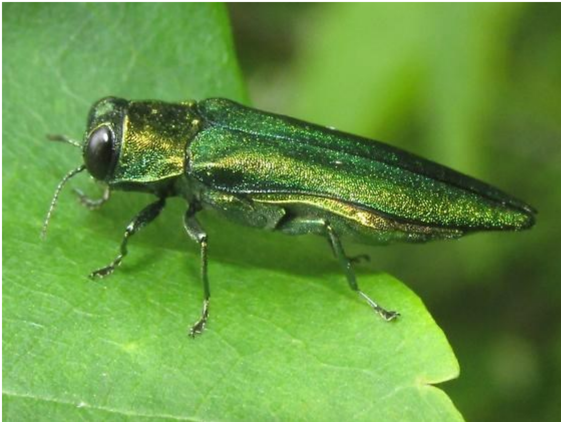
Slika 15. Imago vrste Agrilus planipennis Fairmaire

Smaragdni jasenov krasnik ( Agrilus planipennis Fairmaire) invazivna je vrsta kukca ksilofaga iz porodice Buprestidae (krasnici) porijeklom iz istočne Azije. Uzročnik je odumiranja jasena i čini znatne štete. Stvara jednu generaciju godišnje, dok je pojedinicima potrebno dvije godine za razvoj. Imaga su aktivni od sredine svibnja do srpnja. Nakon što izađu iz kukuljice kreću se prema krošnji i hrane se lišćem, a nakon 3-4 sata sposobni su za letenje. Ženke odlažu jajašca pojedinačno ili u malim grupama na površini kore, najčešće unutar pukotina i u brazdama na kori. Simptomi napada obuhvaćaju hodnike u obliku slova S, u kambijalnom dijelu stabla ispunjene piljevinom, zatim izlazne rupe u obliku slova D, žućenje i osutost krošnje, odumiranje grana, odumiranje i konačno sušenje stabla. (Frntić, M., 2017) U Hrvatskoj još uvijek nije prisutan.