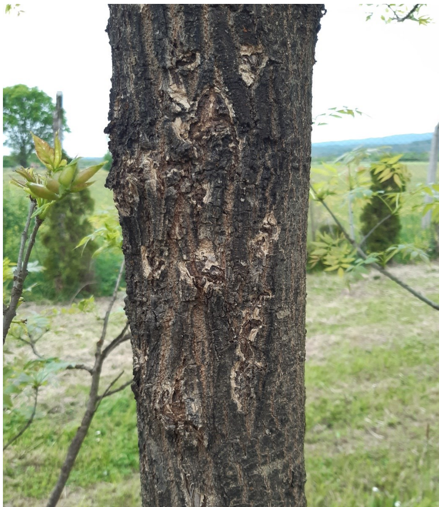
Slika 20. Pukotine slične rak-ranama tzv. „jasenove ruže“