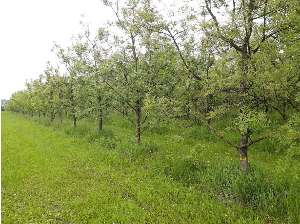
Slika 17. Klonska sjemenska plantaža Prvča