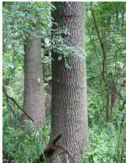
Slika 16. Stabla poljskog jasena u sastojini

Posljednjih nekoliko godina pokazuje sve izraženije simptome odumiranja. Također postoji problem s prirodnom obnovom sastojina poljskog jasena zbog manjka uroda sjemena u sastojinama.