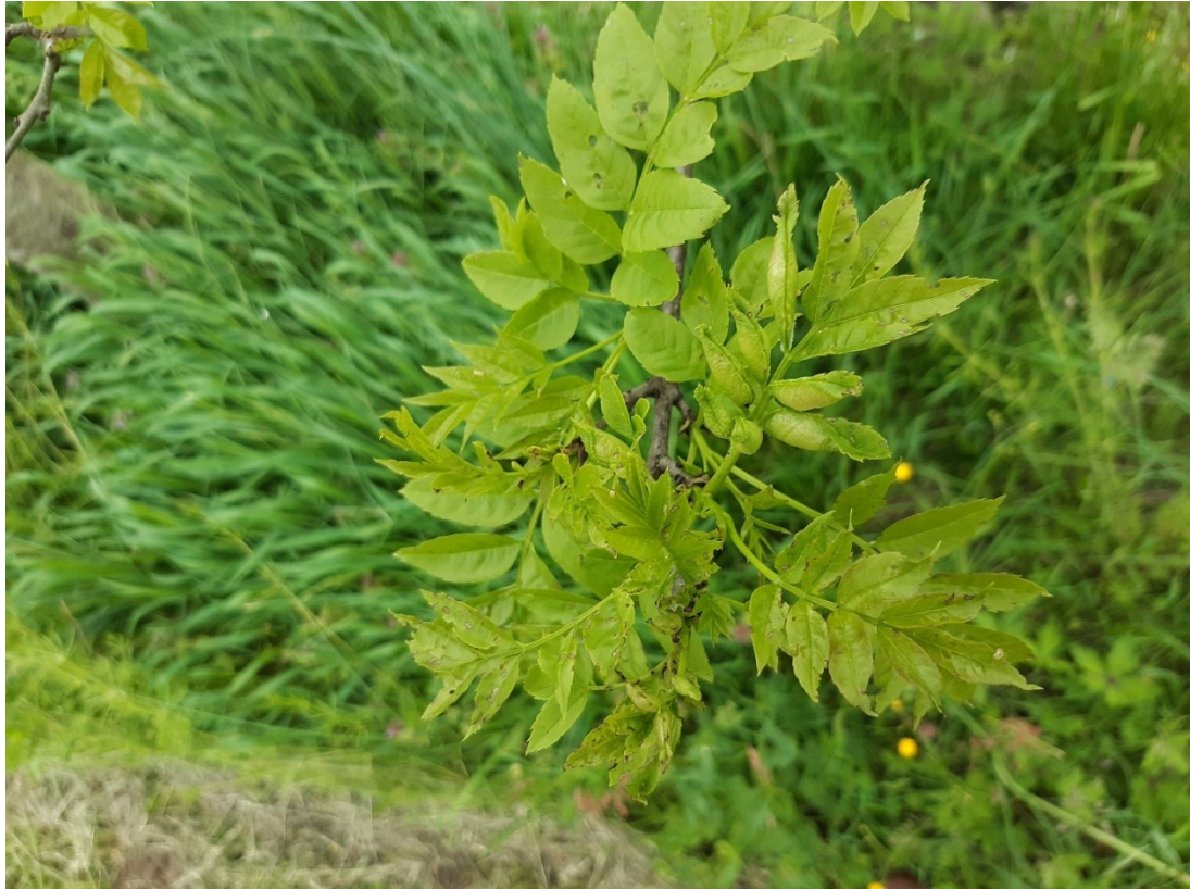
Slika 21. Evidentirane šiške jasenove lisne muhe šiškarice

Drugo terensko istraživanje obavljeno je 22. svibnja 2021. godine. Evidentirana je značajna prisutnost jasenove pipe ( Stereonychus fraxini De Geer) u vidu rupičastih grizotina na lišću od imaga i skeletiranih dijelova od ličinki. Nije bila izražena njezina masovna pojava, napad je bio srednje jak. Također uočene su jasenova lisna muha šiškarica ( Dasineura acrophila Winnertz) te jasenove lisne uši ( Prociphilus spp. Koch).