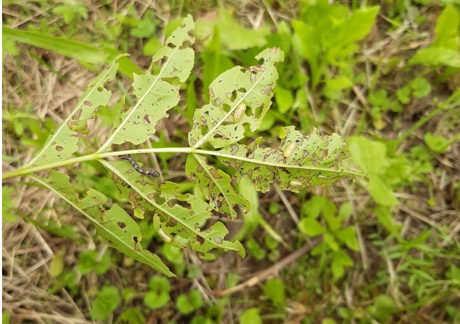
Slika 22. Ličinke jasenove pipe i skeletirano lišće