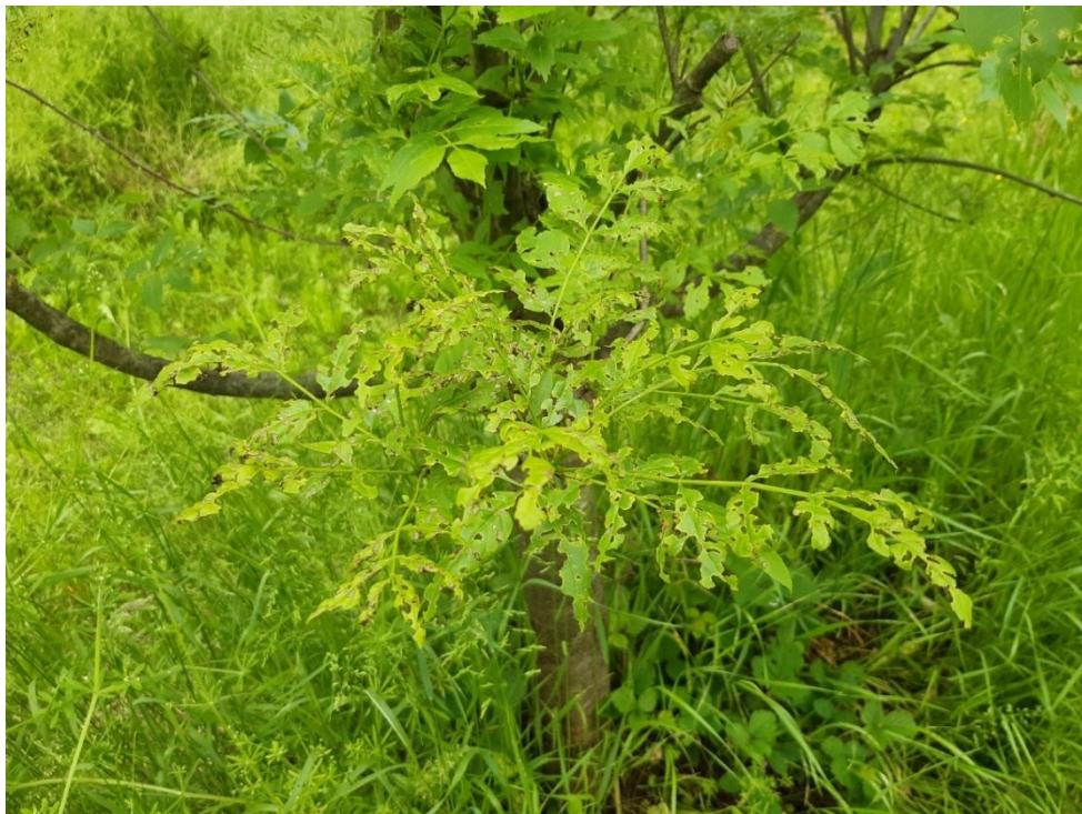
Slika 23. Primjer jačeg oštećenja ličinki jasenove pipe