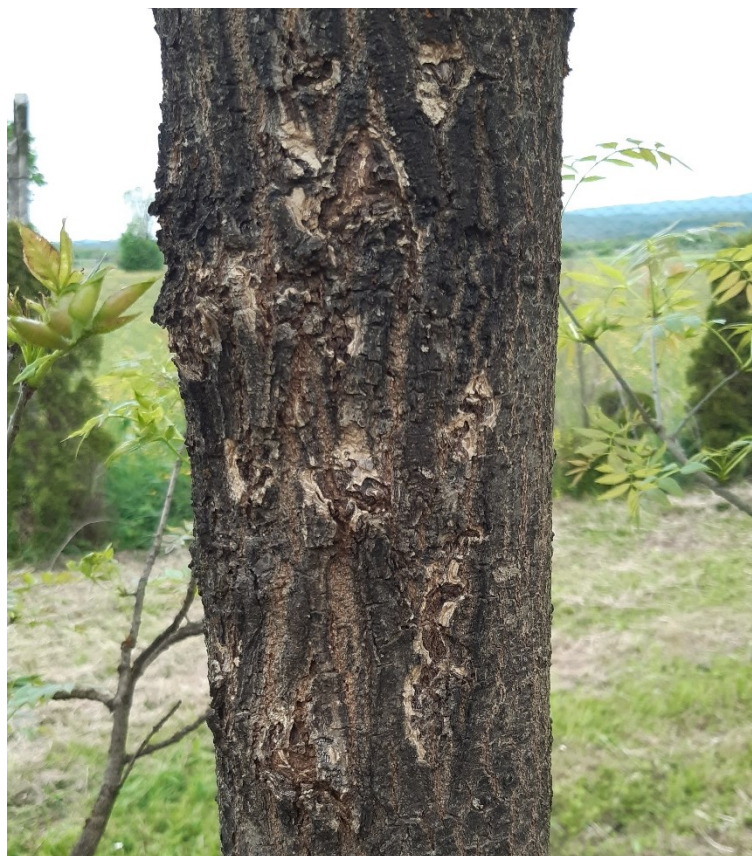
Slika 14. Pukotine na kori tzv. „jasenove ruže“