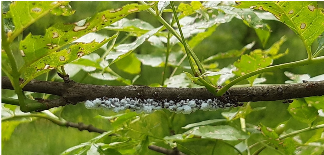
Slika 8. Nakupine uši na izbojcima u proljeće

Najčešće vrste koje se javljaju su Prociphilus fraxini (Hartig, 1841) i Prociphilus bumeliae (Schrank, 1801). Tri naše najčešće vrste jasena podjednako su napadnute. Kao i kod ostalih vrsta lisnih uši koje obilato luče mednu rosu, i ovim ušima svojstvena je povezanost s mravima koji ih štite te zauzvrat prikupljaju mednu rosu. Pojava ovih uši uobičajena je i katkada dosta izražena, ali ne smatramo ih posebno štetnima za jasen. (Hrašovec B., 2013)