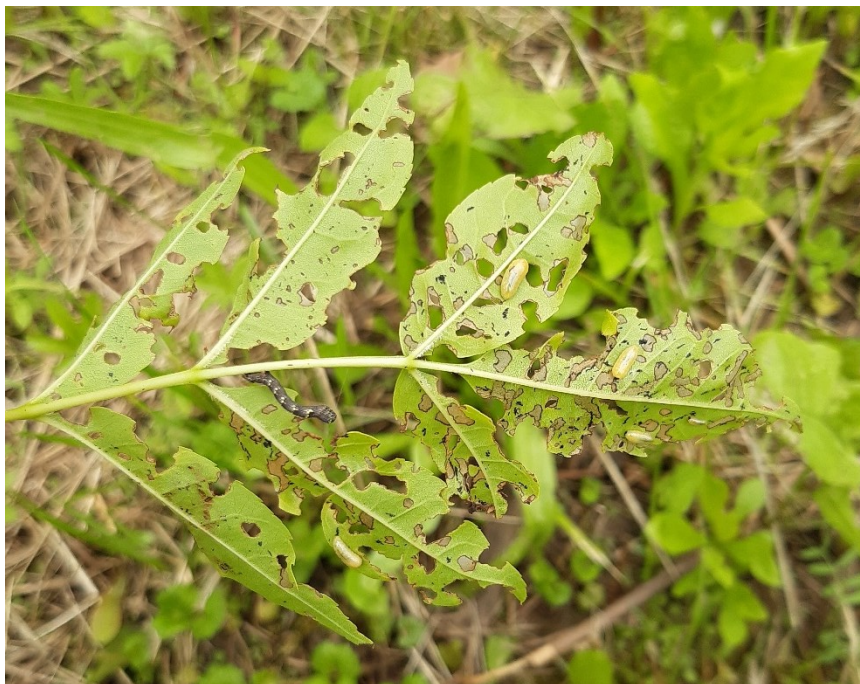
Slika 2. Ličinke jasenove pipe