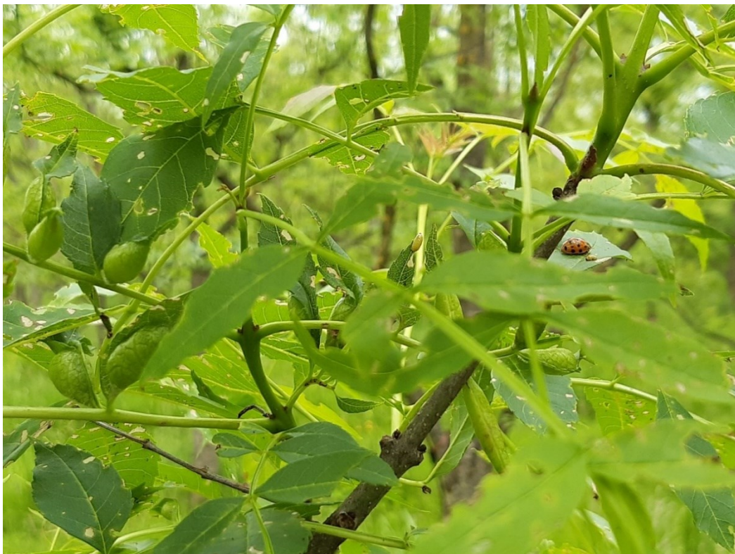
Slika 25. Ličinke pipe i šiške jasenove lisne muhe šižkarice