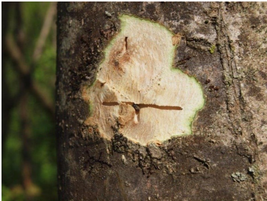
Slika 13. Materinski hodnik sa ženkom

Uporaba insekticida je neefikasna radi skrivenog života kukaca pod korom. Jedini način suzbijanja su higijensko-sanitarne mjere, a to podrazumijeva da se zaraženi materijal treba izvući iz šume prije izlijetanja sljedeće generacije, koja je izvor novih šteta. (Pernek, M., 2011)