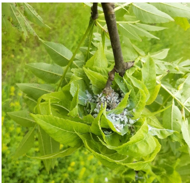
Slika 9. Uši u kuglastim formacijama