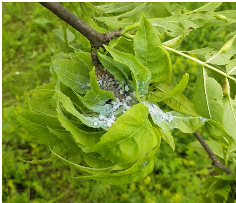
Slika 27. Kuglaste formacije jasenove lisne uši