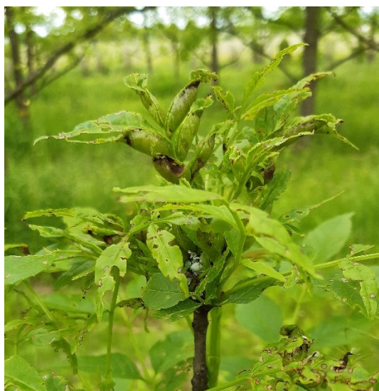
Slika 7. Šiške jasenove lisne muhe šiškarice

Jasenova lisna muha šiškarica ( Dasineura acrophila Winnertz) pripada porodici Cecidomyiidae (muhe šiškarice). Bijele ličinke žive društveno i uzrokuju abnormalan rast lišća. Napadnuto lišće presavija se u smjeru središnje žile prema gore, postaje zadebljano i formira se šiška u kojoj se razvijaju ličinke. Obično je napadnuto lišće na mladim izbojcima. Ima jednu generaciju godišnje, a prezimljuje u tlu. (Skuhravá i dr., 2006)