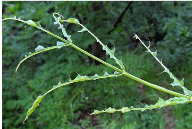
Slika 6. Potpuno izgrizeni list, ostala je samo glavna peteljka i jače postrane žile

Kod napada ove ose moguć je golobrst, a posljedice za stablo mogu biti otežani rast i trajne deformacije krošnje uslijed uzastopnih višegodišnjih napada. Rijetko dolazi do odumiranja slabijih stabala. (Tomiczek C. i dr., 2008)