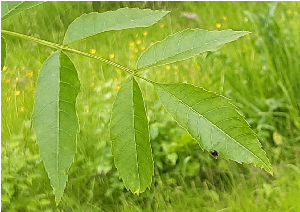
Slika 24. Imago jasenove pipe