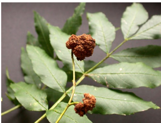
Slika 10. Deformacije grinje

Jasenova grinja ( Aceria fraxinivora Nalepa) je štetna grinja iz porodice Eriophyidae (grinje šiškariće). Veličine je od 0,1-0,4 mm, duguljaste, bezbojne ili žućkasto do narančaste boje. Ima dva para nogu. Izrasline nastaju nakon uboda i ulaska sekreta grinje. (Tomiczek C. i dr., 2008) Ova grinja uzrokuje deformacije na lišću, izbojcima, cvjetovima i plodovima. Može doći do šteta na sjemenskim plantažama zbog smanjenja uroda jasena.