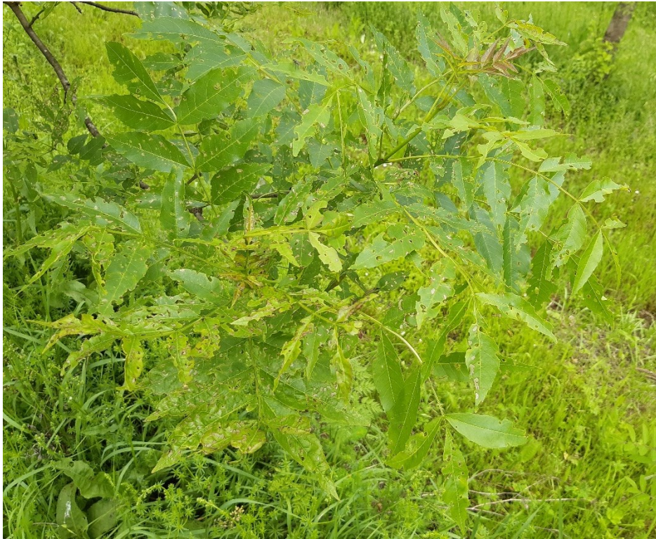
Slika 3. Rupičaste grizotine na lišću od odraslih pipa i skeletirani dijelovi lista od ličinki