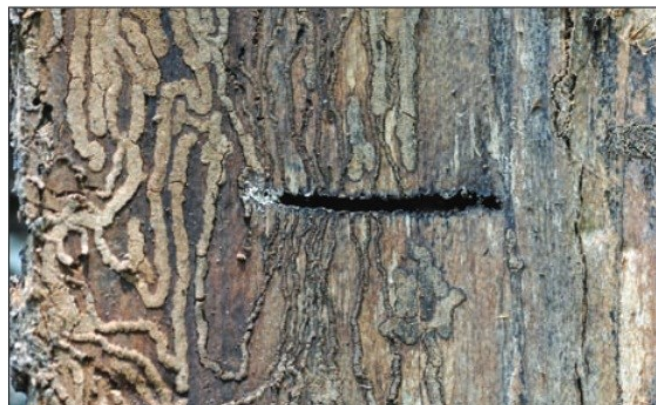
Slika 12. Poprečni materinski hodnik i larvalni hodnici