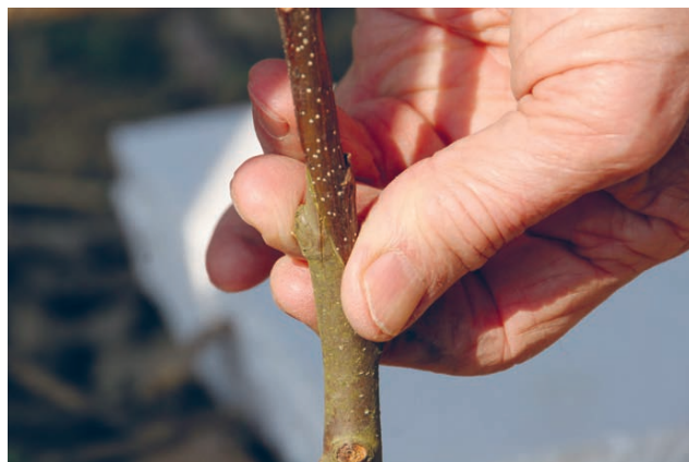
Slika 5. Cijepljenje na engleski spoj. Figure 5 Whip graft.

Polijeganje kao metodu razmnožavanja pitomog kestena često primjenjuju francuski uzgajivači. Međutim, rezultati istraživanja na povaljenicama značajno se razlikuju. U istraživanju Landalucea (1952) nije postignut dobar uspjeh u zakorjenjivanju povaljenica na mladim biljkama, dok su izbojci starijih panjeva imali uspješnost zakorjenjivanja od samo 20 %. Pri tomu se primjena auksina nije pokazala uspješnom, dok je prstenovanje kore vremenski i tehnički vrlo zahtjevno. U kasnijem istraživanju iz 1953. godine (Vietetz 1953), zabilježen je uspjeh u razmnožavanju povaljenicama. U 15 različitih tretiranja, uspješnost zakorjenjivanja bila je različita, a najuspješnijim su se pokazala tri tretmana: 5 mg/g indol-3-maslačne kiseline (IBA od eng. indole-3-butyric acid ) i 5 mg/g IAA; 10 mg/g IBA; 4 mg/g IAA i 4 mg/g 2,4-diklorofenoksioktene kiseline (2,4-D od eng. 2,4-dichlorophenoxyacetic acid ). Postupak je proveden u proljeće, uz primjenu auksina u lanolinskoj pasti te uz prekrivanje grana vlažnim mahom tresetarom. Korijen koji se razvio bio je najčešće debeo i bez korjenovih dlačica i time