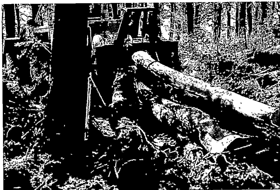
Sl. – Fig. 3. Fizička zaštita stabala pri privlačenju drva prenosnim »x« štitnikom – Physical protection of trees by using »x« protector

Uz povećanu razinu stručnog pristupa stabla će od ozljeda čuvati i budući zakonski propisi i uredbe odgovarajućim kaznenim mjerama.