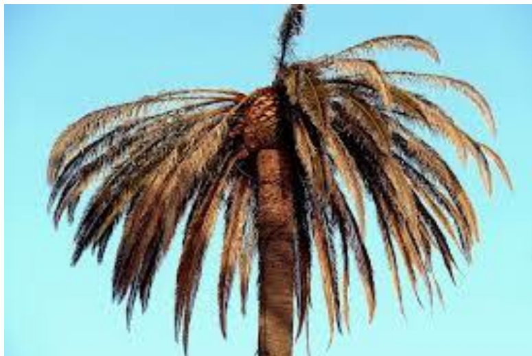
Slika 25. Izgled oslabjele palme napadnute palmotočem ( Paysandisia archon )