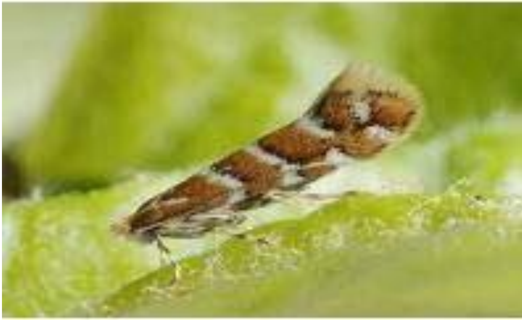
Slika 6. Na fotografiji je prikazan imago kestenovog moljca минера ( Cameraria ohridella )