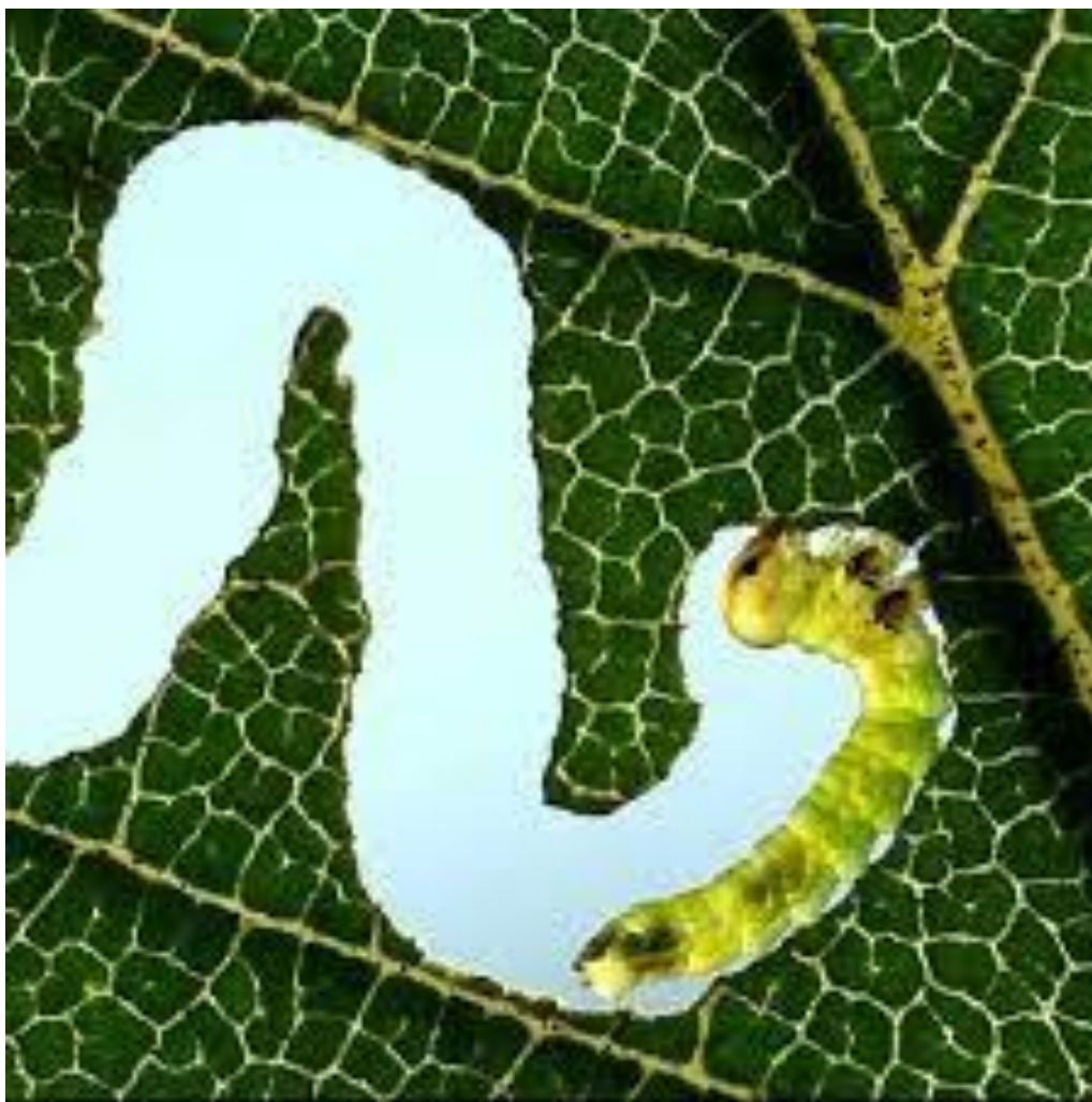
Slika 4. Ličinka brijestove muhe listarice ( Aprocerus leucopoda ) na listu brijesta ( Ulmus ) prilikom brsta