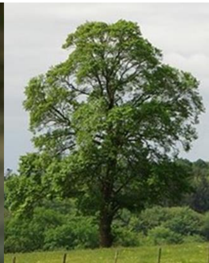
Slika 2. Izgled krošnje