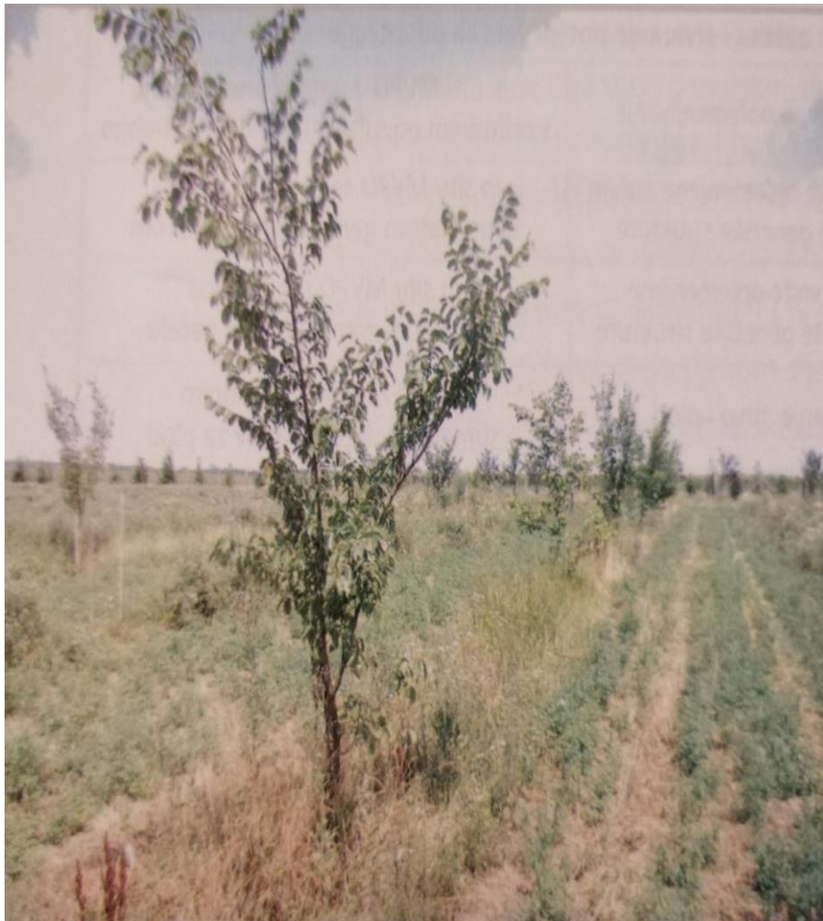
Slika 6. Klonski arhiv nizinskog brijesta (Ulmus Minor) u Otoku

vršiti njegu cijepljenih jedinki. Uzimanje plemki provodi se neposredno prije cijepljenja, te u vrijeme mirovanja vegetacije.