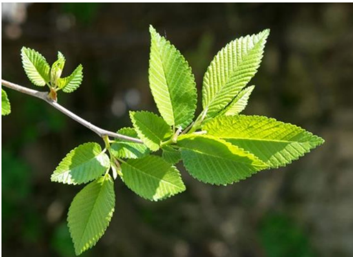
Slika 1. Izgled lista.

Nizinski brijest je plemenita listača koja pripada porodici Ulmaceae (brijestovi). Karakterističan je za naše predjele nizinskih šuma. Raste na svježim humoznim i dubljim staništima. Visina mu seže do 35 metara, a deblo može imati promjer i do 2 metra promjera. Naime, nizinski brijest je snažno stablo, pravno, s gustom razgranatom krošnjom. Kora je debela, crvenkastocrne boje, uzdužno bočno ispucala. Korijenov sustav je izrazito razvijen. U mladosti ima žilu srčanicu koja kasnije odumire, te nastaje bočno korijenje koje je brojno. Nadalje, listovi su u osnovi asimetrični, s izrazitim bočnim žilama, koje se viličasto dijele blizu ruba. Nizinski brijest je listopadna, jednodomna, anemofilna, mezofilna i poluskiofilna vrsta (Franjić, Škvorc). Cvjeta u ožujku i travnju, prije listanja. Cvjetovi su dvospolni, brojni u gustim čupercima, na prošlogodišnjim izbojcima. Plod je bjelkastožutkasti, okriljeni, jednosjemeni oraščić. Sjeme dozrijeva potkraj proljeća, u svibnju i lipnju, lagano je i slabije je klijavosti. Razmnožava se generativno i vegetativno, te klije epigeično.