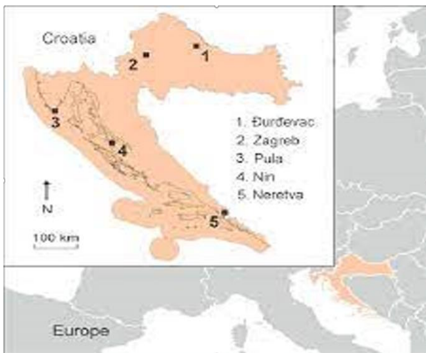
Slika 3. Nizinski brijest (najveći udio) u Hrvatskoj