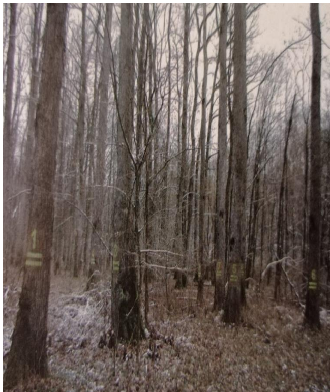
Slika 5. In situ očuvanje nizinskog brijesta ( Ulmus minor ) u Ivanjskoj

prednost in situ metode jest kompatibilnost s gospodarenjem šumama. Populacije drveća koje su selekcionirane i onda u velikom broju prirodno obnovljene ili pošumljene, a njihovo sjeme potječe iz lokalnih populacija vjerojatno će zadržati svoju raznolikost (Ballian, Kajba). Dok, kod ex situ metode očuvanje može imati posebnu ulogu kod autohtonih vrsta, gdje zbog opasnosti od onečišćenja ili klimatskih promjena koje nam svakodnevno prijete premještamo genetski materijal u sigurnija područja s pogodnom klimom koje bi trebalo biti održivo rješenje. Stoga, očuvanje nizinskog brijesta preporučuje se, dugoročnije, metodom višestrukoga populacijskog oplemenjivanja (MVPO) za in situ očuvanje genofonda. Nizinski brijest stradava od gljive Ophiosotma ulmi i O. novo-ulmi , te se očuvanje vrste mora temeljiti u niskom uzgoju na headingu , tzv. sječi u glavu. No, prema dosadašnjim saznanjima, koristi se kombinacija in situ i ex situ metoda.