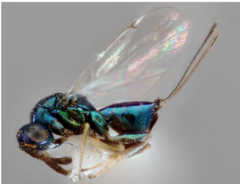
Slika 4. Ženka Thorymus sinensis

Prvo puštanje T. sinensis u Hrvatskoj provedeno je 14. travnja 2014. godine u Pazinu u šumi pitomog kestena od 13 ha. Stopa parazitiranja nakon prve godine izlaska parazitoida bila je 7.3%. Pored Pazina, T. sinensis je ispušten na više lokaliteta u Hrvatskoj. Dvije godine nakon prvog ispušta parazitiranost je dosegla čak 90%.