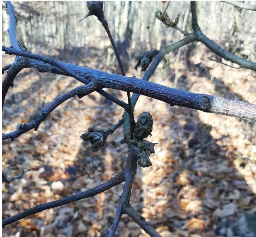
Slika 3. Prošlogodišnje šiške D. kuriphilus na pitomom kestenu