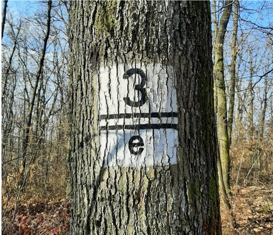
Slika 7. Prikaz odijela 3/e u park šumi Dotrščina