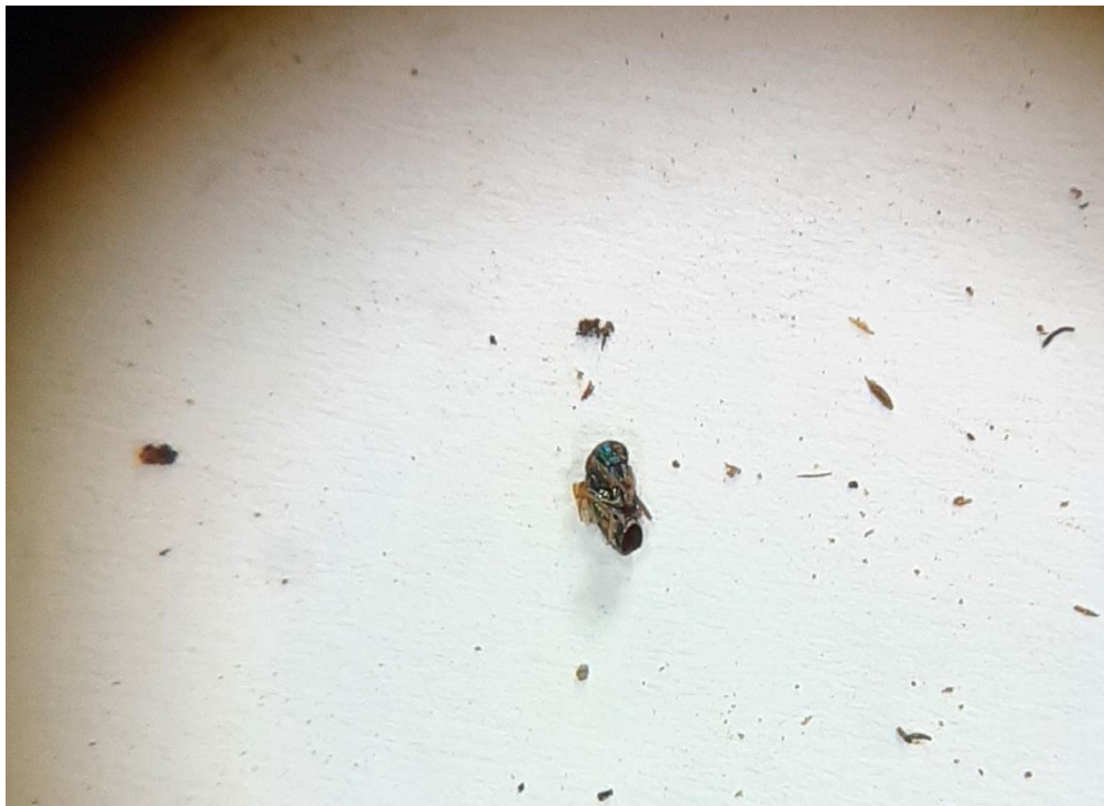
Slika 8. Prikaz adulta ose T. sinensis

Od 100 uzoraka šiški Dryocosmus kuriphilus koje su secirane pronađena je jedna pupa libera (Slika 9.), te dva adulta parazitske ose T. sinensis . T. sinensis ima slobodnu kukuljicu kod koje su svi dijelovi tijela kukca (noge, krila) slobodni. Takvu kukuljicu imaju npr. kornjaši, opnokrilci, mrežokrilci.