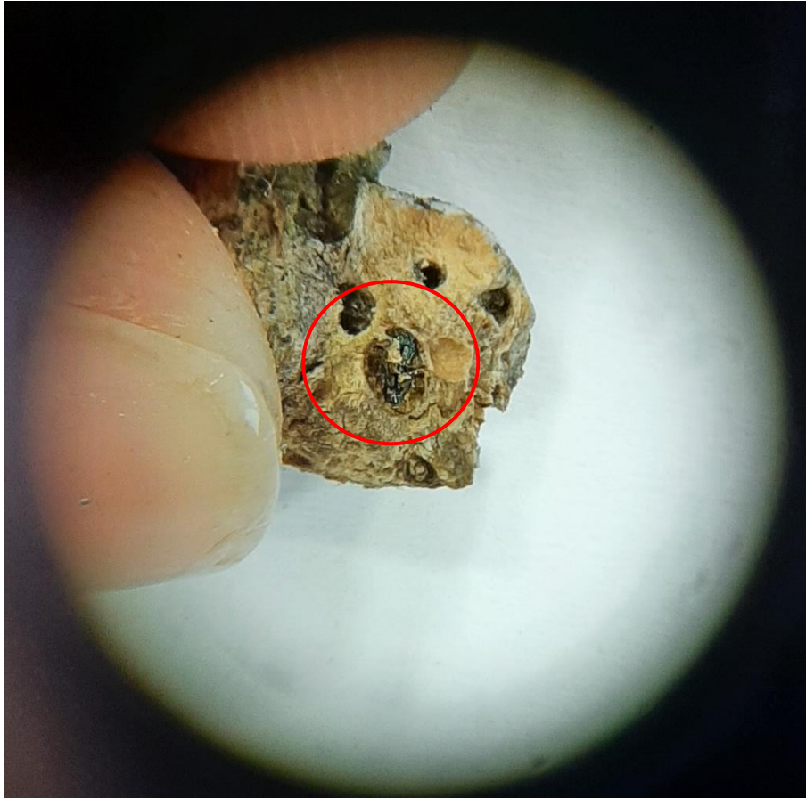
Slika 11. Prikaz ose T. sinensis