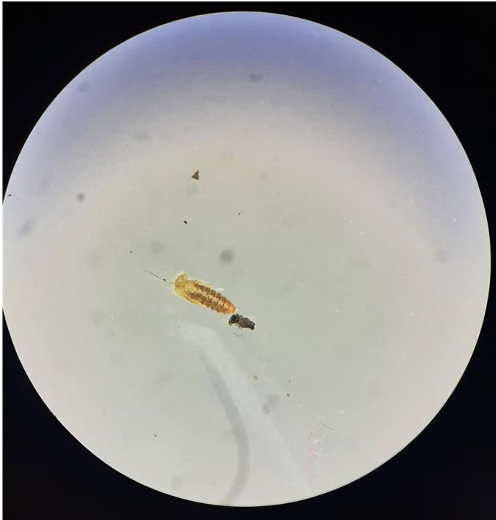
Slika 9. Prikaz pupa libera T. sinensis