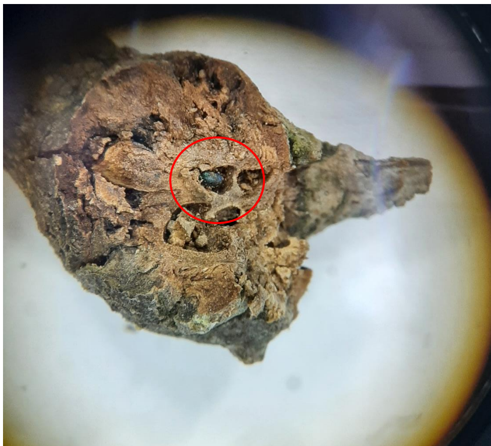
Slika 10. Adultni stadij T. sinensis u šiški pitomog kestena

U prikupljenim uzorcima prilikom seciranja pronađeno je čak 7 parazitskih osa T. sinensis na sto uzoraka.