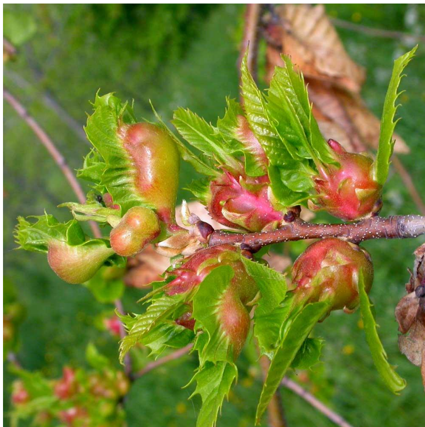
Slika 2. Ovogodišnje šiške D. kuriphilus na pitomom kestenu

Ovogodišnje šiške (Slika 2.) su 5-20 mm velike, zelene i ružičaste, lako uočljive na izbojcima i na listovima. Razvijaju se na mladim listovima, peteljka ili na glavnim listovima žila. Nakon izlaska imaga, šiške se osuše postaju drvenaste i posmeđe (prošlogodišnje) (Slika 3.). Ostaju na izbojcima i do 2 godine. Jaja i ličinke prvog larvalnog stadija uočljivi su samo mikroskopskim pregledom kao i sama prisutnost ose u šiški.