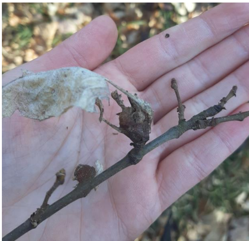
Slika 5. Sakupljena šiška na području park šuma Dotrščina

Provedena su tri periodička sakupljanja uzoraka s pitomog kestena na dvjema lokacijama u Zagrebu. Dva sakupljana u park šuma Dotrščina te jedno na području Markuševačke Trnave. Šiške su nasumično sakupljene s različitih stabala. (Slika 5.) Utvrđivanje lokaliteta rasprostranjenosti i prisutnosti parazitske ose T. sinensis vršeno je obilaskom terena i vizualnim pregledom stabala u periodu od 15. veljače do 12. ožujka 2022. godine na području grada Zagreba. Nakon sakupljanja šiške su smještene u laboratorij Šumarskog fakulteta Sveučilišta u Zagrebu na sobnoj temperaturi. Šiške su potom secirane te se bilježila prisutnost parazitoidea u njima.