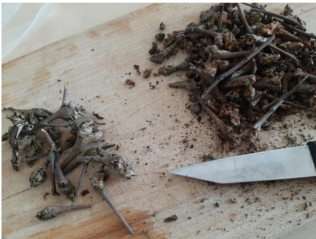
Slika 6. Seciranje sakupljenih šiški Dryocosmus kuriphilus

Prvo uzorkovanje obavljeno je 15.02.2022 i drugo 03.03.2022 sa iste lokacije na području grada Zagreba, park šuma Dotrščina (3/e) (Slika 7.). Treće uzorkovanje obavljeno je 12.03.2022 na području Markuševačke Trnave. Prilikom sva tri uzorkovanja prikupljeno je 100 šiški koje su poslije postavljene na sobnu temperaturu, a potom secirane i promatrane.