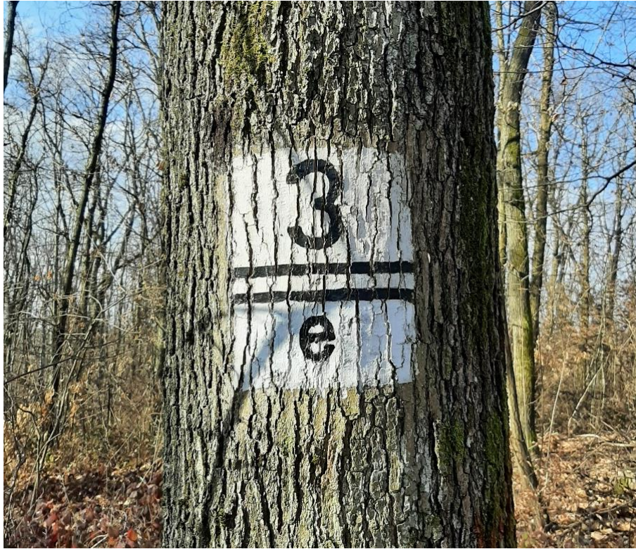
Slika 7. Prikaz odijela 3/e u park šumi Dotrščina