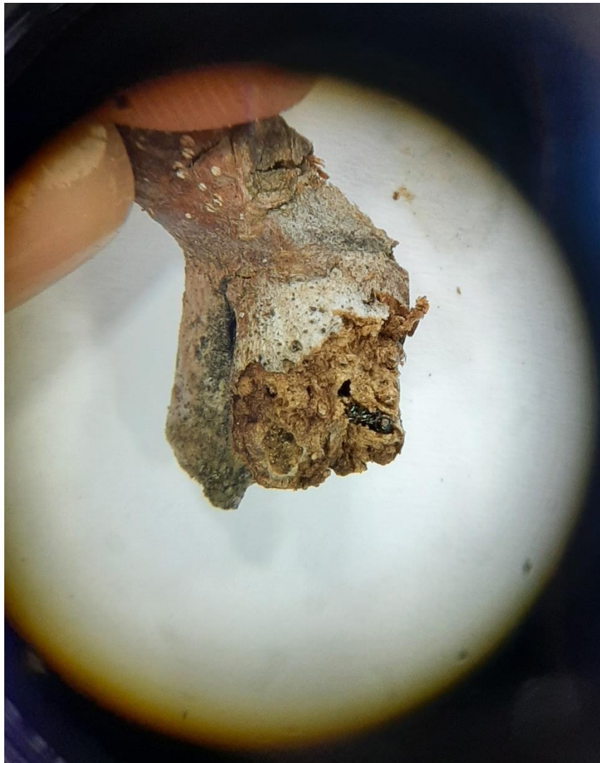
Slika 12. Osa T. sinensis u šiški pitomog kestena

U uzorcima prikupljenim na području Markuševačke Trnave prilikom analize pronađene su samo dva adulta stadija parazitske ose T. sinensis na sto šiški Dryocosmus kuriphilus .