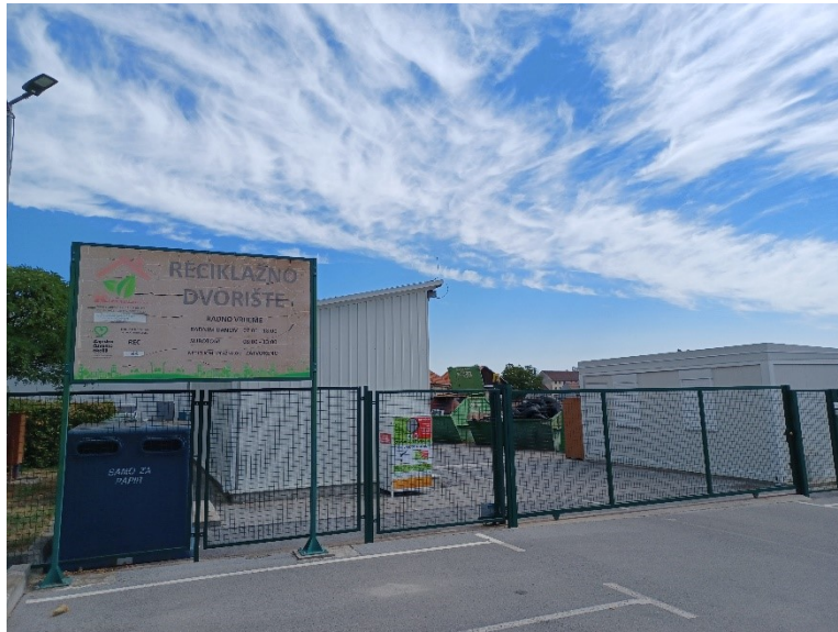
Slika 14. Reciklažno dvorište Bjelovar

Reciklažno dvorište nalazi se u ulici Tomaša Garika Masaryka. Započelo je s radom 1. lipnja 2016. godine. U reciklažnom dvorištu može se odložiti oko 50 vrsta otpada iz domaćinstva bez naknade. Na lokaciji reciklažnog dvorišta nalazi se nadstrešnica za skladištenje opasnog otpada i hala za prešanje, baliranje i skladištenje papira, kartona, folije i stiropora.