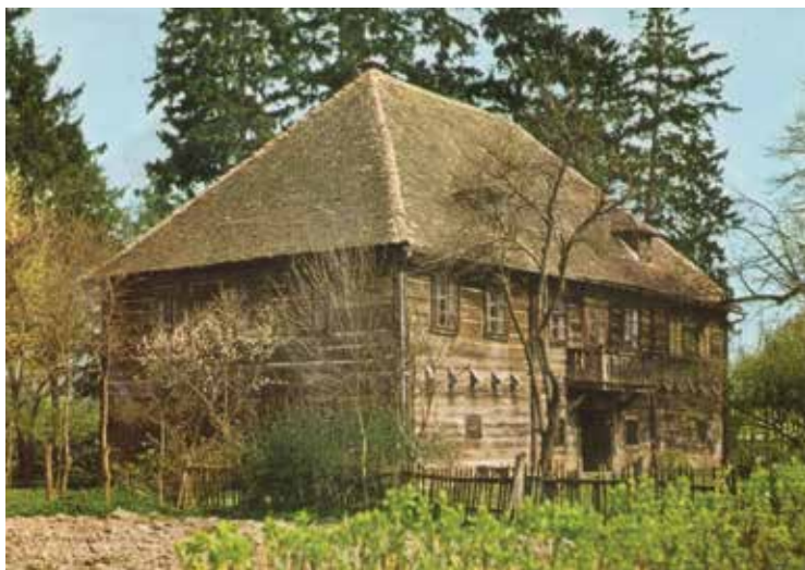
SLIKA 5. Perivoj oko kurije Modić-Bedeković u Donjoj Lomnici

(Pojmovnik HUA). Za prosudbu stabala upotrebom vizualne metode je korišten prosudbeni obrazac čime su sva uočena saznanja sistematski prikupljena i opisana. Na temelju tih informacija se određivala potreba za ispitivanjem upotrebom arborikulturnih instrumenata za određivanje opasnih stabala te se odredilo na kojem dijelu stabla treba primijeniti pojedini instrument. Kao rezultat prosudbe treba proizaći opis vitaliteta (Pojmovnik HUA) i statike stabla (Pojmovnik HUA) sa preporukama za izvođenje radova na stablu.