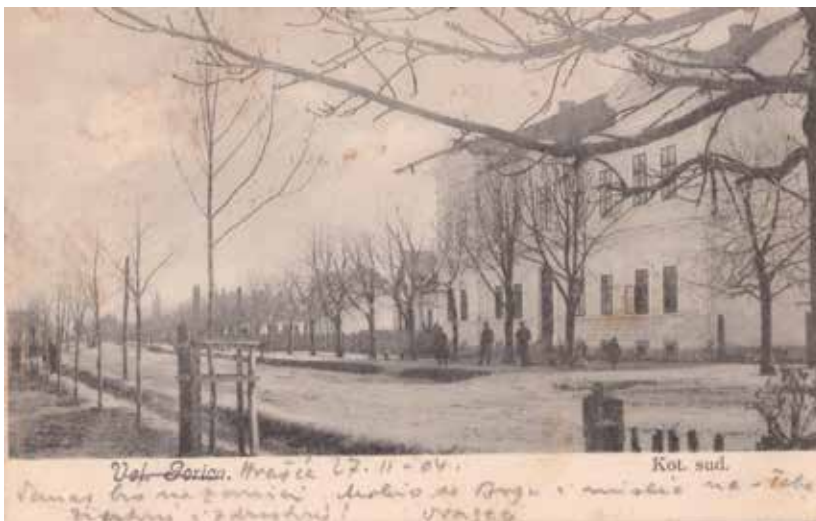
SLIKA 8. Drvored divljeg kestena u današnjoj Zagrebačkoj ulici u Velikoj Gorici iz 1904. godine