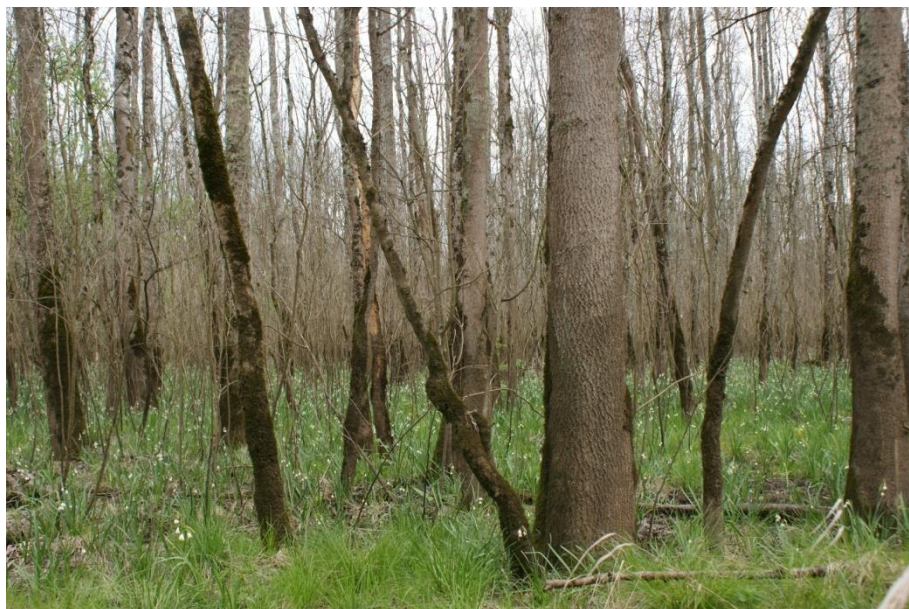
Slika 13. Izgled tipične sastojine poljskog jasena s kasnim drijemovcem

ovakvo stablo moglo biti potencijalno rezistentno te kasnije može poslužiti kao izvor za produkciju vegetativnog i generativnog reprodukcijskog materijala.