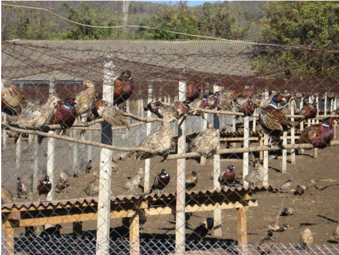
Slika 15. Stabilne volijere za podivljavanje divljači.

U četvrtoj fazi uzgoja fazani dozrijevaju u stabilnim volijerama od 9 tjedna života. Potrebno im je osigurati 4-5m 2 prostora po fazanu. Volijere su ograđene žičanom mrežicom, a izvana je električni pastir za zaštitu od divljači. U ovoj fazi piliće pripremamo na podivljavanje i otpuštanje u prirodu (slika 15). (Pintur 2010.).