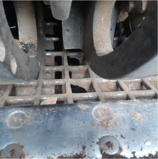
Slika 2. Sito veličine 8 cm