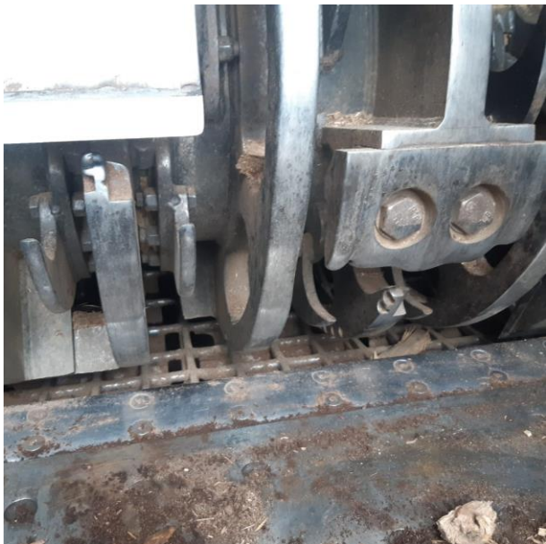
Slika 3. Kontranož na bubanjskom iveraču