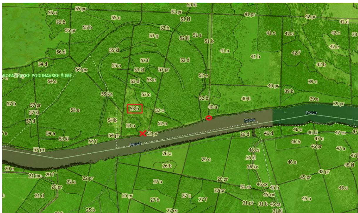
Slika 6. G. J. »Kopačevske podunavske šume«, odsjek 53b, mjesto iveranja (X) i »T« okretaljka (O) ( http://javni-podaci.hrsune.hr/ )

Sječa stabala provedena u zadnjem kvartalu 2020. godine kada je obavljeno i privlačenje oblog drva i drvnog ostatka (ovršina). Do trenutka iveranja ovršina protekle su dvije godine i deset mjeseci. U ukupnoj strukturi iverane sirovine, ovršine euroameričke topole činile su 80 %, dok je ostatak činio poljski jasen, američki jasen, bijela topola i ostala tvrda bjelogorica. Slike 7 i 8 prikazuju drvenu sirovinu koja je iverana na radilištu Mali Bajar-Naturavita.