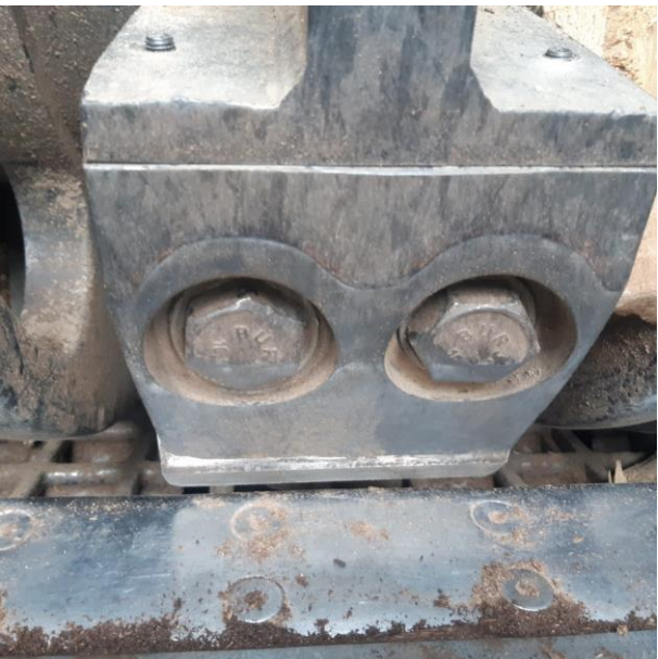
Slika 4. Nož i kontranož na bubanjskom iveraču