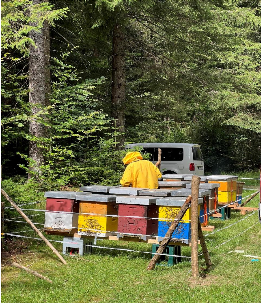
Slika 4 Košnice pčela na području Mrkoplja, Gorski kotar u bukovo-jelovoj šumi