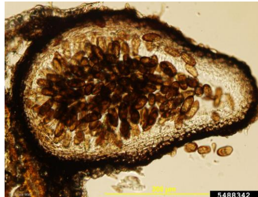
Slika 4. (lijevo) – piknide gljive Sphaeropsis sapinea (Fr.) Dyko et Sutton na iglicama