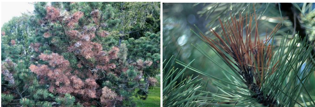
Slika 1. i 2. Simptomi zaraze patogenom gljivom Sphaeropsis sapinea (Fr.) Dyko et Sutton