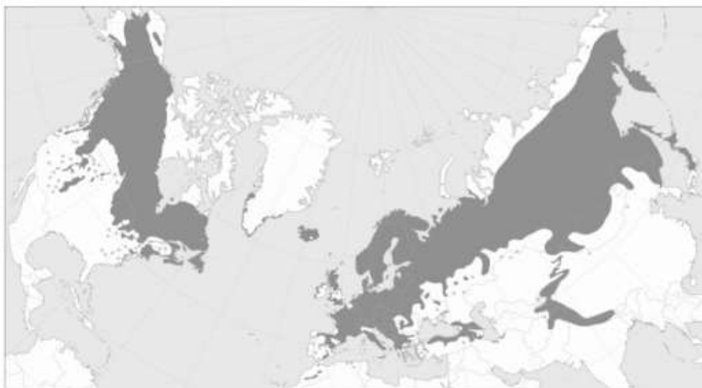
Slika 4. Prirodna rasprostranjenost Juniperus communis

Obična borovica je vrsta izrazito široke ekološke valencije te je najrasprostranjenija četinjača na Zemlji, čiji areal obuhvaća cijelu sjevernu polutku, tj. sjevernu Afriku, čitavu Europu, srednju i sjevernu Aziju i Sjevernu Ameriku (Slika 4). U južnoj Europi rasprostire se u brdskim područjima. U svojim zahtjevima na bonitet tla je veoma skromna. Osim toga, dobro podnosi ne samo niske zimske temperature, nego i ekstremne ljetne temperature (Herman 1971).