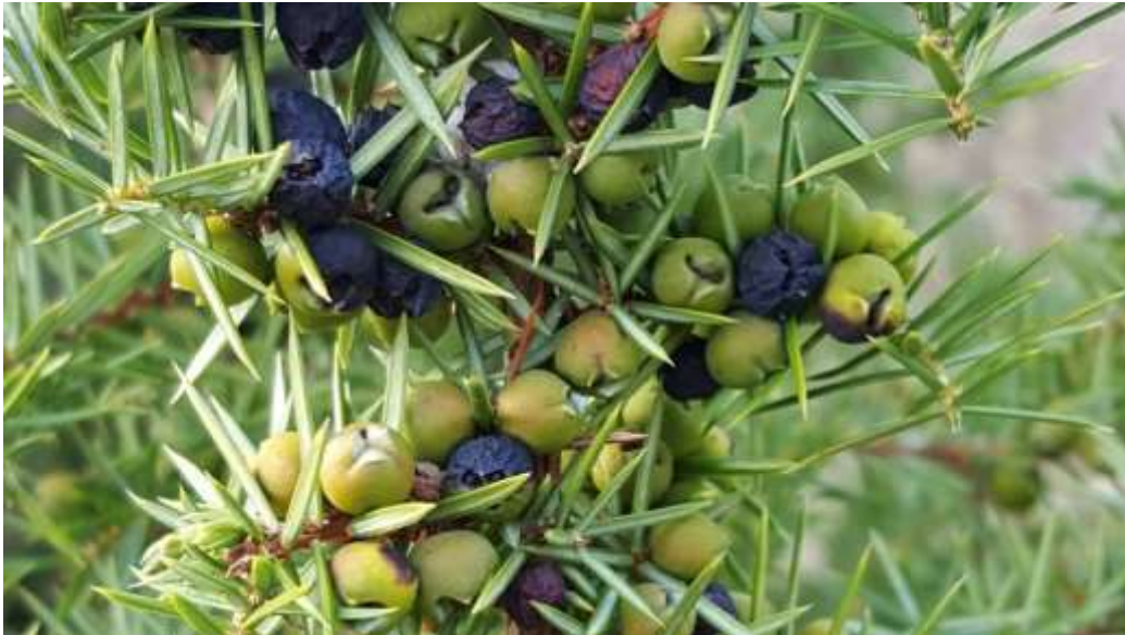
Slika 3. Igličasti listovi s bobuljastim češerima