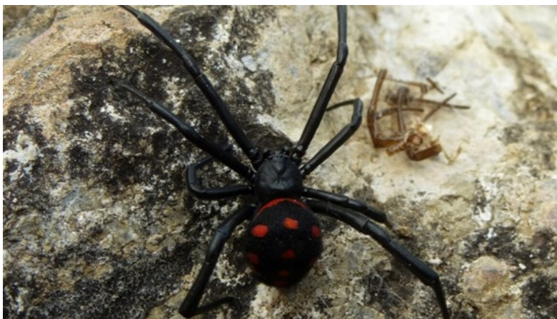
Slika 2. Crna udovica

vrlo blizu tla, u travi, ispod kamenja, u dupljama drveća, pri dnu panjeva i mladih izbojaka, ponekad u lišću, te gustoj makiji i šikari. Također treba spomenuti da svoju mrežu gradi i na napuštenim objektima. Mreža je najčešće neuglednog i nepravilnog oblika, zaštićena travkama, lišćem u ostacima insekata. Crna udovica (slika 2) je noćni insekt, koji rijetko napušta mrežu. Hrani se insektima i održava prirodnu ekološku ravnotežu.