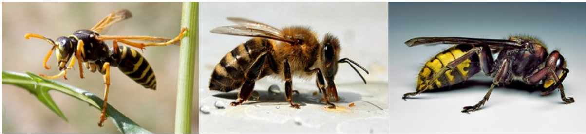
Slika 4. Osa, pčela i stršljen

može imati i pojedinačni ubod opnokrilca u području usne šupljine zbog lokalnog nastanka otekline jezika i ždrijela što može izazvati gušenje.