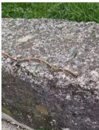
Slika 3. Kolona gusjenica Borovog četnjaka

Borov četnjak gnjezdar ( Thaumetopoea pityocampa (Denis & Schiffermüller, 1775)) najrašireniji je i najopasniji štetnik borova. Borov četnjak štetnik je od javnog interesa zbog gusjenica koje uzrokuju ozbiljne alergijske reakcije kod ljudi i životinja. Na našim području početak rojenja borovog četnjaka obilježen je pojavom leptira obično između srpnja do kolovoza. Porodica je ime dobila po karakterističnim gusjenicama koje se prilikom kretanja svrstavaju u kolonu jedna za drugom tj. četu stvarajući dugi neprekinuti lanac ponekad i po par metara (slika 3). Tijelo gusjenice ovih leptira prekriveno je otrovnim dlačicama, toksaforama, koje izazivaju iritaciju kože i jak svrbež (Koren, 2023).