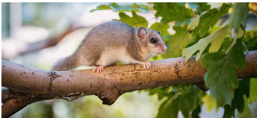
Slika 11. Sivi puh (Suchanek, 2022.)

Prema kalendaru lovidbe za 2024. godinu (sukladno Pravilniku o lovostaju NN, 94/2019.), sivi puh se može loviti od 1. listopada do 30. studenog. Nekada se lovio dva puta godišnje – u proljeće prilikom izlaska iz pušina i u jesen nakon njegovog intenzivnog hranjenja. Lovilo ga se na više načina. Metode lova na puhove su lov pomoću tuljaca, lov pomoću mrtvolovki, lov u dupljama, lov pomoću kamena ili daske te lov puškom (Perić, 2016).