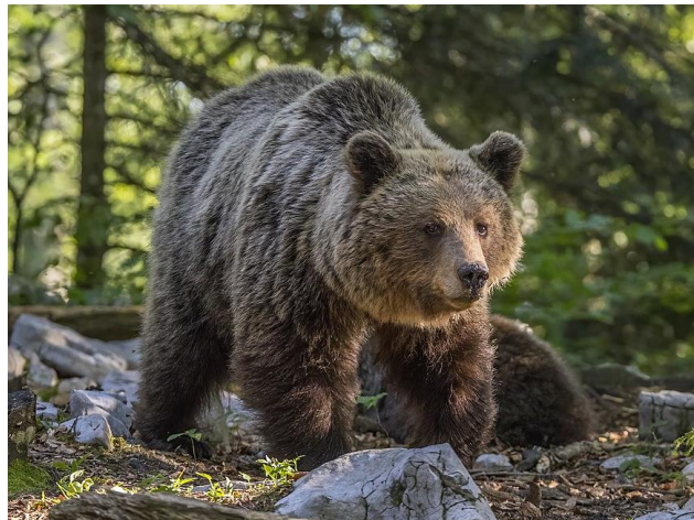
Slika 7. Smeđi medvjed (Sharp, 2022.)

Smeđi medvjedi su najveći kopneni mesožderi. U Hrvatskoj odrasle ženke imaju prosječno 120 kilograma, mužjaci 210 kilograma, a neki primjerci mogu prijeći i 300 kilograma (Trbović, 2016). Masa im varira ovisno o dobu godine - najveća je u kasnu jesen pred brloženje, a najmanja početkom ljeta (HAOP, 2024). Prosječna duljina tijela mužjaka iznosi od 170 do 190 centimetara, a ženke od 160 do 185 centimetara. Zdepaste i snažne su građe te im je tijelo prilagođeno raznim životnim situacijama i raznovrsnom načinu hranjenja. Tijelo mu je pokriveno dugom smeđom dlakom i gustom poddlakom koja je ljeti rjeđa nego zimi. Na prstima nogu ima kandže koje mu služe za raskopavanje zemlje, trulih panjeva i mravinjaka, njima okreće kamenje, ubija i trga plijen. Zubalo ima sva obilježja zvijeri, s karakterističnim sjekutićima, očnjacima i deračima, zubne formule I 3/3, C 1/1, P 4/4, M 2/3 te ukupno ima 42 zuba (Trbović, 2016).