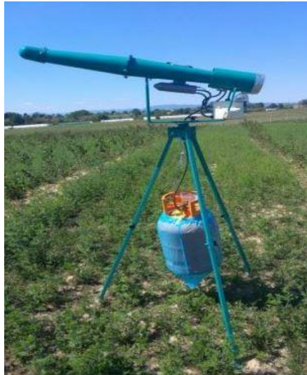
Slika 16. Plinski top (Novosel, 2010.)

Plinski topovi ili jake sirene su uređaji za plašenje divljači. Namješteni tako da se uključuju u pravilnim razmacima, treba ih koristiti povremeno, a povećanje učinka trebalo bi mijenjati učestalost uključivanja i pomicati ih svakih nekoliko dana (Rajković, 2018).