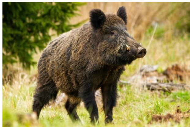
Slika 5. Divlja svinja (Thompson, 2022.)

Prema kalendaru lovidbe za 2024. godinu (sukladno Pravilniku o lovostaju NN, 94/2019.), za divlju svinju nije propisan lovostaj, osim za ženku kada je visoko bređa ili dok vodi mladunčad.