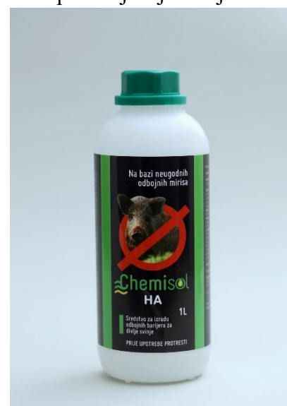
Slika 17. Repelent (izvor: https://chemisol.hr/ , pristupljeno 20.08.2024.)