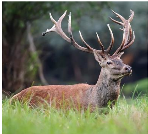
Slika 1. Jelen obični (Ožetski, 2012.)

Jelen obični je poligam što znači da može oploditi više ženki (Mustapić i suradnici, 2004). Parenje jelena naziva se rika zbog specifičnog glasanja mužjaka tijekom razdoblja parenja. Spolna zrelost košute ovisi o staništu i dostupnosti hrane. Na staništima bolje kvalitete jedinke mogu biti spolno zrele već sa 18 mjeseci starosti, dok na onim lošijima su spolno zrele tek sa 30 do 35 mjeseci starosti. U nizinskom području rika počinje sredinom kolovoza i traje do listopada, a u planinskom dijelu započinje sredinom rujna i traje do sredine listopada. Košuta je gravidna od 33 do 34 tjedna (Hodak, 2023).