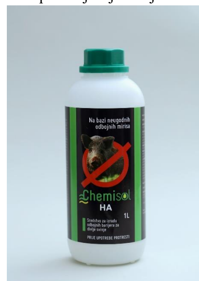
Slika 17. Repelent (izvor: https://chemisol.hr/ , pristupljeno 20.08.2024.)