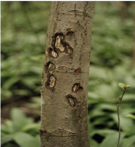
Slika 6. Šteta od divlje svinje

Najsigurnija zaštita stabala od divljih svinja je podizanje jakih žičanih ograda oko ugroženih mjesta pri čemu mreže moraju biti ukopane u zemlju da se svinje ne mogu provući ispod njih. Žir se može zaštititi tako da se prije sjetve tretira sredstvom koje poništava miris žira. Također, odstrelom se treba divlje svinje svesti na normalno brojno stanje. Populaciju divljih svinja smanjuju i bolesti, najčešće danas aktualna afrička svinjska kuga (Glavaš, 2012).