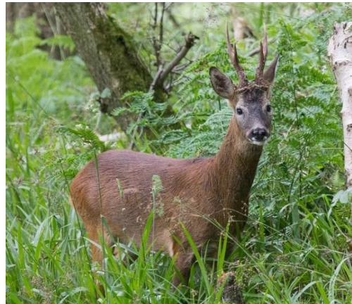
Slika 3. Srna obična (Stephens, 2019.)

Tijelo srne je građom predodređeno za život u gustoj visokoj travi, šikari i korovu te je zato skladno i vitko. Dužina tijela od vrha njuške do korijena repa iznosi od 130 do 140 centimetara, a visina do grebena je oko 75 centimetara. Srne su veće i teže što im je stanište na višoj nadmorskoj visini te im zato masa varira od 15 do 35 kilograma. Ljeti joj je dlaka hrđastocrvene boje, a zimi kestenjastosiva. Na stražnjici ima žuto-bijelu mrlju dlaka koju nazivamo ogledalo koje je kod srnjaka okruglog, a kod srne srolikog izgleda. Srna na nekim dijelovima tijela ima žlijezde koje služe za mirisno označavanje. Među papcima stražnjih nogu je žlijezda koja služi za obilježavanje područja, a potkoljenska žlijezda služi za oznaku traga kada prolaze kroz visoku travu ili grmlje. Kod ženki nalazimo žlijezdu na stražnjici koja je posebno aktivna u vrijeme parenja, a kod mužjaka postoji čeona žlijezda koja služi za obilježavanje teritorija trljanjem o stabalca i grmlje. Srna ima ukupno 32 zuba, zubne formule I 0/4, P 3/3, M 3/3. Srnjak je punorožac. Svake godine u studenom odbacuje rogove. Kod srnjaka se rožišta počinju razvijati u kolovozu u prvoj godini života. Srna je biljojed. Hrani se travom, lišćem, izbojcima, žirom, kestenom, bukvicom i divljim voćem (Mustapić i suradnici, 2004).