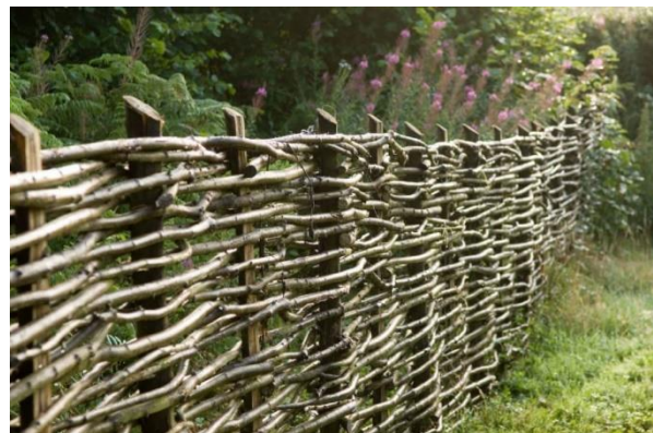
Slika 12. Ograda od prirodnih materijala