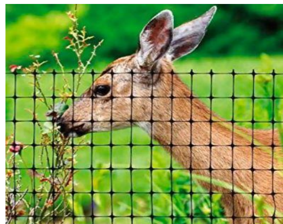
Slika 13. Ograda od plastične mreže (izvor: https://mcveighparker.com/plastic-deer-fence , pristupljeno 19.08.2024.)