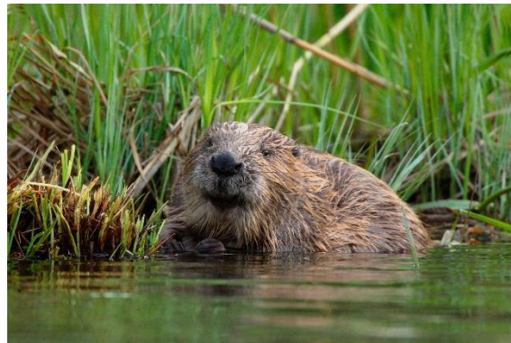
Slika 8. Europski dabar (Niemi, 2016.)

Europski dabar, najveći glodavac sjeverne polutke, je semiakvatična životinjska vrsta jer živi i u vodi i na kopnu. Zaštićena je vrsta. Zbog svoje zdepaste i masivne građe je odličan plivač i ronilac. Naraste do jednog metra dužine, dok mu dužina repa može biti od 30 do 40 centimetara. Cijelo tijelo mu je prekriveno smeđom dlakom, a rep mu je ljuskav. Repom lupaju po površini vode kada osjete opasnost. Između nožnih prstiju ima plivaću kožicu, a snažni nokti na prednjim nogama im služe za kopanje zemlje, pridržavanje i nošenje drveća. Ima vrlo specifične glodnjake, odnosno sjekutiće koji mu neprestano rastu te ih mora trošiti kako mu ne bi bili preveliki. Zbog te specifične građe zubala, može podgristi i urušiti stablo što ne može niti jedna druga životinjska vrsta. Sveukupno ima 20 zuba, zubne formule I 1/0, P 1/3, M 1/3 (Osmak, 2017). Prema načinu prehrane je biljojed te hranu pronalazi u blizini svoje nastambe. Tijekom vegetacijskog razdoblja se hrani zeljastim biljem, korištenjem te mladim izbojcima i lišćem mekih listača, a zimi hranu nalazi u mladoj kori uglavnom mekih listača (Margaletić i dr., 2007).