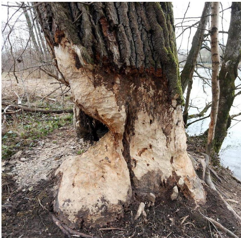
Slika 9. Šteta od europskog dabra (Stedul-Fabac, 2023.)

Neke specifične mjere zaštite stabala od dabrova ne postoje. Čim se pojave prvi znakovi nagrivanja stabala, potrebno ih je zaštititi kako ih ne bi još više uništili. Najbolja i najdjelotvornija zaštita je ograđivanje žičanom ogradom svakog stabla posebno (Osmak, 2017).