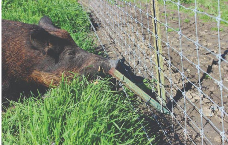
Slika 14. Ograda od žičane mreže

Najčešća ograda koja se koristi za zaštitu od divljači je ograda od žičane mreže. Iako bi se trebalo izbjegavati korištenje armaturnih mreža za podizanje ograda, one se i dalje često koriste prvenstveno zbog cijene i jednostavnosti. Na armaturne mreže se divljač ozljeđuje prilikom preskakanja te se zato iznad najgornje žice treba postaviti tri reda trake koja će spriječiti ozljeđivanje. Kao skuplja metoda zaštite divljači od ozljede je sadnja bršljana na žicu i reda drveća ispred žice kako bi ograda bila što uočljivija. Također, ogradu se treba dobro i ukopati kako ne bi došlo do potkopavanja ograde što je karakteristično za divlje svinje i predatore (Rajković, 2018).