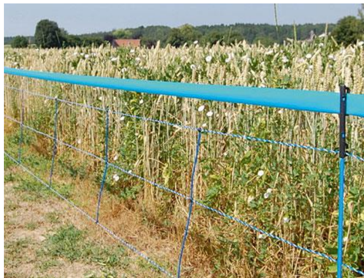
Slika 15. Električna ograda

Najučinkovitija ograda koja se koristi za zaštitu od divljači u poljoprivredi je električna ograda. Razmak između impulsa i jačina udara za zastrašivanje određeni su europskom normom EN61011, s ciljem zaštite životinja i čovjeka. Ograda se ne smije postavljati izravno do nasada ili površine koju želimo zaštititi te ju je bitno održavati kako bi se osigurala njena učinkovitost (uklanjanje korovske vegetacije). Treba ostaviti čistinu ispred ograde kako bi divljač vidjela ogradu te da ne naleti na nju i ošteti ju. Postoji nekoliko vrsta električnih ograda. Privremene električne ograde se postavljaju najčešće na manjim površinama, jednostavno se postavljaju i uklanjaju. Električna ograda s mirisnim mamcem ima svrhu privlačenja divljači pri čemu divljač dodiruje žicu pod naponom, prima strujni udar te navodi divljač, kao i kod ostalih električnih ograda, na izbjegavanje ograda. Dvostruka električna ograda je karakteristična za zaštitu rasadnika i manjih površina (do 1,5 hektara), a divljač odbija strujnim udarom i trodimenzionalnim izgledom ograde. Kosa električna ograda se postavlja se na srednje velikim do velikim površinama. Postavlja pod kutom od 30 stupnjeva u odnosu na tlo pri čemu se postiže trodimenzionalni efekt kao i kod dvostruke električne ograde. Nedostatak joj je glomaznost i troškovi održavanja (Rajković, 2018).