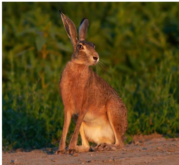
Slika 10. Zec obični (Kurilin, 2022.)

Prema kalendaru lovidbe za 2024. godinu (sukladno Pravilniku o lovostaju NN, 94/2019.), zec obični se lovi od 1. listopada do 15. siječnja.