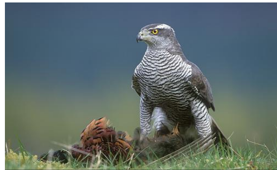
Slika 11. Jastreb ( Accipiter gentilis )

Jastreb je ptica iz podreda sokolovki ( Falcones ), porodica jastrebova ( Acciptridae ), koja obuhvaća 250 vrsta. Značajke porodice sastoje se u zbijenom tijelu, podužem vratu i prilično malenoj glavi, kratkim, zaobljenim krilima, dugačkom repu i visokim nogama s velikim ili malim kandžama. Glavni predstavnik porodice, jastreb kokošar ( Accipiter gentilis ) je velika snažna grabljivica, dugačka otprilike 50