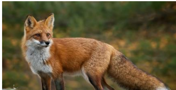
Slika 5. Lisica ( Vulpes vulpes L.)

Mušjak lisice je dužine negde oko 110 – 112 cm, a teži nešto blizu 11 kg. Za ženku stoji da je dugačka oko 108 cm, a teška oko 6 kg. Lisice su naročito dobro prilagođene za noćni lov i u većini slučajeva love potpuno same. Imaju nevjerovatno dobar vid kao i izuzetno razvijeno čulo sluha koje omogućava lisici da brzo uđe u trag svom