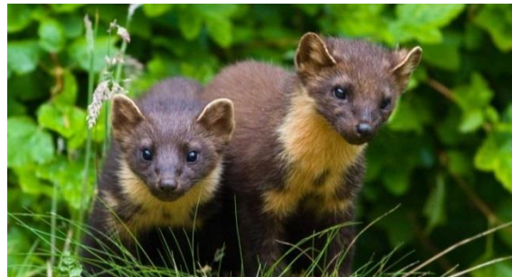
Slika 7. Kuna zlatica ( Martes martes )

Tijelo kune zlatice je dužine do 85 cm, od čega je samo rep 30-35 cm, a teži svega 1,5-1,8 kg. Dlaka joj je tamno-smeđe boje, njuška svijetlo smeđe, a sa strane i po trbuhu je žućkasta, dok je na nogama crno-smeđa. Ime je dobila po pjegi koja se nalazi na donjoj strani vrata, a koja je obraštena dlakom zlatno-žute boje. Pari se jednom godišnje, skotne su 260-305 dana.