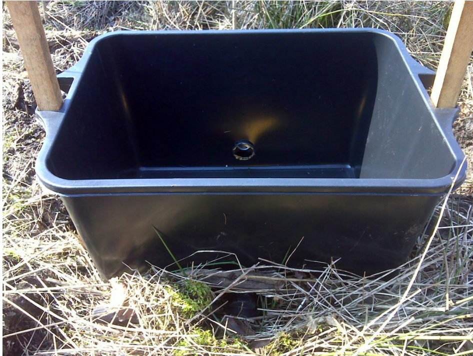
Slika 15. Lovna posuda