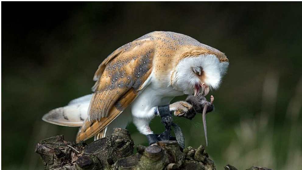
Slika 16. Prikaz kukuvije drijemavice ( Tyto alba ) u lovu na voluharice

Plantaže šećerne trske u Floridi ugrožene su od strane pet vrsta štakora te dvije vrste miševa koje potencijalno mogu uzrokovati više od 30 milijuna dolara gubitaka na usjevima godišnje. 1994. godine, Sveučilište u Floridi pokrenulo je program upotrebe kukuvije drijemavice ( Tyto alba ) kao održivi način kontrole od glodavaca. Kukuvije drijemavice su jedan od najvećih prirodnih predatora sitnih glodavaca. Samo jedan par godišnje ulovi više od 1000 jedinki. Brojnost izvorne populacije u južnoj Floridi je ispod optimuma jer nedostaje mjesta za gniježđenje. Program povećanja prirodne populacije kukuvije drijemavice se zasniva na postavljanju umjetnih gnijezda na poljoprivrednoj površini od 200 000 ha u Evergladesu. 3-4 mjeseca nakon postavljanja umjetnih gnijezda zabilježen je dramatičan porast populacije kukuvije drijemavice. Sa više od 500 kutija, ovo poljoprivredno područje je jedno od onih sa najvećom gustoćom naseljenosti kukuvije drijemavice (približno 0,3 kukuvija drijemavica /km 2 ). Štete od sitnih glodavaca su značajno smanjene. Neki od uzgajivača šećerne trske potpuno su eliminirali rodenticide kao sredstvo zaštite od glodavaca. Zahvaljujući velikom uspjehu, ovaj program se intenzivno koristi u obrazovanju mladeži jer se iz njega može povući zaključak kako poljoprivreda i divlje životinje ne mogu samo koegzistirati, već i imati koristi jedno od drugog.