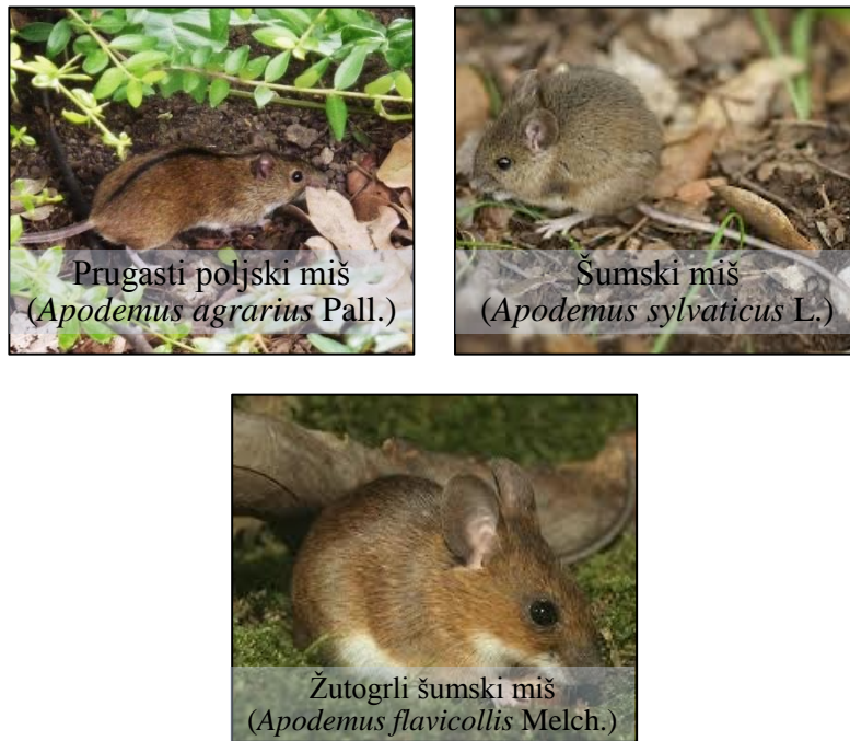
Slika 1. Vrste iz potporodice Murinae koje dolaze u šumama kontinentalne Hrvatske