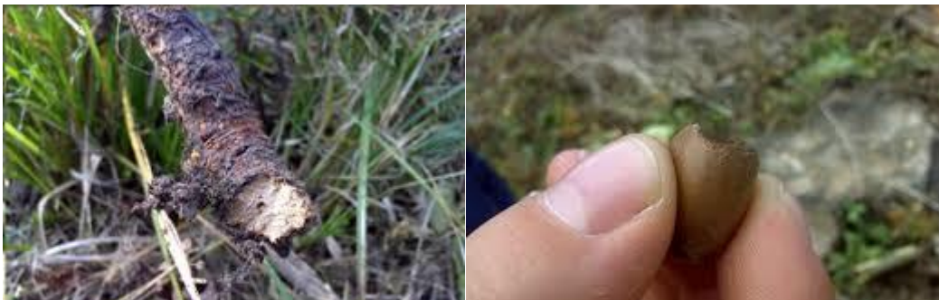
Slika 3. Štete od sitnih glodavaca

tanina (Androić i dr. 1981). U tom smislu su najznačajniji štetnici vrste Apodemus sylvaticus i A. flavicollis (Spaić i Glavaš 1988.) Glodanje kore i korijenja mladih biljaka, kopanje dugih hodnika pod zemljom te time potkapanjem površina obraslih pomlatkom ili kulturama drvenastih vrsta, specifično je za vrste poput Microtus agrestis , M. arvalis i sl. Mlade biljke potpuno pregrizu, a nešto starije prstenuju ili ih jače oglođu sa strane. Najčešće glođu koru mladih biljaka starosti 2-15god. Razlikuju se štete od miševa i voluharica, pa tako miševi čine više štete na sjemenu šumskog drveća, dok voluharice predstavljaju opasnost od nastanka oštećenja na kori i korijenju.