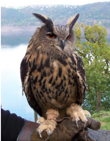
Slika 12. Sova ušara ( Bubo bubo

prilagodbama koje im pomažu u noćnom lovu. Oči su im velike jer sabiru svo raspoloživo svjetlo, a položene su naprijed, što im pomaže u prosuđivanju razdaljine. Imaju oštar sluh, a meko perje omogućuje im nečujan let. U svijetu poznajemo oko 205 vrsta. Najbrojnije vrste sova u Hrvatskoj su: ćuk, sivi ćuk, kukuvija, ušara, mala ušara, sova močvarica, šumska sova, jastrebača, ćuk batoglavac, velika sova. Šumska sova i sova ušara najbrojnije su i najrasprostranjenije.