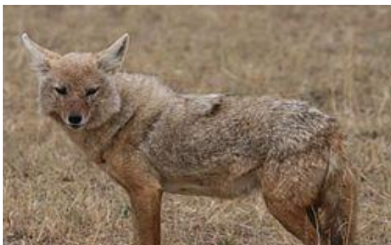
Slika 4. Zlatni čagalj ( Canis Aureus L.)

Zlatni čagalj je u srodstvu s vukom tj. psom. Dug je između 80 i 95 cm. Dužina repa iznosi 20 - 30 cm. Visine je 35 - 50 cm, težak je 8 - 10 kg. Boja krzna je žuto zlatna, po njoj mu je nadjenuto i ime. Zlatni čagalj je tipičan trkač, nije težak, ima duge i snažne noge. Žive u društvu ili u