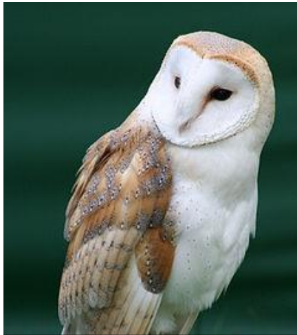
Slika 13. Kukuvija drijemavica ( Tyto alba )