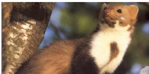
Slika 8. Kuna bjelica ( Martes foina L.)

Kuna bjelica je dugačka otprilike 75 cm, od čega je samo rep dugačak 25 cm. Visoka je do 25 cm, a može dosegnuti težinu do 1,8 kg. Tijelo joj je prekriveno dlakom koja je sivo-smeđe boje, a po trbuhu je svjetlija. Bjelica se pari u srpnju i kolovozu, skotne su 247-280 dana. U travnju ili svibnju okoti se 3-5 (rijetko 7) mladunaca, koji su