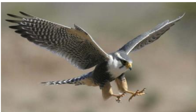
Slika 10. Sivi sokol ( Falco peregrinus )

Sve grabljivice mogu odjednom vrlo mnogo pojesti, ali isto tako mogu i vrlo dugo gladovati. Grabljivice obuhvaćaju dva reda, dnevne i noćne grabljivice, sokolovke ( Falconiformes ) i sove ( Strigiformes ). Sokolovke su red snažnih ptica danjih grabljivica s približno 220 vrsta. Međusobno su slične, osobito po oštrou kukastom kljunu, oštrim i