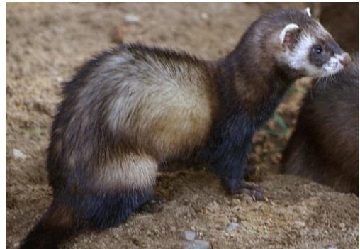
Slika 9. Tvor ( Mustela putorius L.)

Tijelo mu je vitko i izduženo, noge male, ali neovisno o tome, u stanju je brzo se kretati. Naraste 38-45 cm, a rep mu je dugačak oko 15 cm. Krzno mu je tamno smeđe boje, a na trbuhu crne boje. Po glavi ima žućkaste dijelove. Imaju izvrsno razvijen njuh i sluh, vide dosta slabo. Voli se hraniti miševima, voluharicama, štakorima, krticama, žabama, gmazovima, ribama, kukcima, puževima, gujevicama i plodovima. Lovi ptice i ptičja jaja. Njegova osobnost i karakter su takvi da ubije više životinja nego što može pojesti.