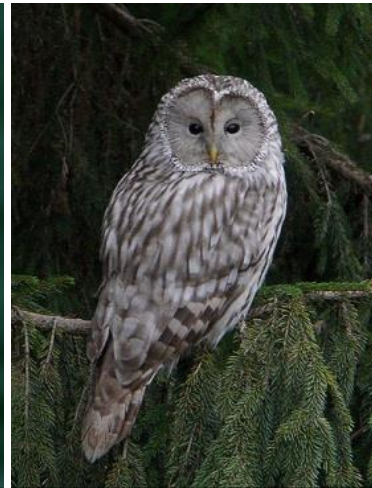
Slika 14. Sova jastrebača ( Strix uralensis )