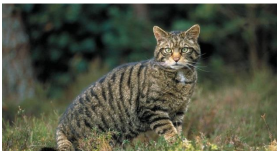
Slika 6. Divlja mačka ( Felis silvestris Schr.)

To je snažna životinja okrugle glave sa kratkom njuškom i kratkim ušima. U snažnoj vilici ističu se oštri očnjaci. Tijelo joj je pokriveno gustom dlakom sivo-smeđe boje s rijetkim, poprečnim tamnim prugama. Kraći, debeo rep ima tamne prstenove i vrh je uvijek tamno obojen. Na prstima ima oštre kandže koje se uvlače. Grudi i trbuh su svjetliji i jednolično