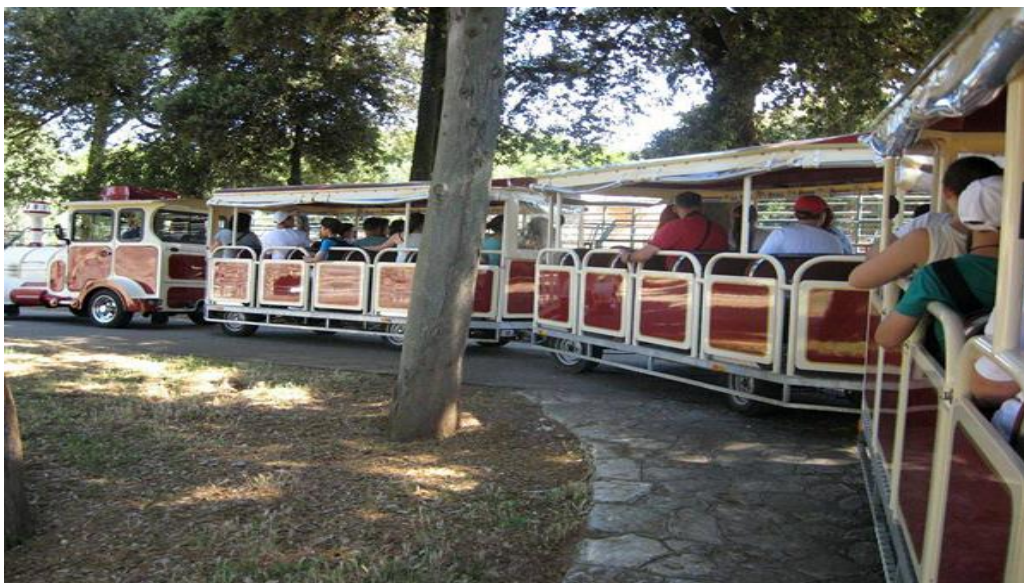
Slika 19. Razgledavanje safari parka iz vlakića

koje su na taj način tretirane postepeno se suše zbog nemogućnosti kontinuiranog protoka hranjivih tvari iz lišća i mineralnih tvari i vode iz korijena. Mlade biljke najučinkovitije je izvući iz zemlje s čitavim korijenom. Pajasen je prisutan na relativno maloj površini otoka Veliki Brijun, no očekuje se da će uklanjanje trajati nekoliko godina, ali najvažnije je da se ova vrsta lokalizira i da se spriječi njeno daljnje širenje.