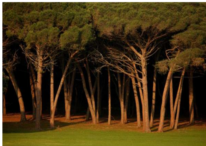
Slika 18. Šume hrasta crnike bez sloja grmlja, bez sloja niskog rašća i donjeg dijela krošnje

tetivika, skrobut, sparožina, božje drvice i mediteranska divlja ruža. To su najljepše šume crnike u našoj zemlji i planiraju se zaštititi kao strogi rezervat prirode. Cijelo ovo područje je ograđeno i nije pod utjecajem visoke divljači. Šume crnike s lovorom najzastupljenije su na istočnom dijelu Velog Brijuna. Nigdje na hrvatskoj obali nema ovako cjelovitih prostora s mješovitim sastojinama crnike i lovora, što je jedna od bitnih zanimljivosti Brijuna. Makiju (degradiranu šumu crnike) nalazimo na svim otocima; a na manjim otocima (Mali Brijun, Pusti, Krasnica) je kompletna (sa svim već navedenim šumskim vrstama: crni jasen, zelenika, mirta, planika i dr.), a na Velom Brijunu je djelomično izmijenjena zbog utjecaja divljači (izostaju povijuše i prizemno rašće). Česminovi hrastici i makija, osobito na Velikom Brijunu, su netipični zbog dosadašnje izloženosti cjelogodišnjoj prekomjernoj ispaši od visoke divljači, te su šume ostale bez sloja grmlja, bez sloja niskog rašća i bez donjeg dijela krošnje. Stoga se one doimaju kao da su "podrezanih" krošnji s pomalo zastrašujućim tamnim prostorom između tla i krošnji drveća. Zbog nemogućnosti prirodnog obnavljanja, tim šumskim sastojinama predstoji izumiranje. Stoga je nužno hitno smanjenje broja visoke divljači (na samo nekoliko statina primjeraka) u cilju očuvanja šumskog pokrova V. Brijuna. Pašnjačka vegetacija razvijala se pod utjecajem velikog broja divljači (intenzivna ispaša) i nije do sada detaljnije istraživana.