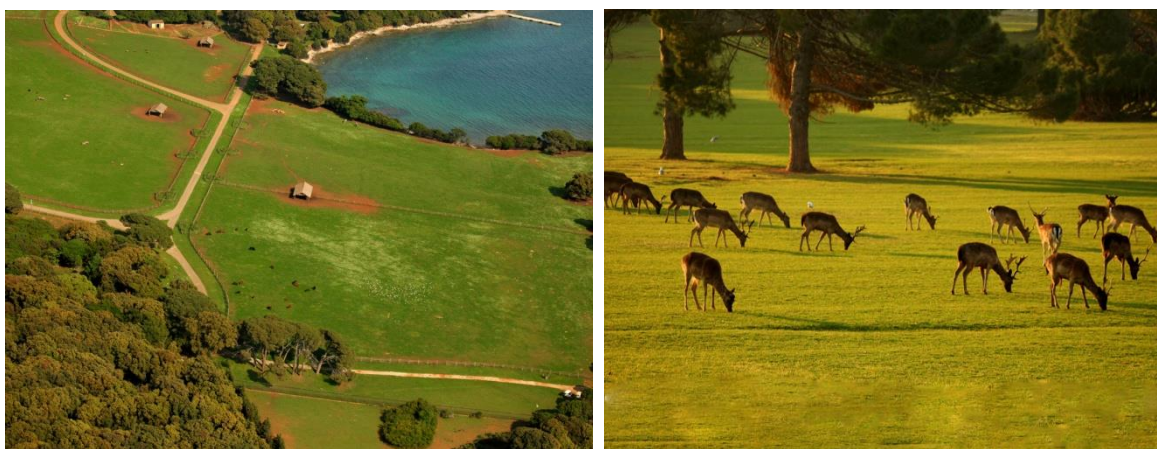
Slika 17. Prva slika prikazuje travnjak karakterističan za NP Brijuni, druga slika prikazuje životinje u slobodnoj prirodi na Brijunima

Razvedena obala, raznolika podloga (čvrsto stjenovito dno s polušpiljama i žljebovima, šljunak, pijesak, mulj) i batimetrijska konfiguracija, s dubinama do 50 m, omogućuju i uvjetuju veliku raznolikost litoralnih životnih zajednica. Riblje populacije impresioniraju gustoćom i reprezentativnom veličinom pojedinih primjeraka. Neke zone brijunskog akvatorija namijenjene su isključivo znanstvenim istraživanjima. Budući da je fauna otočnog dijela znatno izmijenjena, uključivanje mora u granice Parka bilo je nužno s obzirom na međunarodne i hrvatske kriterije za nacionalne parkove. A to znači da se na toj površini, višestruko većoj od otočne, isključuje svaki ribolov i bilo kakvo iskorištavanje podmorja. Za ribarstvo to nije izgubljena površina jer će more oko Nacionalnog parka Brijuni time postati bogatije, ali unatoč tomu bilježimo nedopušten ribolov. Na sjevernom rubu Velikog Brijuna, u velikome i zajedničkom ograđenom prostoru, formiran je 1978.g. safari-park čiji su stanovnici egzotični biljožderi: slonovi, antilope, somalijske ovce, deve, ljame i dr. Noviji stanovnici safari-parka autohtone su pasmine domaćih životinja (istarsko govedo, istarska ovca i istarski magarac). Zabilježeno je i prirodno naseljavanje lopatara na kopnu južne Istre, preko primjeraka koji su preplivali Fažanski kanal. Uzgoj divljači na Brijunima u problemima je zbog ljetnih suša i prirodno siromašnog podrasta eumediteranske šume.