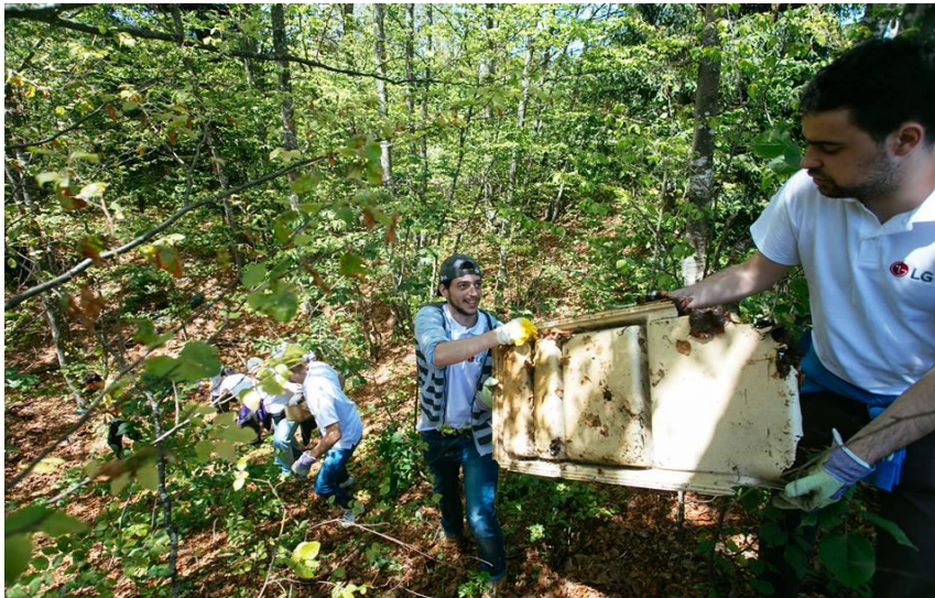
Slika 2. Volonterska akcija čišćenja divljih odlagališta otpada na dvjema lokacijama unutar Nacionalnog parka Plitvička jezera, Prijeboju i Jezercu

U ovom nacionalnom parku nadziru se dvije slike; Prva prikazuje tisuće turista oboružanih kamerama i fotoaparatom, šeširima i suncobranima, oni se dive ljepoti našeg najvećeg i najstarijeg nacionalnog parka. Druga slika prikazuje rubni dio toga zaštićenog područja, nedaleko od ceste prema ličkom Petrovom selu, gdje sve stoji u posve drugačijem okružju, ograđeno žičanom ogradom. Umjesto kristalno čiste vode i sedre, tu se prostiru gomile otpada: raznobojne plastične vrećice, ambalaža i drugi odbačeni proizvodi civilizacije. Posjetitelja nema- samo nekolicina žitelja koji su došli kamionom u potrazi za plastičnim bocama. "To je rak rana ovoj prirodi" kaže nadzornik. Stvorena je u proteklih 30-ak godina, tijekom kojih je to bilo odlagalište otpada nacionalnog parka, te naselja i hotela unutar njegovih granica. Odlagalište otpada unutar granica parka velika je opasnost za medvjede, Rupe u ogradi napravile su te snažne životinje, koje su navikle jesti smeće i naučile su se na miris ljudi, a to dovodi do novih problema, jer životinje prestanu izbjegavati ljude. Takvi problematici medvjedi katkad budu ustrijeljeni, čak i ako se to dogodi unutar jednog nacionalnog parka. Zbog medvjeda i opasnosti od požara, nacionalni park je 2005. godine službeno zatvorio odlagalište.