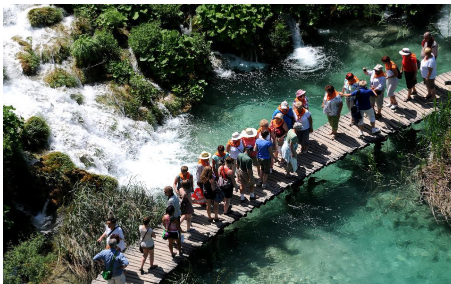
Slika 3. Plitvička jezera po ljeti bilježe milijunske posjete.

jednadžbu problema ubrajaju se i turisti, kojih je sve više. Ljeti Kozjačka draga više nalikuje trgovačkom centru u vrijeme rasprodaja nego iskonskoj divljini. Ispred električnih brodova koji posjetitelje odvoze u druge dijelove parka, vijuga red od nekoliko stotina ljudi, a niz cestu koja vodi prema pristaništu spušta ih se još toliko. Park ne investira dovoljno u lokalne zajednice (lokalne agencije i turističke zajednice nisu uključene u marketing Parka), potreban je novi prostorni plan kako bi stanovnici Parka mogli širiti svoje turističke kapacitete. Trenutačno Plitvička jezera ne nude raznoliku turističku ponudu, a posjetitelji ne mogu ni doći do informacija o alternativnim ponudama, koje bi trebale biti lako dostupne svima. Svejedno su Plitvička jezera naš nacionalni park sa najviše posjeta- u sezoni ih dnevno bude i više od 10.000, a ima ih sigurno i 100 kojima karta ispadne u vodu, 10 kojima kamera ispadne u vodu, masa stvari narušava prirodnu ravnotežu. Mostići, staze, vibracije ljudi, sve to djeluje na poroznu i mekanu sedru, te radi toga bi trebalo biti više nadzornika. Situacija u parku danas je da nekolicina nadzornika ne može biti prisutna na cijelom prostoru stalno, mnogi od njih imaju nedostatak znanja stranih jezika i interpretacijskih vještina.