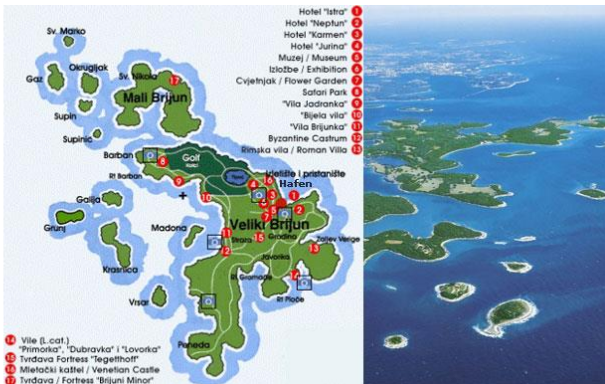
Slika 16. Karta i prikaz NP Brijuni iz zraka

Duž zapadnoistarske obale nekoliko je skupina manjih otoka. Najzanimljivija i najrazvedenija među njima svakako je skupina 14 Brijunskih otoka sjeverozapadno od Pule. Njihova ukupna površina je 7,3 km 2 . Najveći dio te površine (oko tri četvrtine) pripada samo jednom otoku- Velikom Brijunu. Granice Nacionalnog parka obuhvatile su i okolno more, tako da je njegova ukupna površina 36, 3 km 2 . Nacionalnim parkom proglašen je 1983.g., prvenstveno iz razloga da se osigura teritorijalna vlast Republike Hrvatske i očuva memorijalno nasljeđe otočja. Brijuni su jedini nacionalni park koji je u potpunosti u državnom vlasništvu, mnogi misle da je proglašen nacionalnim parkom zbog utjecaja politike (ljetna rezidencija predsjednika Jugoslavije, Josipa Broza Tita). No ipak ovaj park je zaštićen zbog bogatog podmorja i šuma hrasta crnike. Na Velikom Brijunu ostvaren je izniman sklad prirodnih i antropogenih elemenata u cjelokupnoj pejzažnoj slici. Zauzimanjem nekadašnjih poljoprivrednih, te krčenjem dijela šumskih površina i njihovim pretvaranjem u pejzažne parkove s prostranim otvorenim travnjacima stvoren je osobit krajolik, sasvim neuobičajen na Jadranu.