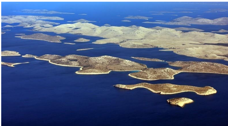
Slika 15. Nacionalni park Kornati iz zraka

S obzirom na specifičnost prostora Nacionalnog parka Kornati (udaljenost od obale, dominacija morskog ekosustava, veličina parka), rad Javne ustanove je znatno složeniji i skuplji u odnosu na rad ostalih ustanova koje upravljaju nacionalnim parkovima i parkovima prirode u Hrvatskoj. Iz istih razloga je i nadzor otežan, kao i kontakt (komunikacija) s posjetiteljima i ostalim korisnicima ovoga prostora. Radi bolje primjene načela dobre prakse u zaštiti prirode, u narednih deset godina se planira pojačati suradnja Javne ustanove s drugim organizacijama (domaćim i stranim) koje se bave zaštitom prirode. Djelatnici parka će stalno raditi na unaprijeđenju svojih znanja i vještina, a poboljšavat će se i sva oprema i materijalno-tehnička sredstva potrebna za nesmetan i učinkovit rad Javne ustanove. Potaknut će se postupci za poboljšanje legislative, a otpad će se stalno uklanjati iz područja parka.