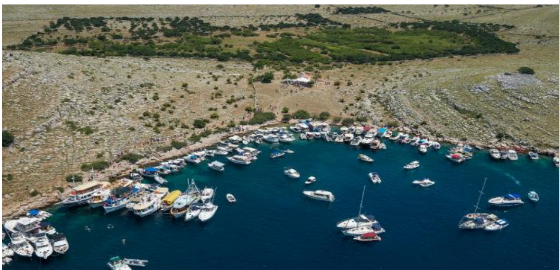
Slika 13. Prve nedjelje u srpnju tradicionalno se održava procesija brodovima prema Tarcu, uvali na otoku Kornatu.