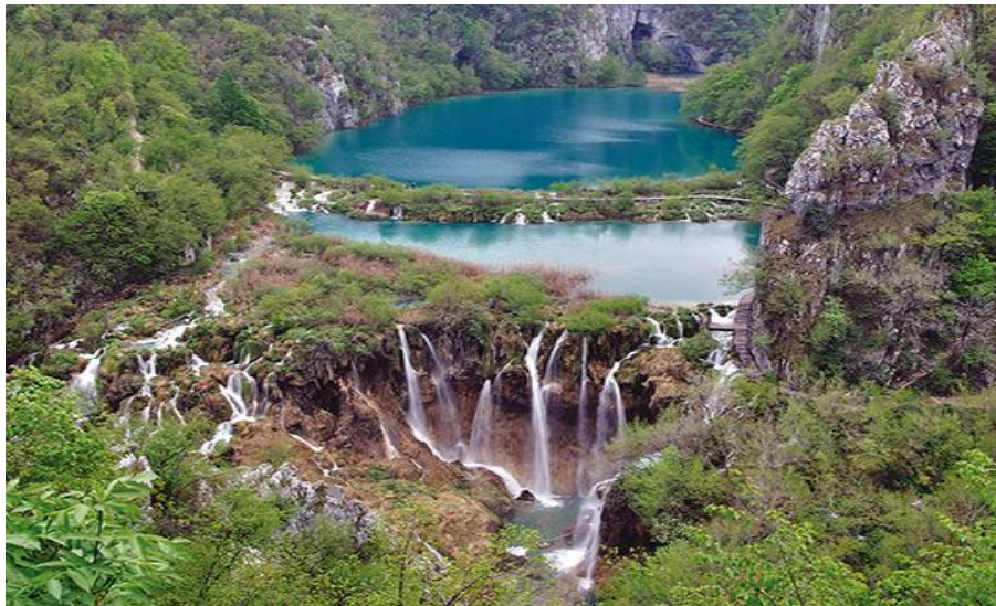
Slika 1. Posljednja u nizu jezera; Kaluđerovac i Novakovića brod

Inicijativa za proglašenje Plitvičkih jezera nacionalnim parkom postojala je već 1914.godine, a ideja o gradnji hidroelektrana na slapovima je odbačena. Između dva rata sazrijevaju spoznaje o znanstvenoj i edukacijskoj vrijednosti Plitvica, te se spoznalo da je to vrlo osjetljiv prirodni fenomen u kojemu svaki nepromišljeni zahvat i djelatnost mogu dovesti do degradacije, i naposljetku do kobnih posljedica. Zajedno s još nekoliko vrijednih područja Hrvatske, Plitvice su 1928.g. proglašene Nacionalnim parkom, ali neadekvatnim zakonom čiju je valjanost trebalo produživati, što nije učinjeno, pa je do stvarnoga i trajnog društvenog opredjeljenja za Park došlo tek 1949.godine. Trideset godina kasnije, 1979.g., UNESCO je Plitvička jezera uvrstio u Listu svjetske prirodne baštine, čime je i u svjetskim kulturološkim razmjerima potvrđeno značenje toga nacionalnog parka. Najveća je vrijednost NP Plitvička jezera specifičan hidroekološki sustav, zahvaljujući kojemu se stvaraju sedrene barijere tvoreći niz slapova i jezera iznimne ljepote, okruženih bujnom šumskom vegetacijom.