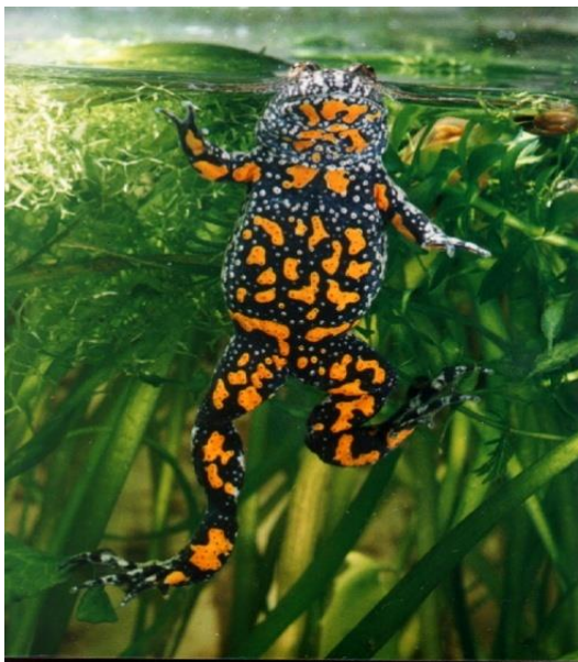
Slika 5. Crveni mukač Bombina orientalis