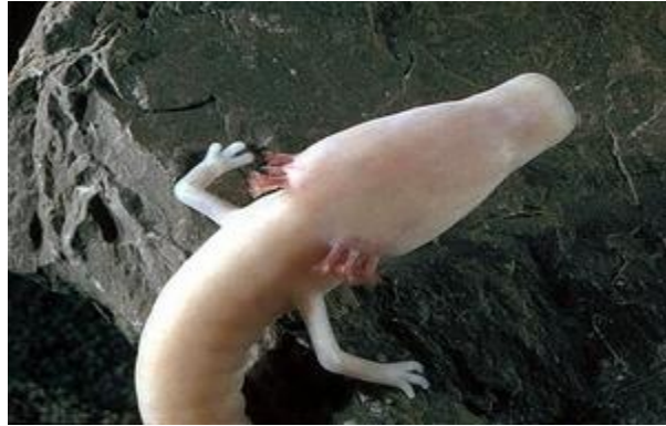
Slika 2. Glava čovječje ribice s vanjskim škragama

Proteus anguinus Laurenti, 1768 Engleski naziv: Olm Sinonimi: Siren anguina (Shaw,1802.), Hypochthton carrarae Fitzinger, 1850 Razred: Amphibia, vodozemci, amphibians Red: Caudata, repati vodozemci, salamanders and newts Porodica: Proteidae, glavašice, olms Globalna kategorija ugroženosti: VU B2ab(ii,iii,v) Europska kategorija ugroženosti: VU B2ab(ii,iii,v) Mediteranska kategorija ugroženosti: VU Nacionalna kategorija ugroženosti: ugrožena svojta, EN B2ab(ii,iii,iv,v)