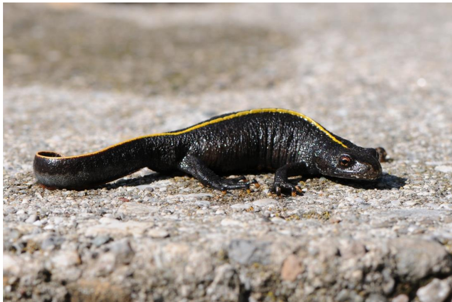
Slika 6. Veliki vodenjak