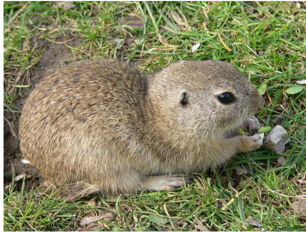
Slika 5. Tekunica na livadi

s jakim kandžama, prilagođene za brzo kopanje. Dlaka na tijelu joj je rijetka i dosta gruba, smeđesive boje, bez pjega ili s manje malo pjega, a s donje strane je svjetlija. (Oštrec, 1998.)