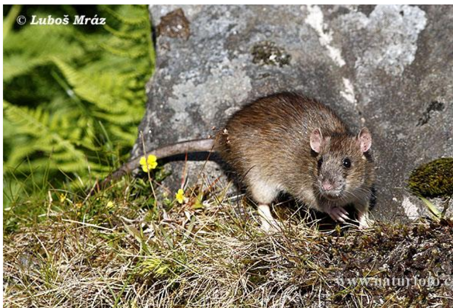
Slika 22. Štakor selac u kretanju prirodom

Sivi štakor ili štakor selac glodavac je koji spada u podporodicu Murinae . Karakteristično je za ovu vrstu da se često seli i gdje god se pojavi potisne crnog štakora. Ljeti se pojedinačno zadržava u vrtovima na kompostu, u živicama i na poljima. Čini štetu na svim žitaricama od sjetve do uskladištenja sjemena. Legla radi u zemlji gdje i iskopava hodnike, koji mu služe za zaštitu i za spremanje hrane. Legla također pravi i u skladištima, u kućama, između vreća ili u samom zrnju. U jesen se obično povlači u zatvorene prostore i najčešće se zadržava u donjim prostorijama zgrada, u vlažnim podrumima, hodnicima i kanalizaciji. Ždere sve što može, a njegovu prisutnost lako je prepoznati po izmetu, nagrizenim vrećama, rasutoj zrnatoj hrani i po rupama. Odrasli štakor dug je 19 do 26 cm, rep je kraći od duljine tijela od 16 do 20 cm. Gornji dio tijela obično je smeđ, a donji sivkastobijeli. Ženka leže od 2 do 20 mladih, koje koti 3 do 8 puta godišnje. Ova vrsta pripada ujedno među najopreznije, najlukavije, ali i najnepovjerljivije životinje. Izbjegava dodir sa čovjekom, kojeg osjeća po mirisu. Dokazano je da osjeti miris čovjeka na mamku, pa ga izbjegava (Oštrec, 1998.).