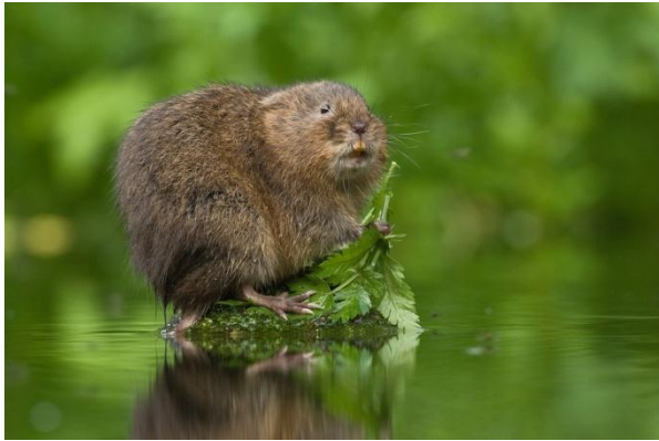
Slika 10. Vodeni voluhar u prirodnom okruženju