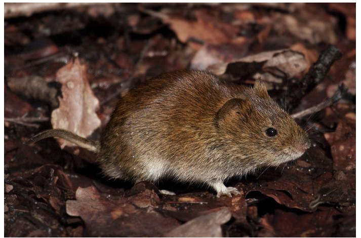
Slika 12. Šumska voluharica u izlasku iz jame Slika 13. Šumska voluharica na listincu