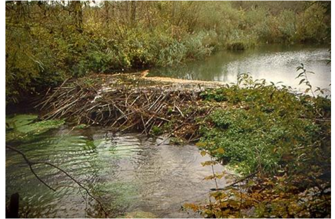
Slika 7. Nastamba dabra na riječnom toku