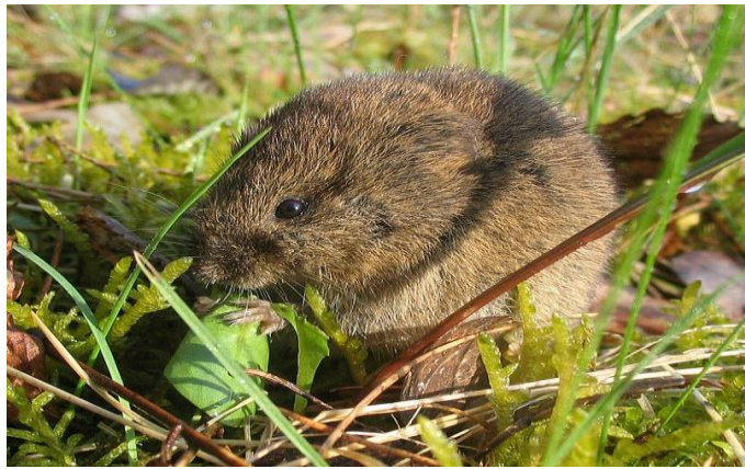
Slika 16. Poljska voluharica za vrijeme hranjenja