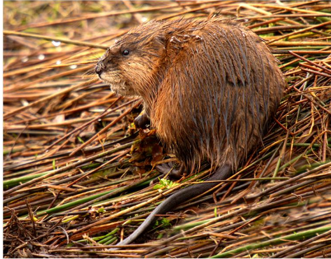
Slika 18. Bizamski štakor prilikom izlaska iz vode