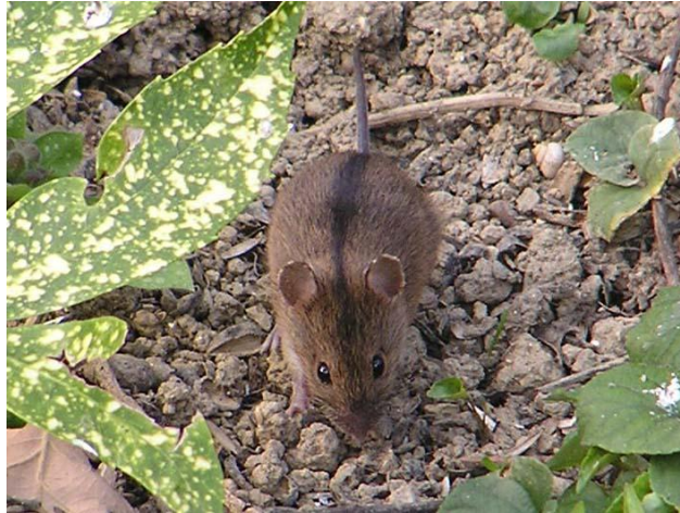
Slika 19. Prugasti poljski miš u potrazi za hranom