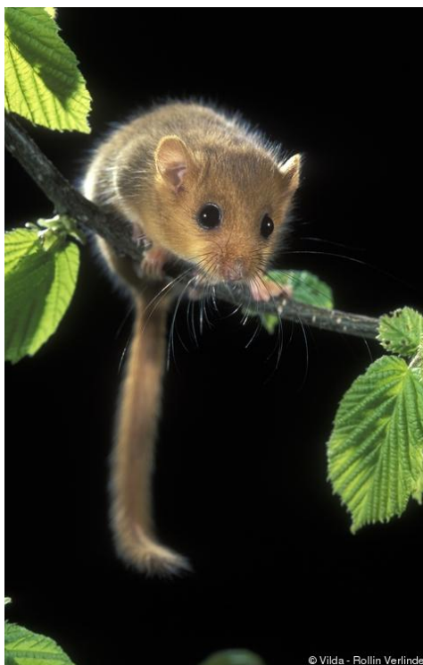
Slika 9. Puh orašar u noćnom kretanju