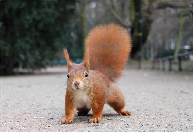
Slika 3. Odrasla jedina obične vjeverica