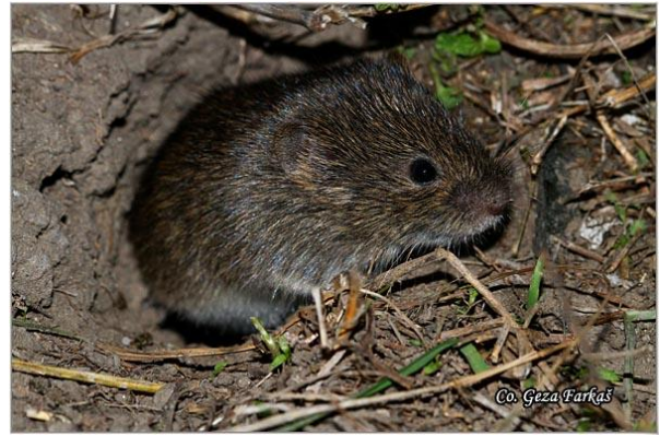
Slika 11. Izlazak iz podzemnog hodnika