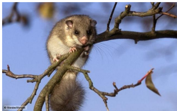
Slika 1. Sivi puh u prirodnom okruženju