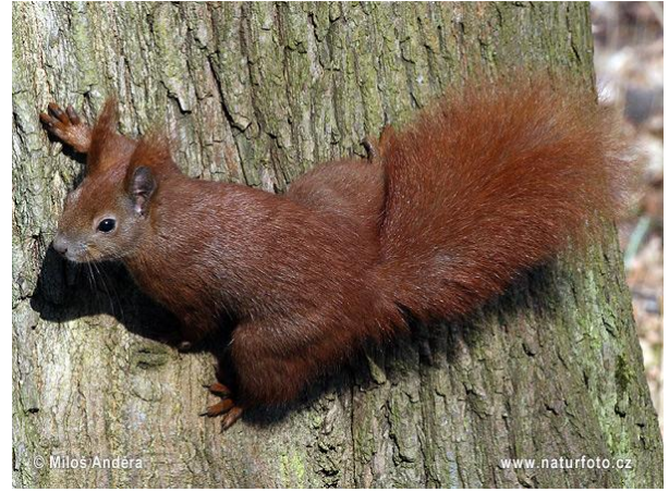
Slika 4. Obična vjeverica u prirodnom okruženju