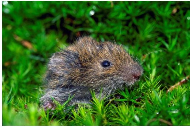
Slika 14. Livadna voluharica prilikom izlaska iz podzemnog hodnika