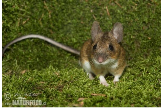
Slika 20. Žutogrli miš u kretanju prirodom