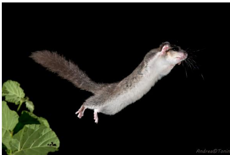
Slika 8. Sivi puh prilikom noćnog skoka