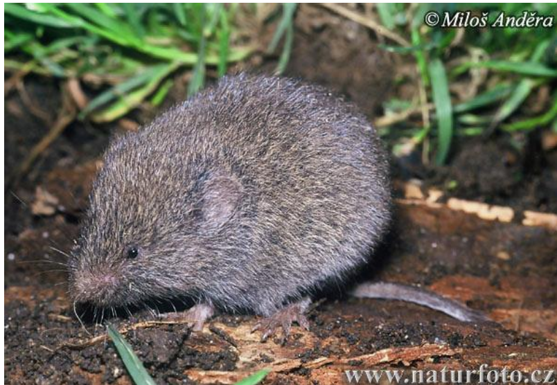
Slika 17. Podzemni voluharić u prirodnom okruženju