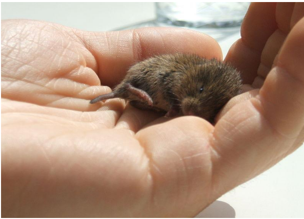
Slika 15. Poljska voluharica u ljudskoj šaci