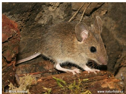
Slika 21. Šumski miš

Mali šumski miš još je jedan koji pripada podporodici Murinae . Naseljava pretežno šumske biotope tj. obitava po otvorenim i toplim staništima rubova šuma. Također zalazi u voćnjake, vrtove, na polja, pa čak i u kuće. U našoj zemlji čest je u bukovim šumama, gdje ujedno radi i nastambe u različitim šupljinama u drveću ili starim panjevima, dok u poljima kopa rupe sa 2 do 3 ulaza u kojima se obično nalazi jedno ili dva legla te spremište hrane. Hrani se sjemenjem različitih vrsta drveća (žir, bukvića), ali su mu glavna hrana sjemenke trava i drugog zeljastog bilja. Kao predator uništava kokone smeđe i obične borove ose pilarice. U godinama prenamnoženja može kompletno uništiti sjeme i time ugroziti prirodno pomlađivanje listopadnih šuma. Također uzrokuje štete i u rasadnicima i šumskim kulturama, jer nagriza oštećenu koru, korijen i pupove mladih drvenastih biljaka (bukva, hrast, grab, jasen i dr.), kao i na ratarskim kulturama koje se nalaze u blizini šuma. Tijelo šumskog miša veliko je 8 do 10 cm, dok je rep približno iste duljine od 7 do 10 cm. Krzno ovog glodavca je na leđima smeđe-sivo, a trbušna strana je sivobijele boje. Prednje su noge kraće, a stražnje dulje, što kod hodanja uzrokuje neprestano skakanje.