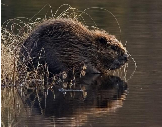
Slika 6. Europski dabar u prirodnom okruženju

dobrim plivačima i ronionicima. Zubi glodnjaci dugački su od 10 do 12 cm. Na obalama kopaju jazbine, dok na vodi pretežno od granja grade brane zbog regulacije vodostaja u nastambama koje su povezane podvodnim ulazima.