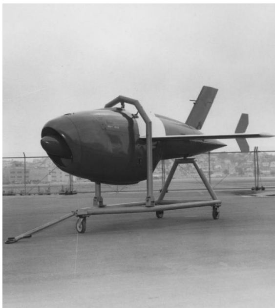
Slika 4: bespilotna letjelica "Firebee" 1950ih