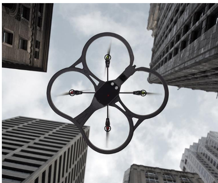
Slika 6: jedna od modernih bespilotnih letjelica "Parrot AR"

Unaprjeđenje tehnologije i robotike dovelo je do ubrzanog razvoja dronova za vojne, ali i civilne svrhe. U samim počecima su se koristili isključivo u vojne svrhe npr. traženje različitih meta, za bombardiranje i danas su bitan dio modernog ratovanja. Postoji i druga upotreba dronova koji su prilagođeni za civilnu upotrebu. Za prikupljanje informacija o klimatskim parametrima, geomapiranje, snimanje aerosnimaka itd. Za te svrhe model vojnih dronova je morao biti uvelike modificiran i pojednostavljen do te mjere da postoje dronovi malih veličina i težine, od svega par kilograma sve do nekoliko grama.