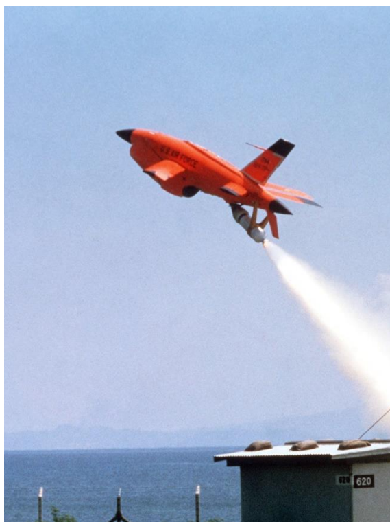
Slika 5: bespilotna letjelica "Firebee" danas

Unaprjeđenje tehnologije i robotike dovelo je do ubrzanog razvoja dronova za vojne, ali i civilne svrhe. U samim počecima su se koristili isključivo u vojne svrhe npr. traženje različitih meta, za bombardiranje i danas su bitan dio modernog ratovanja. Postoji i druga upotreba dronova koji su prilagođeni za civilnu upotrebu. Za prikupljanje informacija o klimatskim parametrima, geomapiranje, snimanje aerosnimaka itd. Za te svrhe model vojnih dronova je morao biti uvelike modificiran i pojednostavljen do te mjere da postoje dronovi malih veličina i težine, od svega par kilograma sve do nekoliko grama.