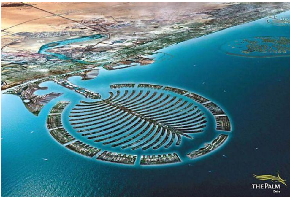
Slika 9. Otok Palm Deira iz zraka.