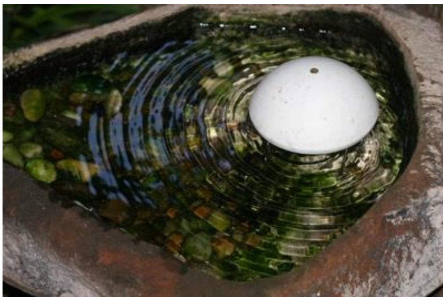
Slika 5. Primjer pojilišta za ptice.