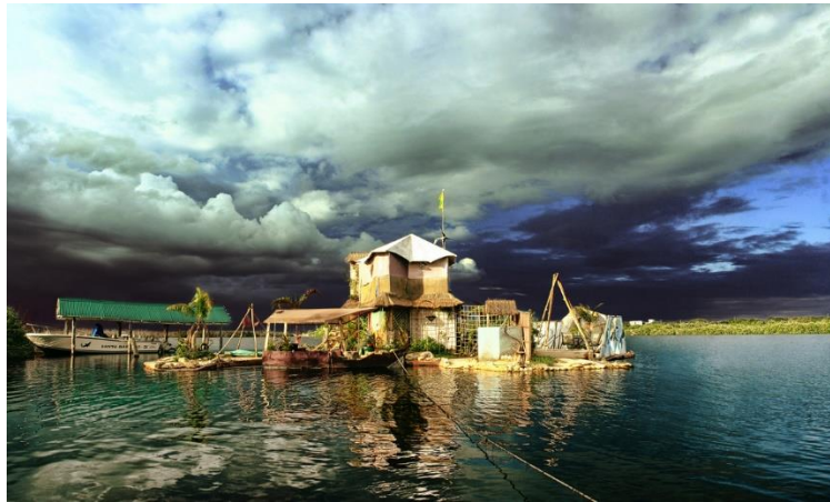
Slika 6. Spiralni otok Richarda Sowe.

Otok predstavlja jedinstveni eko projekt jer je u potpunosti izgrađen od materijala koji se mogu reciklirati, ali i pravi turističku atrakciju jer je otvoren za posjetitelje.