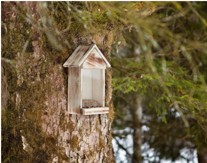
Slika 4. Primjer hranilišta za manje ptice.

Ovaj projekt omogućio bi prirodni prostor unutar parka koji bi pružao sigurnost za neometan život i razmnožavanje sve ugroženijih vrsta, a istodobno bi se njime i dalje mogli svakodnevno kretati ljudi iskorištavajući ga za razne aktivnosti i odmor od urbane užurbanosti.