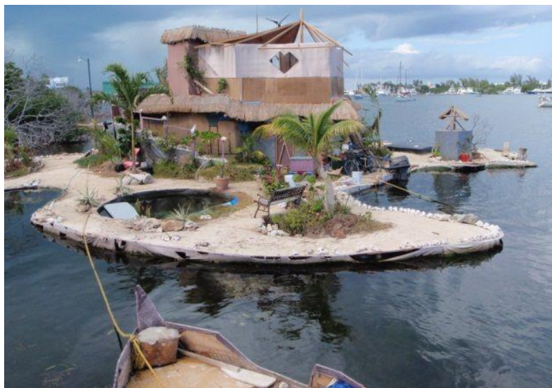
Slika 7. Kuća i jezero na otoku.