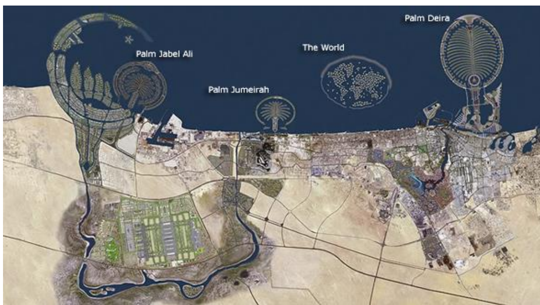
Slika 8. Projekt Palminih otoka.

Palm Deira , trebala je biti najveći otok, ukupne površine od 46,35 km 2 , gradnja je započela u rujnu 2004, ali se od nje odustalo zbog ekonomske krize.