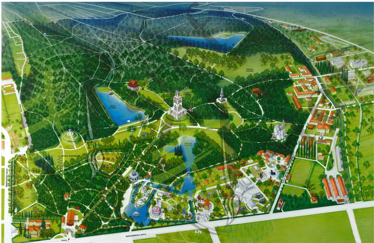
Slika 3. Položaj jezera u Parku Maksimir.

U parku Maksimiru je tijekom vremena formirano šest jezera od kojih danas postoje pet - prvo, drugo, treće, četvrto i peto. Godine 1839. izgrađeno je prvo jezero uz Maksimirsku ulicu, dvije godine kasnije drugo, zatim treće koje je danas isušeno četvrto jezero. Umjetno oblikovana jezera snabdijevaju se vodom iz potoka Bliznec koji direktno utječe u drugo i peto jezero.