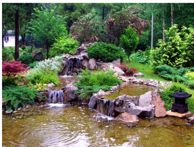
Slika 2. Primjer umjetne vodene površine.

Prvo i osnovno pravilo kod postavljanja umjetnih vodenih površina je pravilan odabir mjesta izrade, a to su u pravilu prirodne depresije. (Nevečerel, 2014.)