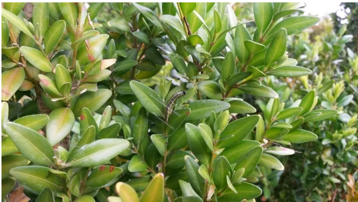
Slika 12. Odrasla gusjenica koja može obrstiti do 40 listova šimšira te napraviti katastrofalnu štetu.