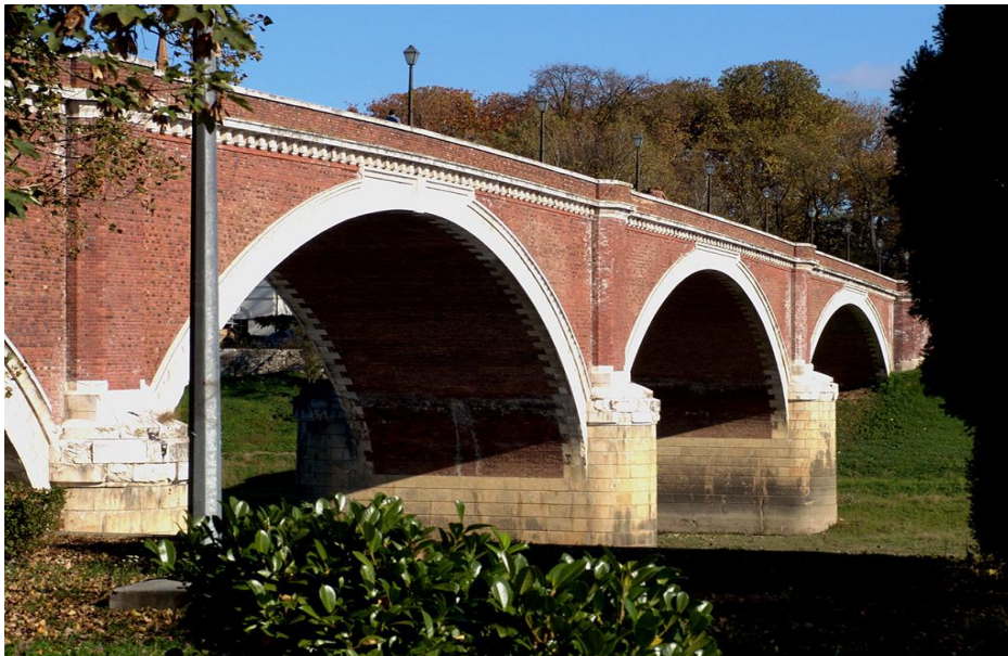
Slika 1. Stari most izgrađen 1934. godine - Simbol Siska

Godine 1874. ujedinjeni su Civilni i Vojni Sisak pod jedinstvenu upravu, a prvi gradonačelnik jedinstvenoga i otada slobodnog kraljevskog grada bio je ugledni trgovac Franjo Lovrić. Kroz 25 godina svoga gradonačelnikovanja postao je jedna od najmiljenijih osoba u gradu, a Sisak je od trgovačko-obrtničkog središta uspio dovesti do suvremenog izgleda i do kontura koje su u središtu grada i danas prepoznatljive. Krajem ovog razdoblja počinju se razvijati i gradski parkovi, od kojih je najstarije Šetalište Vladimira Nazora iz 1876., a slijedio ga je park na Trgu Ljudevita Posavskog iz 1885.