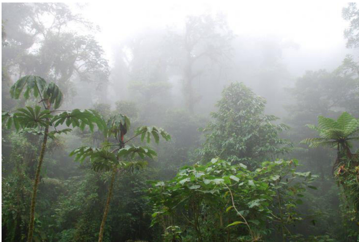
Slika 2 Hidrološka uloga šume na području Amazone dolazi najviše do izražaja u obliku isparavanja

Procesi transpiracije, intercepcije i evaporacije značajno utječu na kretanje vode u šumskome području, te na taj način značajno utječu i na ublažavanje površinskog otjecanja vode. Transpiracija je proces isparavanja vode iz biljaka, tj. iz njihovoga lišća. Transpiracija se odvija kroz puči lista, tj. kroz otvor u lisnoj epidermi koji omogućuje izmjenu plinova između okoline (vanjskog svijeta) i parenhima lista. Transpiracija omogućava protok hranjivih tvari od korijena do gornjeg dijela u kojima je smanjen hidrostatski tlak zbog isparavanja vode i kao rezultat toga voda s otopljenim mineralnim tvarima putuje prema lišću. Često se pojam transpiracija koristi i za isparavanje vode sa stabljika, cvijeća i plodova, što nije točna definicija transpiracije ( https://hr.wikipedia.org/wiki/Transpiracija ).