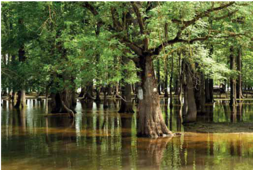
Slika 1 Nizinska poplavna šuma, Park prirode Lonjsko polje

U Hrvatskoj ove funkcije dolaze do izražaja u poplavnim šumama, gdje se očituje i djelovanje šuma na zaštitu ili ublažavanju djelovanja poplava, te u bukovim, odnosno u prebornim jelovim šumama, ali i na drugim mjestima gdje god postoji šuma. Također važno je spomenuti primjer kako se pošumljavanjem na mjestima gdje se ne nalazi šuma (područje krša) povoljno utječe na smanjenje površinskoga otjecanja vode što i je hidrološka funkcija šuma.