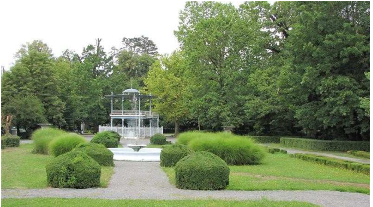
Slika 4.: park u Lipiku

Kao spomenik parkovne arhitekture zaštićen je 12.01.1965.