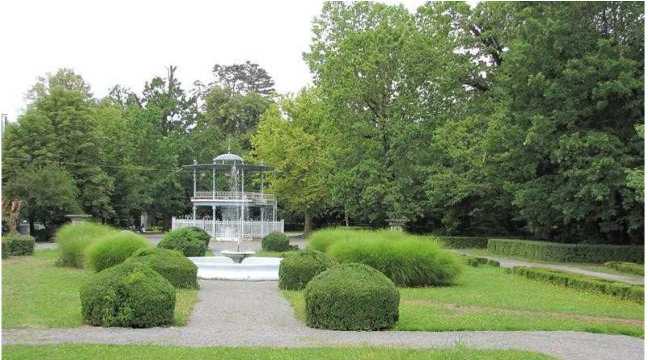
Slika 4.: park u Lipiku

Kao spomenik parkovne arhitekture zaštićen je 12.01.1965.