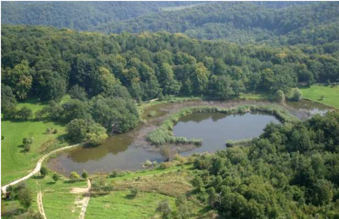
Slika 1.: Sovsko jezero

Cijelo ovo područje sa okolnim šumama, livadama i oranicama površine 68,5 ha proglašeno je značajnim krajolikom 17.04.1989. godine zbog njegove ljepote, pitomosti, te idilične slike koju pruža.