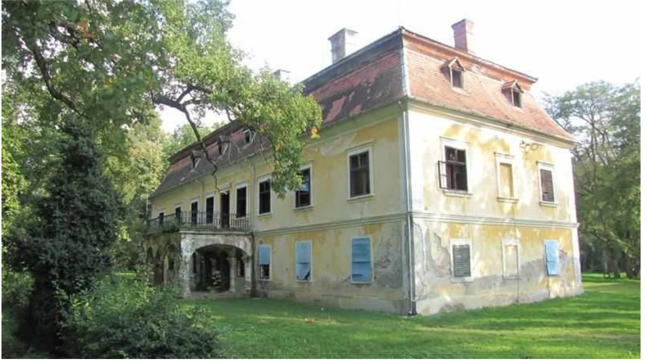
Slika 2.: park u Trenkovu