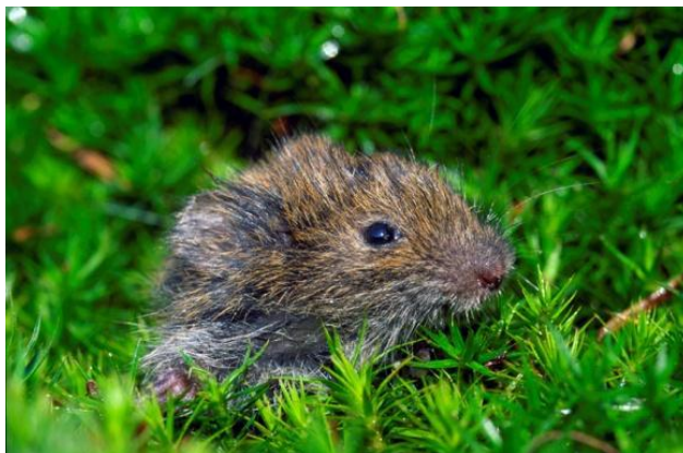
Slika 5. Livadna voluharica prilikom izlaska iz jame