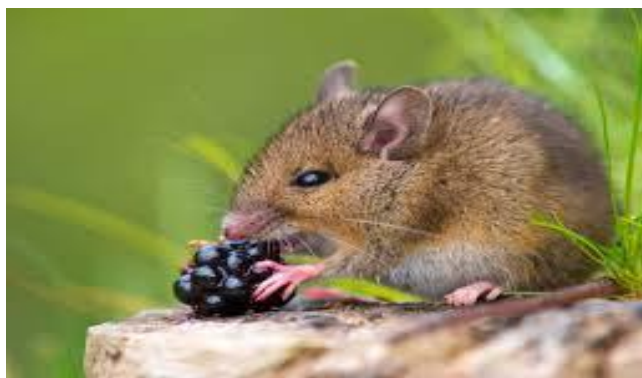
Slika 9. U nedostatku šumskog sjemena može se hraniti i zbirnim plodovima