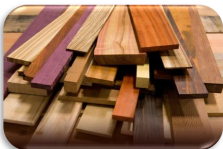
Slika 6: Drvo za građu, jedan od glavnih oblika usluga opskrbe

Prema CICES-u tri su vrste usluga ekosustava: usluge opskrbe (slika 6) , usluge regulacije i održavanja (slika 7), kulturološke usluge (slika 8). One se dalje dijele na sektore, skupine i klase (tablice 4,5, i 6).