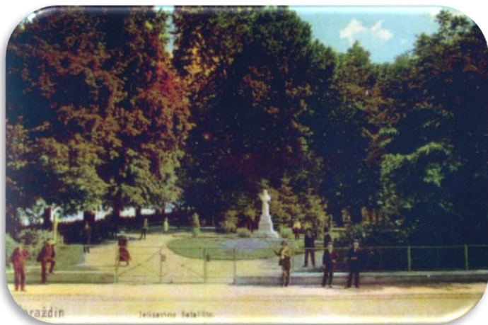
Slika10: Razglednica iz 1917. godine, pogled na ulaz u šetalište