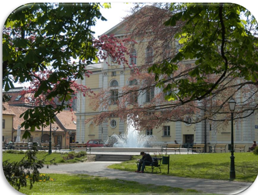
Slika 12: Hrvatsko narodno kazalište u Varaždinu zajedno s kružnom fontanom