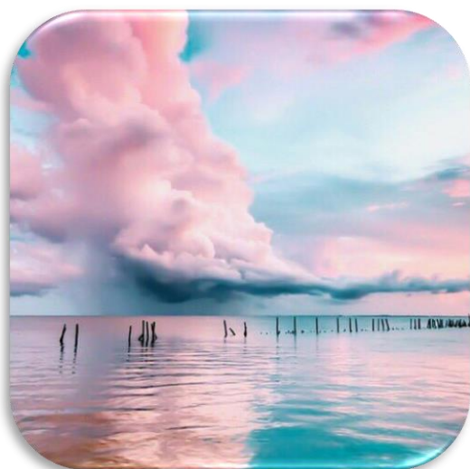
Slika 8: Ljepota obalnih ekosistema daje estetsku vrijednost primorskom krajoliku; kulturološke usluge