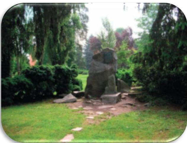
Slika 11: Spomenik dr. Mülleru u središnjem dijelu šetališta