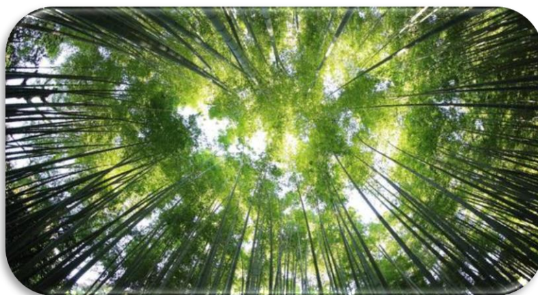
Slika 1: Šume pružaju čovjeku brojne druge koristi

Sredinom 1960-ih pojavljuju se prvi znanstveni opisi funkcioniranja šumskih ekosustava i njihovih funkcija. 1980-ih godina u Njemačkoj je napravljena podjela općekorisnih funkcija šuma, dok je 1992. godine na UN-ovoj konferenciji o okolišu i razvoju naglašena potreba vrednovanja OKFŠ-a. U akcijskom planu za šume EU naglašena je potreba vrednovanja nedrvenih šumskih dobara i funkcija, dok je na skupu Milenijska procjena 2000. godine (Millenium assessment 2000) 1300 znanstvenika definiralo funkcije ekosustava.