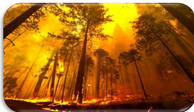
Slika 5: Opožarene šumske površine saniraju se prihodima od naplate općekorisnih funkcija