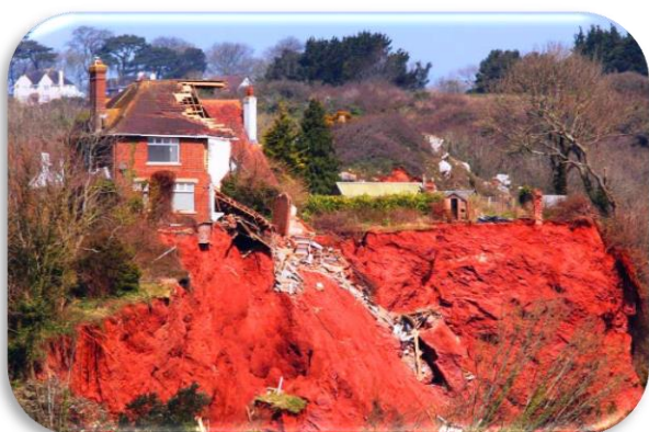
Slika 2: Zemljani odron na površini bez šuma

Iz sredstava naknade za općekorisne funkcije šuma financiraju se brojni projekti i radovi kao što su: obnove šuma, zaštite šuma, gospodarenja šumama na kršu, sanacije i obnove sastojina ugroženih odumiranjem stabala, erozijom (slika 2) ledolomima (slika 4) požarima (slika 5) i drugim nepogodama, izgradnja šumskih prometnica, sjemenarske i rasadničarske djelatnosti u šumarstvu, očuvanje genofonda i podizanje klonskih sjemenskih plantaža, znanstveni radovi iz područja šumarstva, razminiranje šumskih površina (slika 3) te ostali radovi prijeko potrebni za očuvanje i unapređenje općekorisnih funkcija šuma. Iz priloženih primjera možemo vidjeti koliko je bitno za dobrobit šumskih ekosustava naplaćivanje njihovih općekorisnih funkcija. Naplaćivanje naknade za OKFŠ je dodatni prihod kojim se mogu financirati zahvati u šumskim ekosustavima kako bi mogli biti izvor drvene sirovine te općekorisnih funkcija.