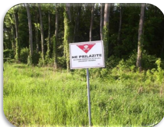
Slika 3: Područje ne razminiranog šumskog tla biti će razminirano pomoću prihoda naplate općekorisnih funkcija