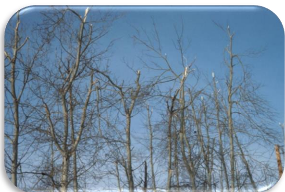
Slika 4: Prihodi od naplate općekorisnih funkcija financiraju sanaciju ledoloma