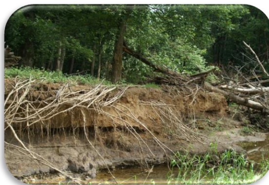
Slika 7: Korijenje drveća sprječava eroziju obale tako vršeći jednu od usluga regulacija i održavanja