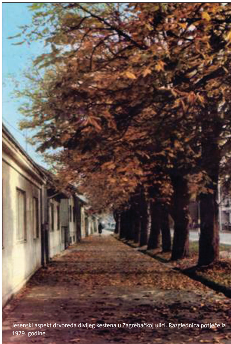
Jesenski aspekt drvoreda divljeg kestena u Zagrebačkoj ulici. Razglednica potječe iz 1979. godine.

promjena na pridanku debla, trulež drveta i veće oštećenje na debalcima (52,9%). U blizini željezničkog kolodvora najčešći simptomi su veće oštećenje na debalcima (100%), negativna promjena na deblu i prijelazu u krošnju, veće oštećenje u krošnji (70,6%) i veće oštećenje na deblu (58,8%). Manje učestće simptoma i grešaka drveta je zabilježeno kod parkovnih stabala, gdje su najčešći simptomi veće oštećenje na debalcima (81,0%), negativna promjena na deblu (66,7%), pukotina na debalcima (57,1%) i negativna promjena u krošnji (52,4%). Vizualno kontrolnom metodom uz dodatnu provjeru rezistografom utvrđena su dva stara stabla koja trenutno treba ukloniti zbog narušene mehaničke čvrstoće te sigurnosti ljudi i imovine.