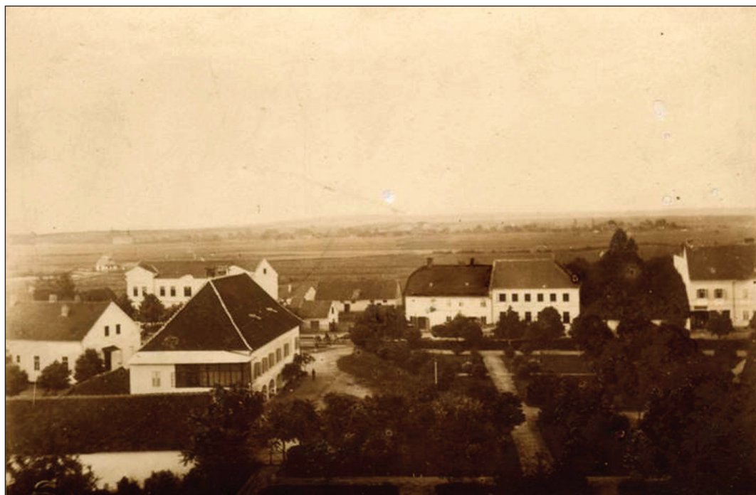
Izgled centralnog parka na kraju 19. stoljeća. Original fotografija Gjüre Szabe.

O povijesti velikogoričkog parka pisao je Laszowski (1910.) u I. svesku „Povijesti Turopolja“. Prostor između vijećnice, crkve i ulice prema crkvi služio je za sajmene potrebe, prije svega za trgovanje konjima. Izgradnjom novih kuća i pretvaranjem centra naselja u urbano središte, potaknulo je ideju o izgradnji parka koji je osnovan oko