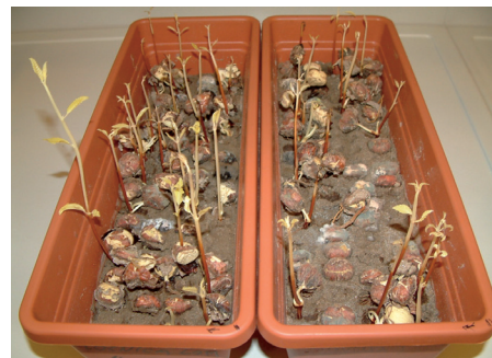
Proklijalo sjeme kestena

Za proizvodnju podloga (sjemenjaka) za cijepjenje treba najprije sakupiti plodove kad se ježice počnu otvarati. Plodovi se sabiru s tla u listopadu ili se mlate štapom s dubećih stabala. U 1 kg ima od 100-230 sjemenki ili u prosjeku oko 160. Sjeme kestena je zbog njegove kvarljivosti i biologije najbolje posijati u jesen nakon sabiranja. Gustoća sjetve iznosi oko 30-40 sjemenki po tekućem metru. Sjeme treba pokriti sa supstratom za sjetvu na dubinu 2-3 promjera sjemena. Sjeme klija podzemno ili hipogeično. Prosječna klijavost iznosi oko 65%.