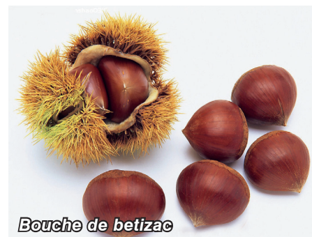
Bouche de betizac