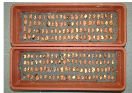
Sjetva u jesen može se obaviti bez stratifikacije

Postoji nekoliko poznatih kultivara pitomog kestena koji su zbog svoje izu- zetne dekorativnosti posebno prikladni za gradske uvjete. To su kultivari „ Al- bomarginata “ ili „ Argenteomarginata “ s rubovima lista kremasto bijele boje, „ Asplenifolia “ s duboko izrezanim listo- vima te „ Marron de Lyon “ koji se koristi zbog ploda, tzv. maruna. Do danas nam nije poznat broj sorti pitomog kestena u Republici Hrvatskoj.