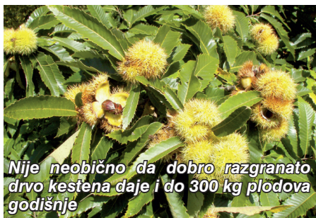
Nije neobično da dobro razgranato drvo kestena daje i do 300 kg plodova godišnje

Kesten ne zahtijeva interventne mjere poput rezidbe iako dobro podnosi orezivanje, s time da se ne preporučuje rezanje debljih grana (promjera većeg od 15 cm) zbog slabog prirodnog zarašćivanja rana. Za branje se koristi mehanizacija (tzv. „usisivači“). Uz investiciju za nabavu „usisivača“ dnevno se može ubrati između 200 i 250 kilograma ploda, za razliku od ručne berbe koja je manje učinkovita i skuplja.