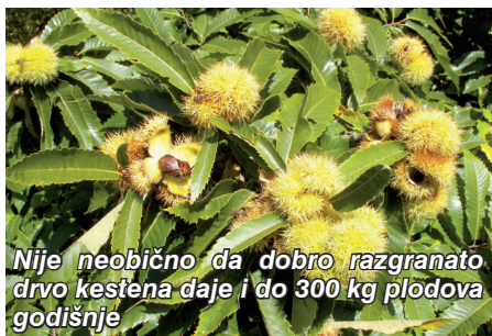
Nije neobično da dobro razgranato drvo kestena daje i do 300 kg plodova godišnje

Kesten ne zahtijeva interventne mjere poput rezidbe iako dobro podnosi orezivanje, s time da se ne preporučuje rezanje debljih grana (promjera većeg od 15 cm) zbog slabog prirodnog zarašćivanja rana. Za branje se koristi mehanizacija (tzv. „usisivači“). Uz investiciju za nabavu „usisivača“ dnevno se može ubrati između 200 i 250 kilograma ploda, za razliku od ručne berbe koja je manje učinkovita i skuplja.