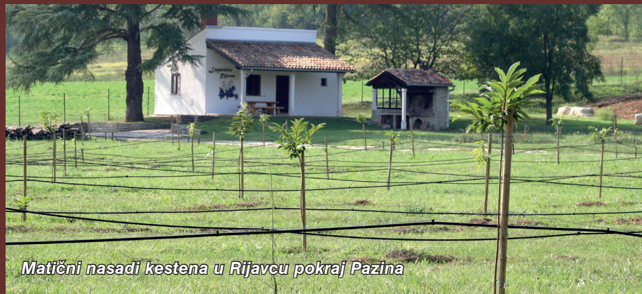
Matični nasadi kestena u Rijavcu pokraj Pazina