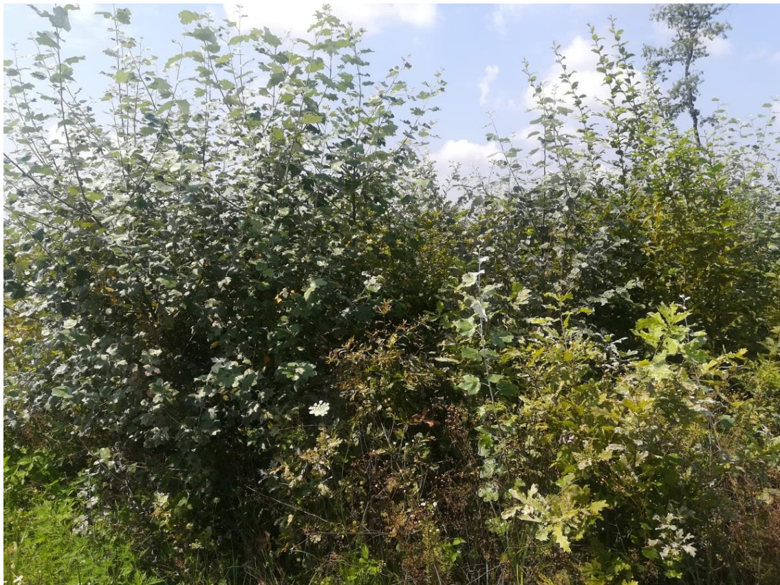
Slika 9: Topole vrlo lako preuzmu dominaciju nad hrastom

ili veljači, kad su ostale drvenaste vrste u zimskome mirovanju i bez listova. Klasična njega sasijecanjem izbojaka kupine nema nikakvoga učinka jer biljka vrlo brzo bujno potjera nove izbojke. Zbog toga je kemijsko tretiranje jedina opcija kod veće pojave kupine.