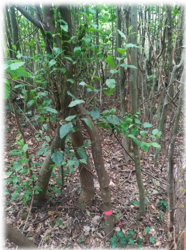
Slika 12: Izgled sastojine za vrijeme čišćenja koljika

zahvate pozitivne selekcije koji se nazivaju prorjede. One započinju nakon dvadesete godine kada se uklanjaju stabla koja smetaju odabranim stablima budućnosti.