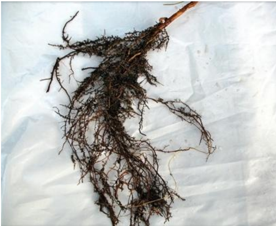
Slika 1. Uzorak korijenja sa mikozirom

Simbiotska zajednica koja se stvara između gljive i korijena stablašice se zove mikoriza (Slika 1.) (grč. mykos =gljiva + rhiza =korijen), a javlja se kod svih golosjemenjača i kod 82% dosad istraženih vrsta kritosjemenjača (Fiziologija šumskog drveća, 2013). Mikorizu je otkrio poljski botaničar Franciszek Kamienski 1880. godine (Čolić, 2013). Micelij gljiva obavija korijenje biljke te uz pomoć tankih i brojnih hifa funkcionalno zamjenjuje korjenove dlačice. Na taj način gljive snabdijevaju biljku mineralnim tvarima, potiču korijenje na rast i grananje te štite biljku od patogenih gljiva i bakterija u tlu, a od biljaka uzimaju ugljikohidrate.