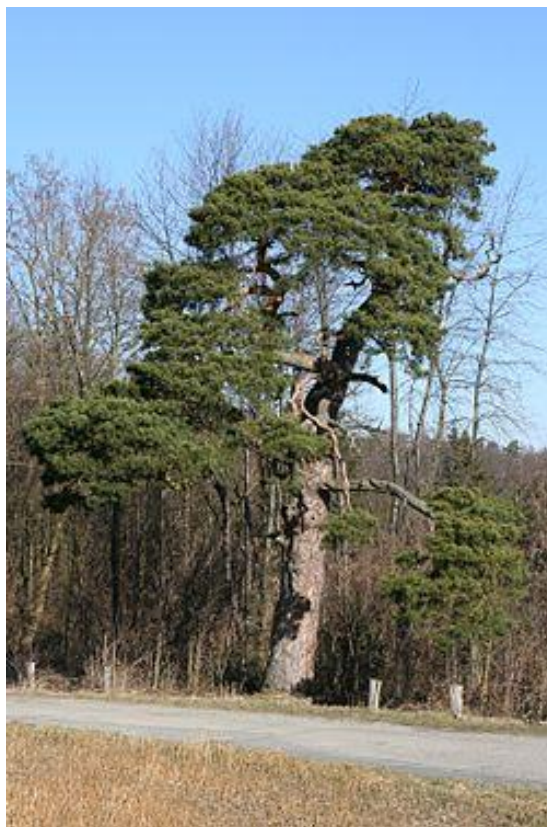
Slika 7. Obični bor ( Pinus sylvestris )

Obični ili bijeli bor (Slika 7.) je crnogorična vrsta drveća iz porodice borovki ( Pinaceae ). Rasprostranjen je na velikom području Europe i sjevernog dijela Azije (Slika 8.). Doseže najčešće između 23 i 27 metara u visinu, može narasti čak i do 40 metara, a širina debla je 1 metar. Ima izuzetno snažan korijen koji prodire duboko u tlo. Kora ove vrste je u početku tanka i crvenosmeđe boje, a starenjem drveta kora postaje deblja i izbrazdana. Igljice su duge 5 – 7 centimetara, smještene su u parovima i ostaju na boru najmanje 2 godine (Houston Durrant i Caudullo).