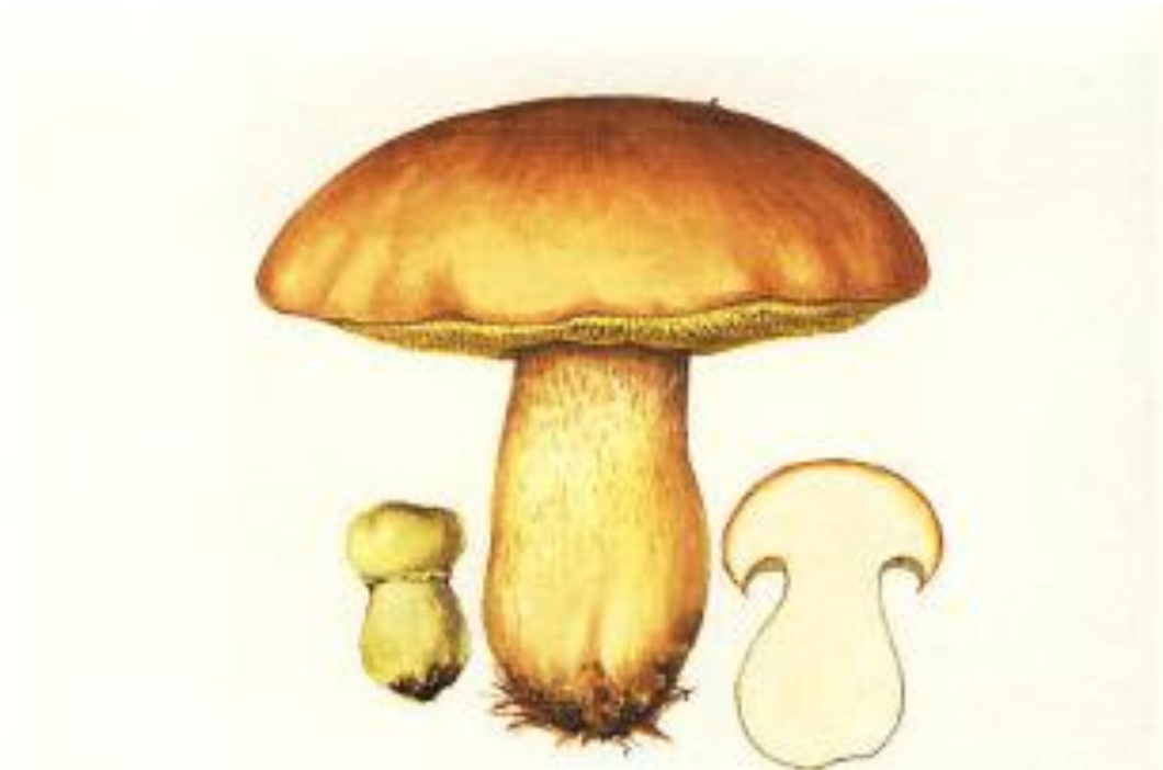
Slika 4. Boletus edulis – pravi vrganj (preuzeto sa Vrhovec, 2006)

Najpoznatija vrsta ovog roda je svakako Boletus edulis (Slika 4.). Vrsta ima mesnat i tvrd klobuk. Kožica je sitno naborana, a pod utjecajem visoke količine vlage postaje izuzetno sjajna. Stručak je debeo i čvrst, a može biti valjkast ili trbušast, te je prožet nježnobijelo do smeđom mrežicom. Klobuk može mijenjati boju, ovisno o starosti, staništu i sličnim okolnostima. On može biti bijel, svijetlo do tamnosmeđ, kestenjastocrvenkast, čak i siv, a rub mu je uvijek malo svjetliji od sredine. Tanke i duge cjevčice nisu pričvršćenje za stručak te se mogu odvojiti od klobuka. Raste u pravilu od kraja ljeta do kasne jeseni, u šumama četinjača, pretežno na prozračnim mjestima (Vrhovec, 2006).