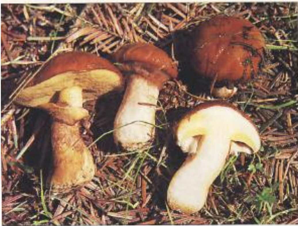
Slika 6. Suillus luteus – osinac.

Osim navedene vrste, u Republici Hrvatskoj poznat je još i Suillus granulatus (zrnati sluzavac).