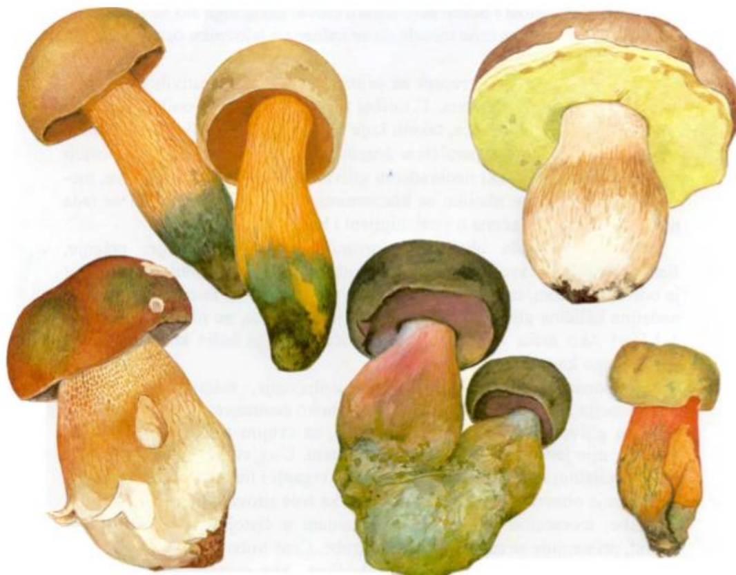
Slika 3. Rod Boletus – pravi vrganji

Pravi vrganji (Slika 3.) su rod gljiva unutar porodice Boletaceae . Pretpostavlja se da danas postoji više od 100 vrsta unutar ovog roda. Opisao ih je Carl Linnaeus 1753. godine. To su krupne gljive koje imaju robusnu dršku (Medved, 2015). Imaju trbušast stručak koji je izuzetno mesnat, pun i sa istaknutom mrežicom te je postavljen centralno u odnosu na klobuk bez vjenčića (Širić i sur., 2012). Neke vrste mogu promijeniti boju mesa na zraku ili na dodir, ali to nije znak otrovnosti gljiva nego je jedna od karakteristika koje pomažu pri determinaciji jedinke (Božac, 2003). Raste u svim šumama i gotovo sve vrste žive u simbiozi (Božac, 1963). Vrste unutar ovog roda formiraju s biljkom ektomikorizu (Božac, 2008).