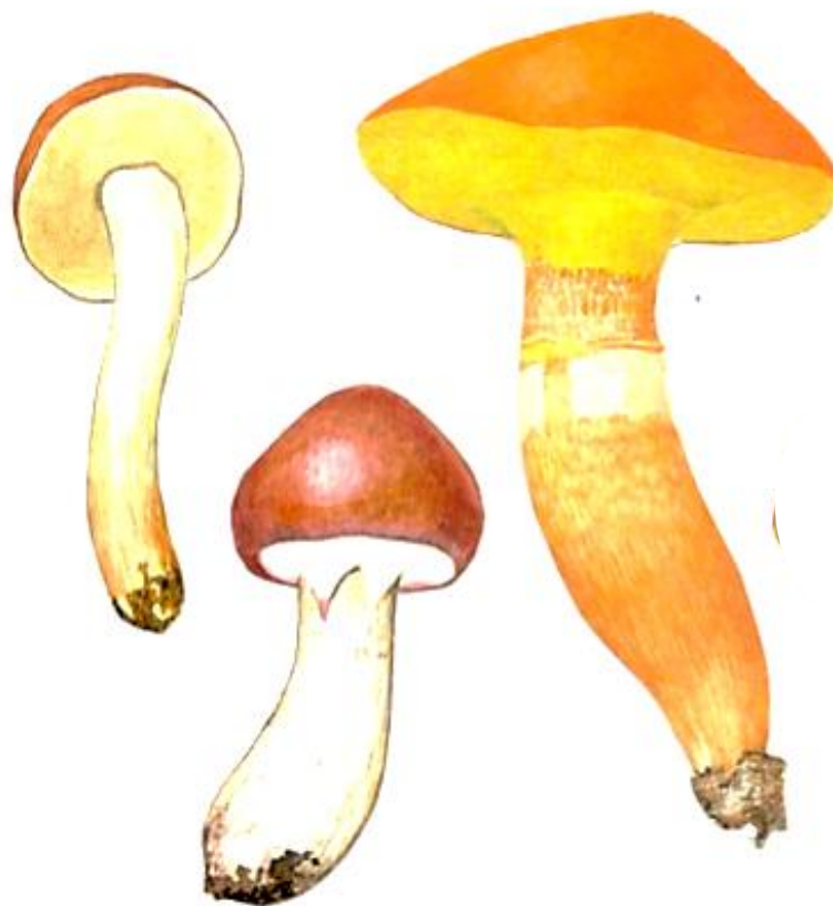
Slika 5. Rod Suillus – slinavke; s lijeva - Suillus granulatus , Suillus luteus i Suillus gravillei (preuzeto sa Uzelac, 2005)

Slinavke (Slika 5.) su prosječno manje gljive koje se uglavnom vežu za zimzelene vrste drveća (Medved, 2015). Uglavnom rastu na područjima sjeverne hemisfere, iako su neke vrste otkrivene i u područjima južne hemisfere (Kirk i sur., 2008). Iako se nekoliko vrsta rasprostire u tropskim regijama (obično u planinskim područjima), većina ih je ograničena na umjerena područja (Singer, 1986). Imaju pun i točkast stručak koji je smješten ispod klobuka sa vjenčićem (Širić i sur., 2012). Klobuk je prekriven kožom koju obavezno treba oljuštiti, a sve vrste su dobre za sušenje (Uzelac, 2005). Micelij je žut, maslinast ili narančast (Božac, 1963). Sve vrste iz ovog roda tvore simbiotski odnos sa vrstama iz porodice borovki, posebno sa vrstama iz rodova Pinus , Larix i Pseudotsuga (Daljev, 2017).