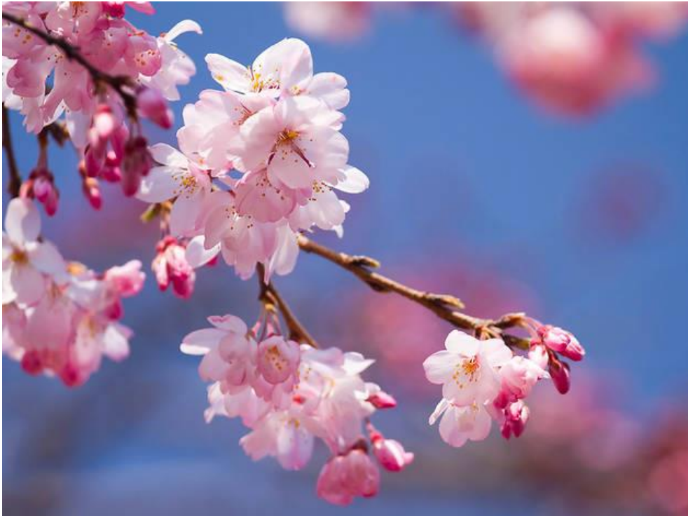
Slika 9. Cvat trešnje

kod entomofilnih oni su lijepih šarenih boja s razlogom da ih kukci (i pčele) lakše uoče te opraše.