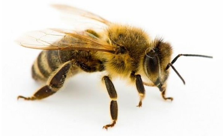
Slika 3. Radilica

pčela u dobi kada se njihove mliječne žlijezde nalaze u funkciji, ostaju te žlijezde i dalje razvijene, pa u tim slučajevima mogu i starije pčele izlučivati mliječ (npr. iza rojenja, iza zimovanja). Poslije 12. dana života u radilica se počinju naglo razvijati voskovne žlijezde koje ostaju razvijene prosječno do 18. dana. U tom životnom razdoblju radilice obilno izlučuju vosak i marljivo grade saće. Oko 18. do 21. dana života radilice vrše stražarsku službu na letu. Te pčele stražarice smještene su oko leta i paze tko ulazi u košnicu. One navaljuju na druge kukce koji bi željeli ući (npr. na ose, leptira mrtvačku glavu). Navaljuju i na čovjeka kad se previše približi letu. Stražarice mirno propuštaju u košnicu pčele drugih košnica kad se one vraćaju s paše natovarene hranom i zabunom uđu u tuđu košnicu. Međutim, veoma oštro navaljuju na pčele drugih košnica kad ove žele ući s namjerom da krađu med. Pri kraju toga prvog razdoblja života mlade kućne pčele izlaze sve češće iz košnice i vrše kratke orijentacijske letove, da bi upoznale okolicu, Navedena razdioba rada kućnih pčela nije kruto vezana na spomenute rokove, već pojedina vrsta rada postepeno prelazi jedna u drugu, a prema potrebi mogu se pojedini rokovi rada skratiti ili produljiti.