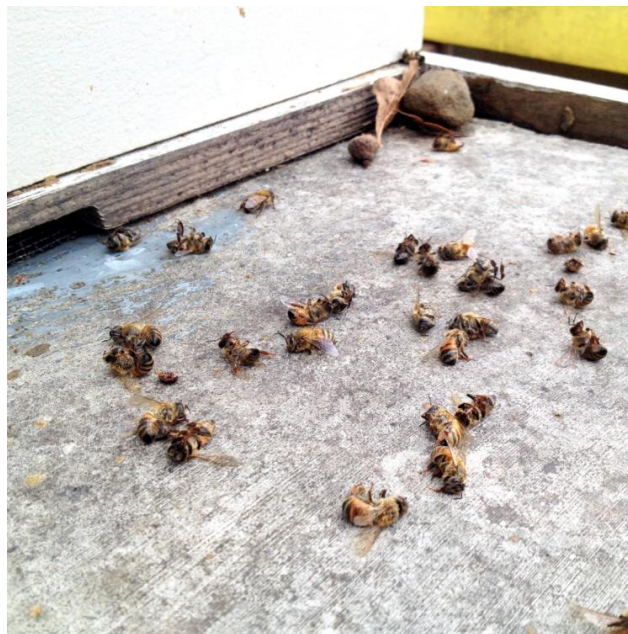
Slika 7. Uginule pčele zbog utjecaja pesticida

Piretroidi na realističnoj razini izloženosti, čini se da utječu na povratak u košnicu pčela sakupljačica. Tretman permetrinom rezultira time da se 43% sakupljačica vrati jednom u koloniju i samo 4% dva puta, s tim da nijedna tretirana pčela nije bila prisuta idućeg jutra (89% pčela kontrolne skupine je bilo prisutno). Većina tretiranih pčela postalo je toliko dezorijentirano da se nisu mogle vratiti u zajednicu. Te pčele su također pokazale ozbiljne poremećaje u ponašanju, npr. provođenje više vremena u samočišćenju, drhtav ples, boranje abdomena, rotiranje i čišćenje abdomena, te su provodile manje vremena u potragom za hranom. Uočeno je da tretiranje sakupljačica neonicotidnim insekticidom, ima blagi utjecaj na preciznost kod prenošenja podataka o smjeru i značajan utjecaj na prenošenje podataka o udaljenosti izvora hrane na povratku u zajednicu. Manja je motivacija da se izvede ples zatkom i porast drhtavog plesa. Sposobnost sakupljačica da se vrate može uvelike utjecati na preživljavanje zajednice budući da regrutiranje pčela hraniteljica da tragaju za hranom smanjuje proizvodnju legla. Učinak na prenošenje informacija o izvoru hrane je možda manje značajan budući da će pčele vjerojatno tragati za hranom prije nego se vrate bez nektara ili peludi.