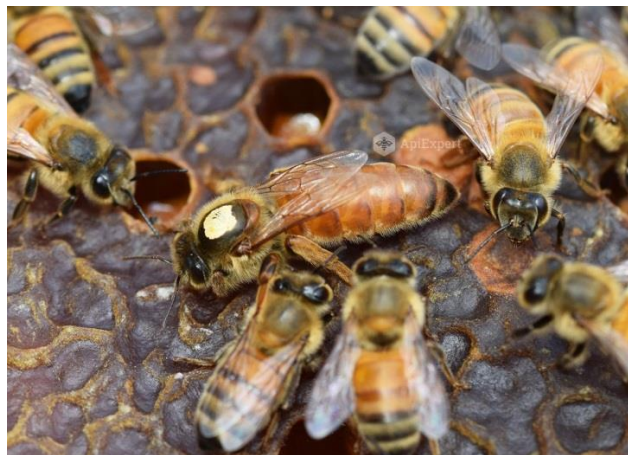
Slika 1. Bojom označena matica okružena radilicama

Izlaganje ličinke kod pčela traje 6 dana, kod matica – 5, a kod trutova – 7 dana. Prva tri dana mlade pčele hraniteljice hrane ličinke pčela, matica i trutova matičnom mliječi, koji sadrži sekrecije gornjovilične i pod ždrijelne žlijezde i bogat je lako probavljivim hranjivim tvarima i biostimulatorima. Smatra se da u sastav mliječi ulazi i sekrecija tjemene žlijezde, koja je bogata masnoćama. Trećeg dana hrani ličinki pčela i trutova pčele dodaju i kašicu od meda i peluda, koju pripremaju u svojoj mednoj voljki, a od četvrtog dana do kraja tog stadija samo kašicu. Ličinke matica se u toku cijelog perioda bogato hrane samo mliječi, što omogućava da se od njih razviju spolno razvijene ženke maticice. Sa povećanjem ličinke maticice pčele postepeno izvlače i zidove matičnjaka. Pčele hraniteljice posjećuju ličinku prosječno 1300 puta dnevno, da bi joj dali hrane, ili oko 8000 puta u toku cijelog razvoja. Pomoću peristaltičkih pokreta tijela ličinka se kreće kružno na dnu ćelije i kroz usni otvor ona prima hranu, koja prelazi kroz prednje u srednje crijevo. Neprobavljeni ostaci hrane se ne izbacuju u ćeliji već se gomilaju u srednjem crijevu, zbog toga je ono dosta veliko i zauzima skoro čitavu šupljinu tijela. Na taj način se hrana u ćeliji ne prlja ekstrementima. Zahvaljujući pojačanom hranjenju, ličinka brzo raste i gomila velike zalihe hranljivih tvari – masno tkivo.