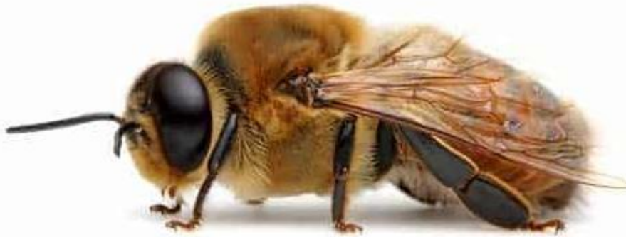
Slika 2. Trut