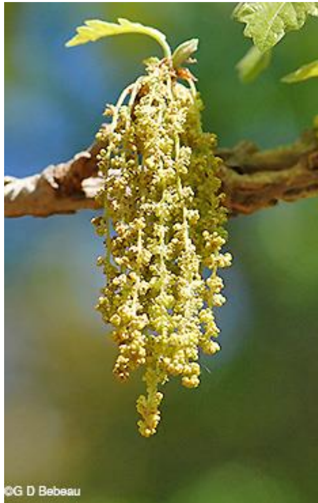
Slika 8. Muški cvat kod hrasta

Što se tiče ukupnog utjecaja pčela na šumarstvo vrlo je važno napomenuti da nisu sve drvenaste vrste oprašivane od strane kukaca. Mnoge naše glavne vrste drveća su anemofilne i nije im potrebna prisutnost pčela za formiranje plodova. Hrastovi i bukva, koje su dvije naše glavne vrste drveća, se oprašuju vjetrom.