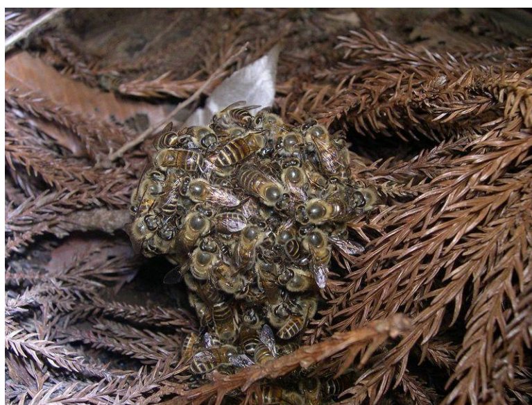
Slika 6. Obrambeni mehanizam japanskih pčela medarica

Kod japanskih pčela medarica ( Apis cerana japonica ) postoji određen mehanizam obrane od stršljenova. Iako stršljeni imaju tvrd oklop kojeg žalac pčela ne može probiti oni nisu otporni na visoke temperature kao pčele. Prilikom dolaska izviđača stršljena one, prije nego stršljen stigne obilježiti košnicu svojim feromonima pomoću kojih ostali stršljenovi pronađu tu košnicu, si vibrirajući zadkom signaliziraju uljeza i plan napada. Nakon toga pčele se čvrsto skupe u kuglu u čijoj sredini se nalazi uljez te vibrirajući podižu temperaturu što uzrokuje da se stršljen doslovno skuha.