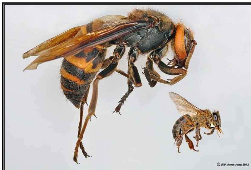
Slika 5. Usporedba pčele medarice i velikog japanskog stršljena ( V.mandarinia )