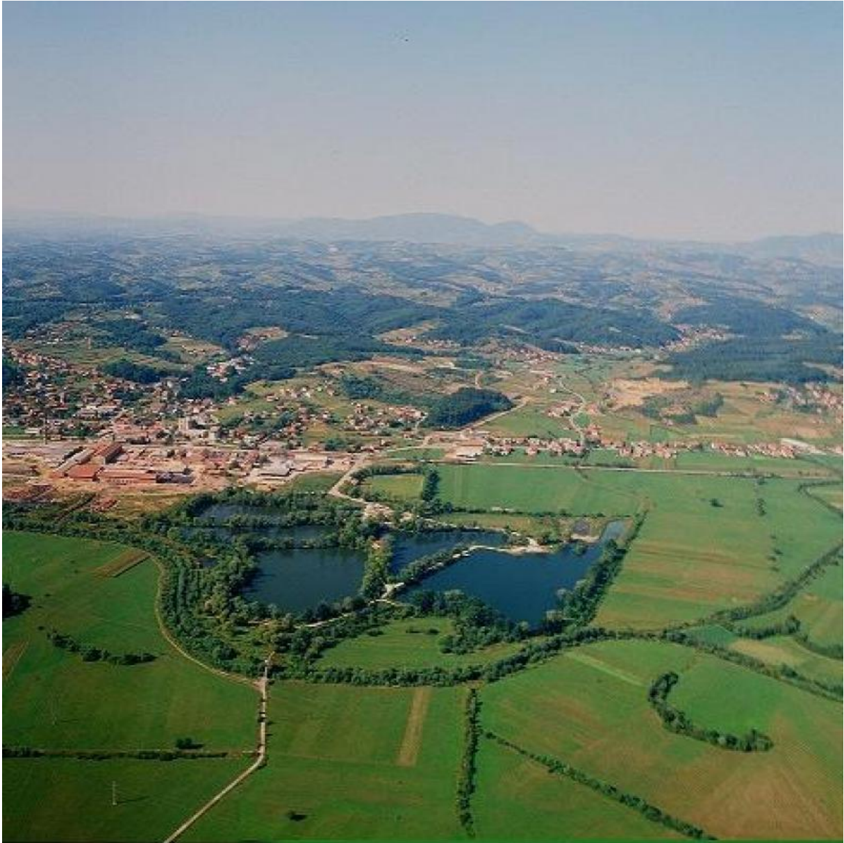
Slika 3. Bedekovčanska jezera iz zraka, zajedno s dijelom Bedekovčine

Kartu kopnenih nešumskih staništa Republike Hrvatske 2016. izradila je Hrvatska agencija za okoliš i prirodu (dalje u tekstu: HAOP), prema Nacionalnoj klasifikaciji staništa (NKS). Prema Karti kopnenih nešumskih staništa, staništa koja nalazimo na području i u neposrednoj blizini Bedekovčanskih jezera su sljedeća: