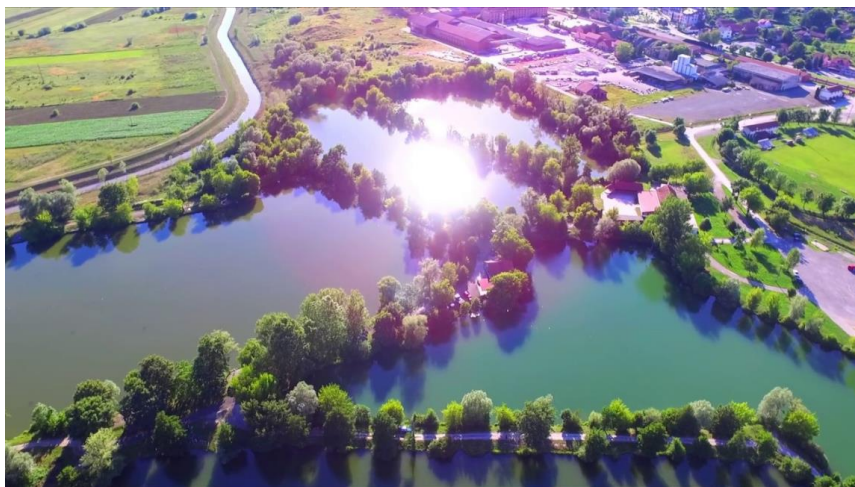
Slika 5. Bedekovčanska jezera iz zraka, zajedno s obrađivanim poljoprivrenim površinama, prostorom tvrtke "Tondach Hrvatska" d.o.o., te sportskim terenom

Jezerca se pune prvenstveno podzemnim, zatim površinskim, oborinskim i slijevnim vodama. Izvorišta vode na koja se naišlo prilikom kopanja gline bila su pitka, pa je posljedično s time prije 30-ak godina kakvoća vode u jezerima bila za piće, te se vodi kao moguća rezerva u slučaju rata ili elementarnih nepogoda. Kroz godine je u jezerima sedimentirao anorganski materijal i poraslo je prisustvo živih organizama, pa su jezera danas srednje eutrofna. Procesu eutrofikacije može posvjedočiti i smanjivanje dubine jezera (zbog sedimentacije materijala). Dubina jezera u vrijeme kada su nastala bila je 6-8m, a danas je 1,5 - 4m.