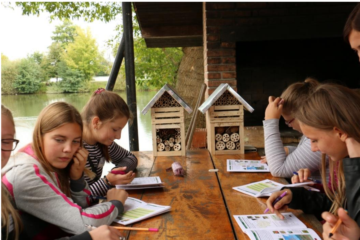
Slika 8 : Edukativni program „Ptiček“ – detalj s terenske radionice na Bedekovčanskim jezerima

Prema metodološkom obrascu programa „Ptiček – mali čuvari prirode Krapinsko-zagorske županije“, istome mogu pristupiti najuspješniji učenici pojedinih osnovnih škola Krapinsko-Zagorske županije kroz rješavanje pristupnog testa. Radionice, koje se odvijaju u dva dana po četiri sata, između ostalog uključuju predavanja i vođene šetnje u prirodi na temu vrijednosti i posebnosti lokaliteta na kojima se odvija projekt, vezano uz njegovu povijest, bioraznolikost, tipove i načine očuvanja staništa, ekosustava i vrsta, zatim predavanja o kulturnoj baštini i zaštićenim djelovima prirode Krapinsko-Zagorske županije i o Naturi 2000. Polaznici tijekom terenskih radionica popunjavaju radnu bilježnicu, a na kraju drugog dana, po svršetku radionica i obavljenim svim zadacima iz radne bilježnice, dodjeljuju im se potvrde “Mali čuvari prirode Krapinsko-zagorske županije”, nakon čega se upisuju u službeni registar.