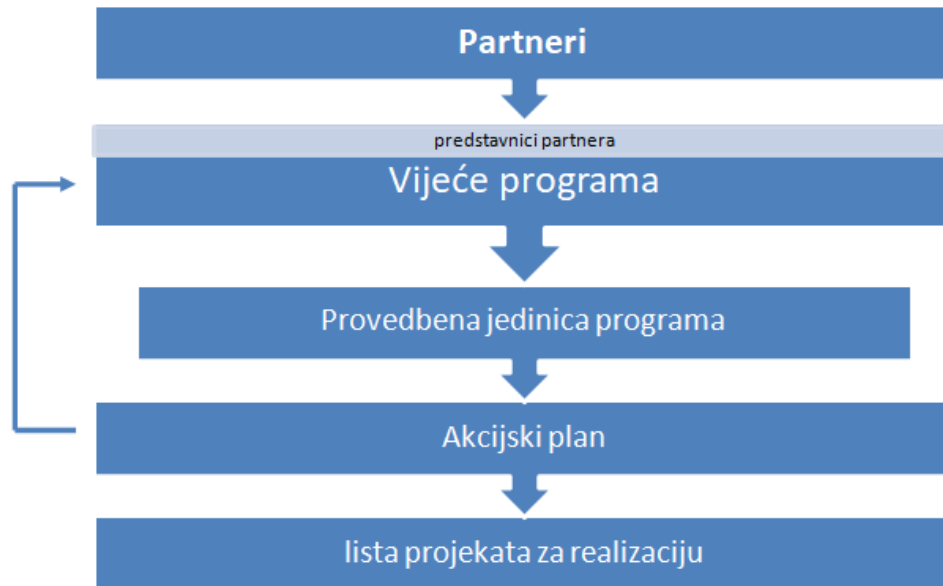
Slika 9: Upravljačka shema uspostave projektnog modela za realizaciju višenamjenskog korištenja Bedekovčanskih jezera