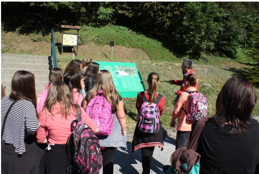
Slika 7 : Edukativni program „Ptiček“ – detalj s terenske radionice u „ZK Zelenjak – Cesarska i Risvička gora“

Već više od deset godina Javna ustanova za upravljanje zaštićenim djelovima prirode Krapinsko-zagorske županije provodi projekt malih čuvara prirode - "Ptiček". Projekt je namjenjen za učenike šestih i sedmih razreda osnovnih škola sa područja Krapinsko-zagorske županije. Program se provodi kroz dvodnevne terenske radionice koje uključuju vođene edukativne šetnje na lokalitetima Bedekovčanskih jezera (prvi dan), te na području značajnog krajobraza Zelenjak-Risvička i Cesarska gora (drugi dan). Radionice provodi trenerski tim stručnjaka Šumarskog fakulteta u Sveučilišta u Zagrebu, Geološkog odsjeka Prirodoslovno-matematičkog fakulteta Sveučilišta u Zagrebu i „Hrvatskih šuma“ d.o.o. Zagreb. Cilj projekta je edukacijom senzibilizirati djecu osnovnoškolskog uzrasta na razumijevanje zadaće očuvanja i zaštite prirode te potaknuti ih na sudjelovanje u provođenju akcija i mjera zaštite bioraznolikosti te očuvanja prirodnih resursa i okoliša u cjelini.