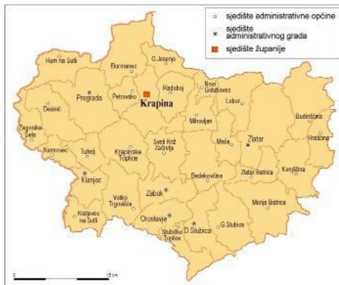
Slika 1: Karta Krapinsko-zagorske županije

Općina Bedekovčina, čijem prostornom okviru pripada područje Bedekovčanskih jezera, smještena je u središnjem djelu Krapinsko-Zagorske županije, Središte općine je naselje Bedekovčina.