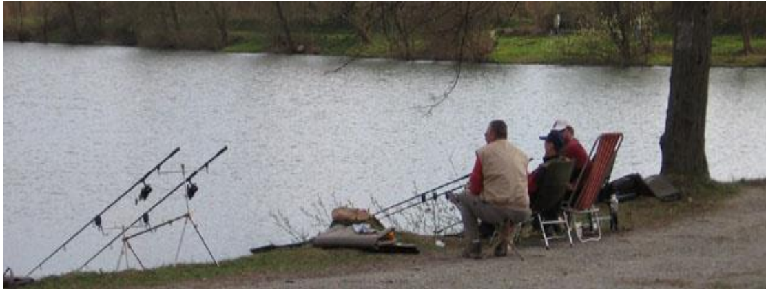
Slika 6: Rekreacijski ribolov na Bedekovčanskim jezerima

rekreacijsku i sportsku aktivnost. Time bi se pogodovalo razvoju poduzetničke klime šireg područja.