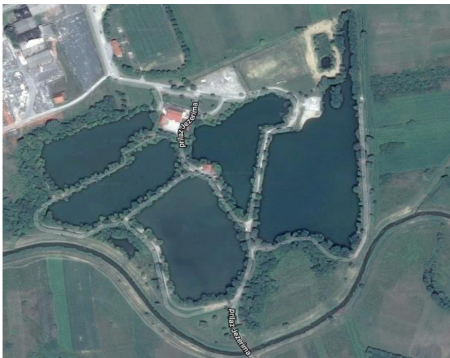
Slika 2: Satelitska snimka Bedekovčanskih jezera

Uz navedena jezera postoji i još jedno manje jezero „Barica“ površine 0,044 ha.