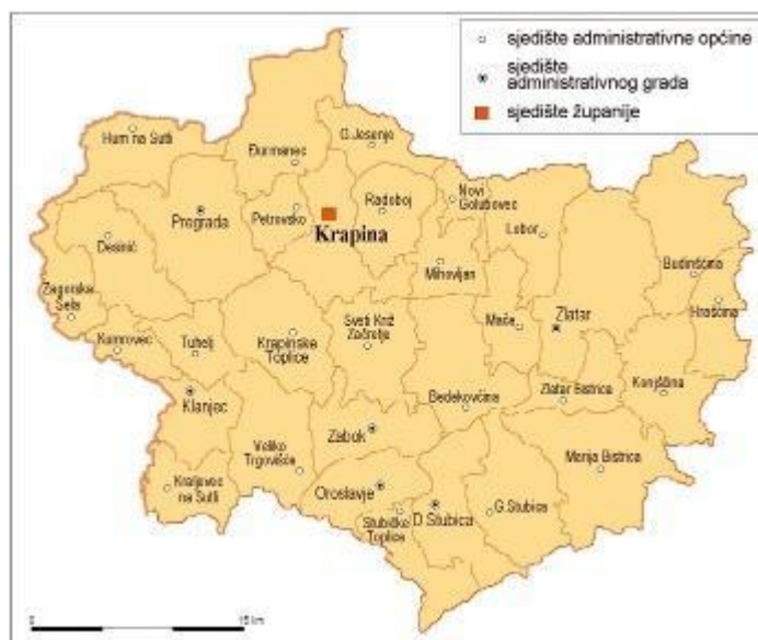
Slika 1: Karta Krapinsko-zagorske županije

Općina Bedekovčina, čijem prostornom okviru pripada područje Bedekovčanskih jezera, smještena je u središnjem djelu Krapinsko-Zagorske županije, Središte općine je naselje Bedekovčina.