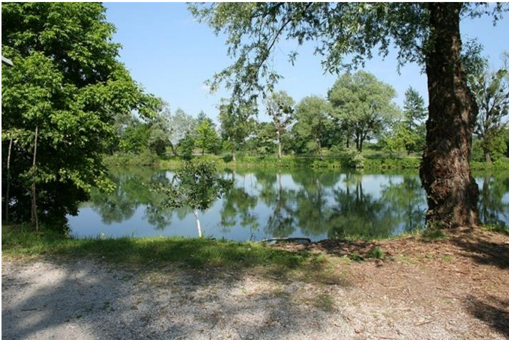
Slika 4: Detalj sa Bedekovčanskih jezera

Fauna i flora Bedekovčanskih jezera nije u potpunosti istražena. Najbolje je istražena ornitofauna za koju je 2012. godine izrađena inventarizacija, a prilikom čije izrade su zabilježene i vrste iz ostalih skupina životinja i biljne vrste koje su uočene. Posljedično se ne može tvrditi da Bedekovčanska jezera jesu ili nisu stanište gore navedenih zaštićenih vrsta, izuzev onih nekoliko koje su uočene prilikom inventarizacije. Posebno se to odnosi na životinjske vrste jer su životinje mobilne i teže ih je uočiti od biljaka. S obzirom na ugroženost i nestajanje vodenih staništa, Jezera čine potencijalno stanište za neke od gore navedenih zaštićenih vrsta životinja i biljaka koje su vezane uz takva staništa, čak i ako ih za sada tamo ne nalazimo.